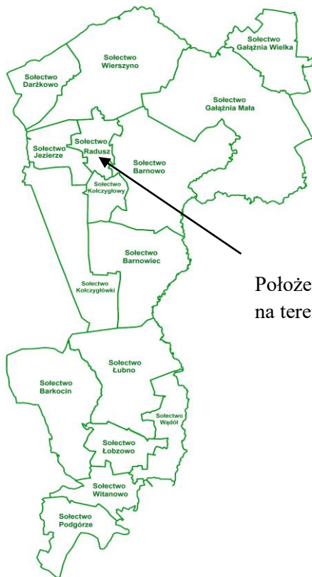
Położenie Sołectwa Radosz na terenie Gminy Kołczygłowy