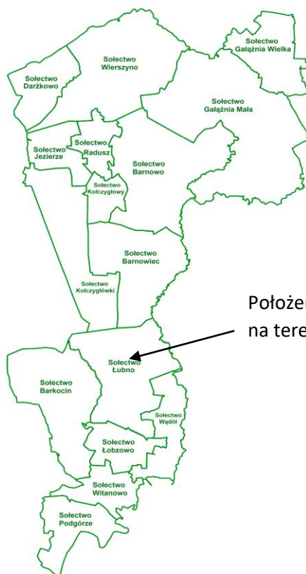
Położenie Sołectwa Łubno na terenie Gminy Kołczygłowy