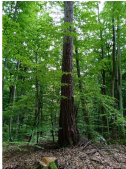
Modrzew europejski M1