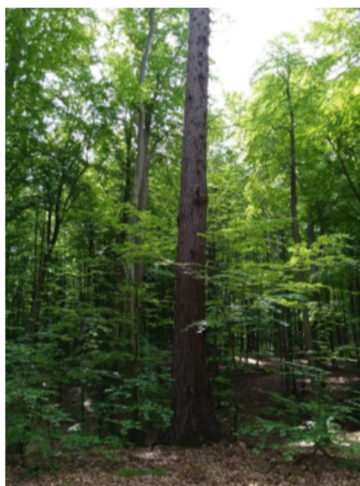
Modrzew europejski M2