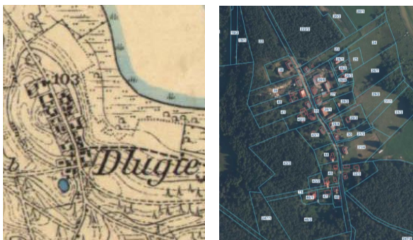
Ryc. 2. Wieś Długie w 1910 r. na historycznej mapie Mestischblatter oraz współcześnie w podziale ewidencyjnym na tle ortofotomapy.

Długie, to wieś ulicówka nad jeziorem Długie, z zachowaną drewnianą, tradycyjną kociewską architekturą – wiele obiektów z miejscowości Długie proponowanych jest do objęcia ochroną poprzez wpis do rejestru zabytków.