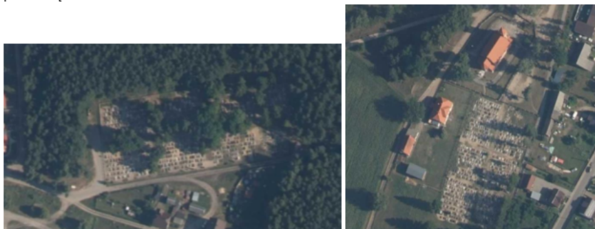
Fot. 1-2. Cmentarze: w Szlachcie oraz w Osiecznej na ortofotomapie.

Z dawnych układów zieleni cmentarnej właściwie pozostał tylko układ zieleni na cmentarzu w Szlachcie. Są to nasadzenia drzew w formie alei, tworzącej oś centralną cmentarza. Na cmentarzu w Osiecznej brak już alei brzozonej, która biegła przez środek cmentarza, aktualnie na cmentarzu pozostały pojedyncze drzewa. Podobnie z zielenią wysoką bezpośrednio otaczającą sąsiadujący z cmentarzem, kościół w Osiecznej. Brak wysokich drzew, jednak od północnej strony utrzymana jest aleja brzozonej prowadząca do kościoła.