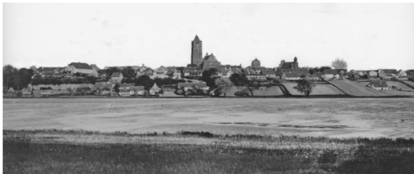
Widok Prabut od strony zachodniej z 1899 r.

Prabuty, Pl. Katedralny, kościół filialny p.w. Św. Wojciecha – zbudowany w latach 1310-1330. Do 1525 r. w rękach katolików, do 1945 r. – ewangelików, od 1982 r. ponownie służy katolikom. Zniszczony w czasie wojny polsko-krzyżackiej, następnie odbudowany. W 1688 r. pożar zniszczył wyremontowany w 1619 r. dach. W 1842 r. dokonano gruntownej przebudowy przedsionka, nadając mu neogotycki wygląd. W czasie II wojny światowej świątynia uległa poważnym zniszczeniom, odbudowana została dopiero w latach 80-tych XX w. Pod względem formy nawiązuje do katedry kwidzyńskiej. Świątynia halowa z trójbocznym prezbiterium, z dostawioną do niego od północy masywną wieżą. Kryty dachem dwuspadowym, trójbocznie zakończonym nad prezbiterium, wieża kryta dachem namiotowym. Korpus i prezbiterium oszkarpowane, od północy otynkowana wczesnobarokowa kaplica. Wnętrze salowe kryte stropem drewnianym. Na szczycie zachodnim prezbiterium pozostałości okulusowej dekoracji ściany charakterystycznej dla początków XIV w. Maswerki z XIX-wiecznymi witrażami w oknach.