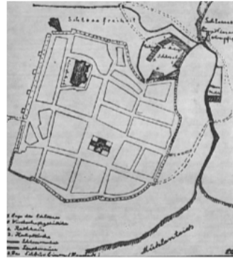
Rekonstrukcja układu przestrzennego Prabuty w 1400 r. z Ilustracji z dziejów miasta i powiatu , red. A. Wakar, M. Lossman, Olsztyn 1972, s. 67.

Zabudowa wiejska ogranicza się do kilku typów zabudowy pochodzącej przeważnie z końca XIX w., przełomu XIX i XX w. i lat 20-tych i 30-tych XX w. Zabudowa drewniana została wyparta przez zabudowę murowaną w okresie zaborów pruskich. Zachowane do dziś budynki to zabudowa murowana: budynki mieszkalne murowane z cegły licówki bądź otynkowane, dwukondygnacyjne