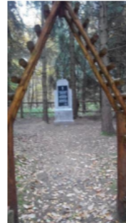
Cmentarz wojenny w Niebędzinie

Wśród cmentarzy na terenie Gminy Nowa Wieś Lęborska wyróżnia się również cmentarz więźniów rosyjskich w Niebędzinie. Na wniosek gminy, Pomorski Urząd Wojewódzki w 2010 r. uznał cmentarz za nekropolię wojenną z okresu I wojny światowej.