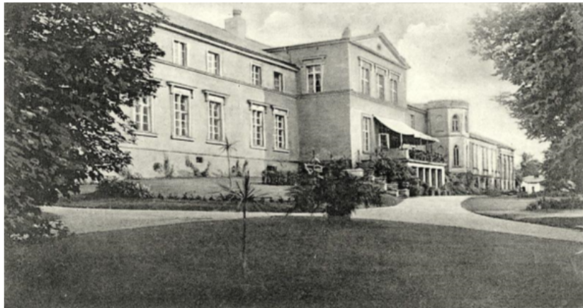
Pałac w Janowicach (1920-1940r.)