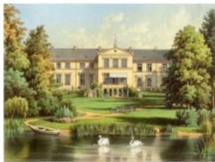
Janowice –Zespół parkowo-palacowy 1920-1940

Na terenie Gminy Nowa Wieś Lęborska przy zespołach dworsko - folwarcznych w XVIII i XIX w. powstawały parki. Swoją ostateczną charakter i styl uzyskały w XIX w. W większości zachowany jest w nich pierwotny układ przestrzenny mimo utraty części drzewostanu. W większości w parkach brakuje bieżącej pielęgnacji stąd utraciły one swoje walory estetyczne.