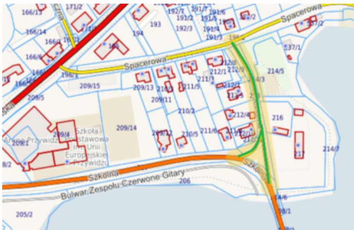
Ulica Jeziorna w miejscowości Przywidz

Załącznik nr 1 do Uchwały Nr L/438/2023 Rady Gminy Przywidz z dnia 29 listopada 2023 r