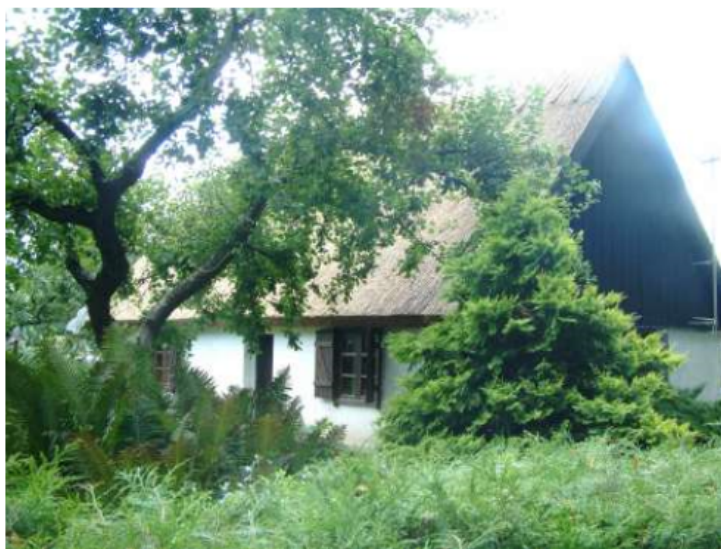
➤ Chałupa z poł. XIX w., Nierostowo nr 18: