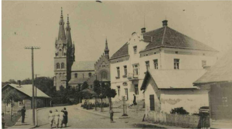
Ilustracja 1 - Rynek w Jedliczu. Fotografia z 1942 r.