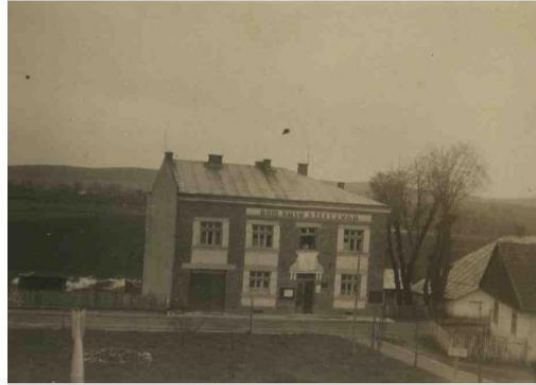
Ilustracja 8 - Dom Kasy Stefczyka. Fotografia z lat 40. XX w.