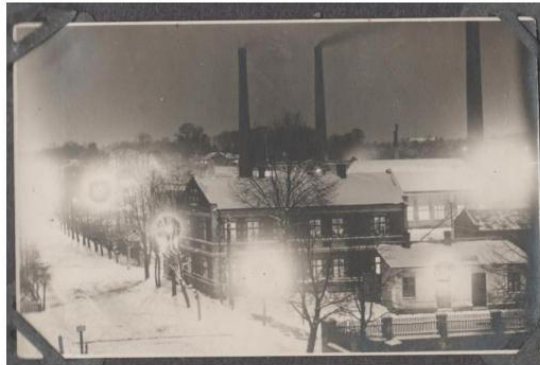
Ilustracja 11 - Rafineria Nafty w Jedliczu, fotografia wykonana nocą, lata 30. XX w.

Od południowo-zachodniej strony do zespołu rafinerii przylega zespół budynków administracyjnych i mieszkalnych dla pracowników.