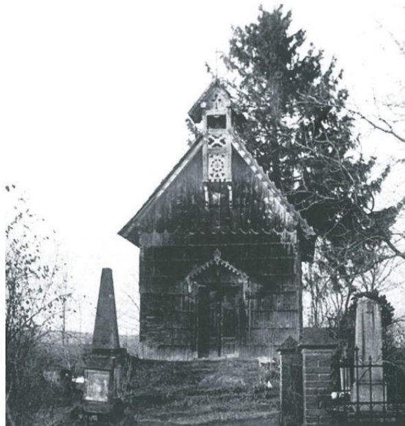
Ilustracja 5 - Kaplica pw. Jezusa Ukrzyżowanego – fotografia z lat 20. XX w.

Kaplica ta jest jednym z niewielu zachowanych w województwie podkarpackim drewnianych kościółków cmentarnych. Obiekt ten posiada duże znaczenie historyczne i kulturowe. Obecnie stanowi własność Gminy Jedlicze. W dniu 8.11.2007 r. Kaplica została wpisana do krajowego rejestru zabytków pod numerem A-213. W tym samym roku do rejestru zabytków pod numerem B-207 w dniu 17 lipca wpisano również polichromię, mensę ołtarzową i krucyfiks.