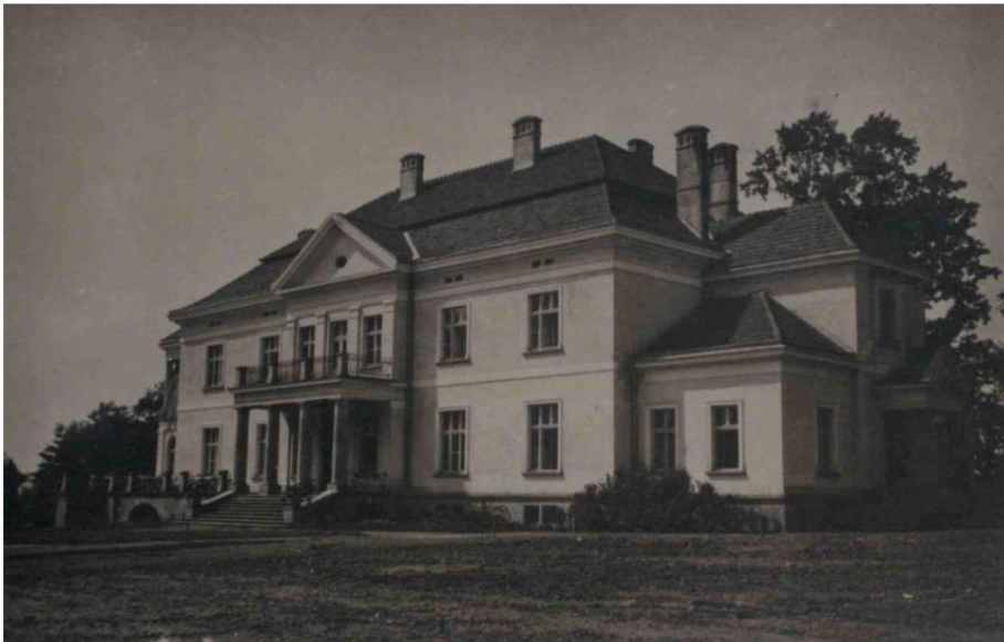
Ilustracja 6- Pałac Stawiarskich w Jedliczu. Fotografia z lat 20. XX w.

Pałac Stawiarskich otacza zabytkowy park krajobrazowy z licznymi starymi dębami. Głównym elementem parku są liczne drzewa, z przewagą dębu szypułkowego. Najokazalszy z nich u podstawy skarpy ma 700 cm obwodu. Występują także graby pospolite, jesiony wyniosłe, lipy szerokolistne, a zwłaszcza wielopniowy klon jawor. Niektóre z nich osiągają imponujące rozmiary. Z drzew obcego pochodzenia występują: sosna czarna i cyprysik groszkowy. Na początku XX w. posadzono na dużą skalę topole wielkolistne.