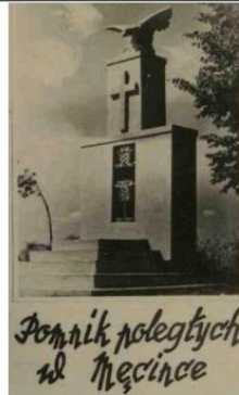
Ilustracja 10- Pomnik poległych w Męcince. Pocztówka z lat 50. XX. Zbiory prywatne R. Janochy