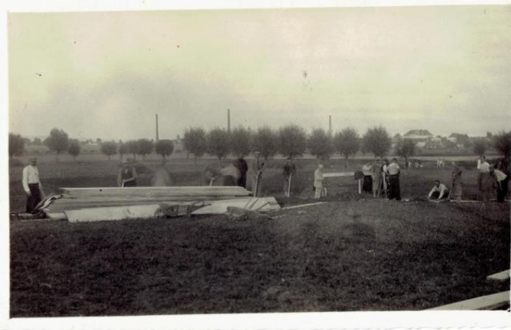
Ilustracja 7-Prace przy budowie fundamentów pod Dom Legionowo-Strzelecki w Jedliczu, 1935

W okresie okupacji w budynku przez pewien czas stacjonowało wojsko niemieckie oraz miała swoją siedzibę Szkoła Powszechna w Jedliczu. Po II wojnie światowej budynek legionowo-strzelecki został przejęty na rzecz Skarbu Państwa. Służył jako obiekt użyteczności publicznej, w którym mieściły się m.in. Prezydium Miejskiej Rady Narodowej, Urząd Miasta i Gminy, Miejsko-Gminny Ośrodek Sportu i Rekreacji, miejscowy ośrodek kultury. Obecnie