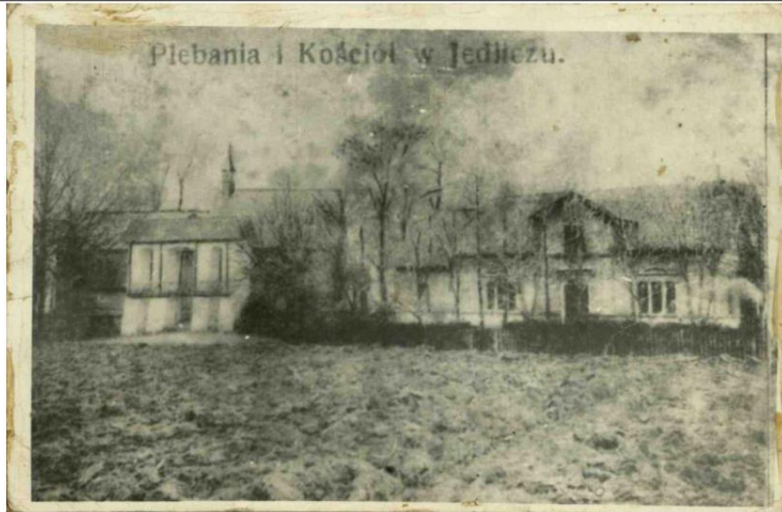
Ilustracja 3 - Plebania i kościół w Jedliczu. Pocztówka z pocz. XX w.