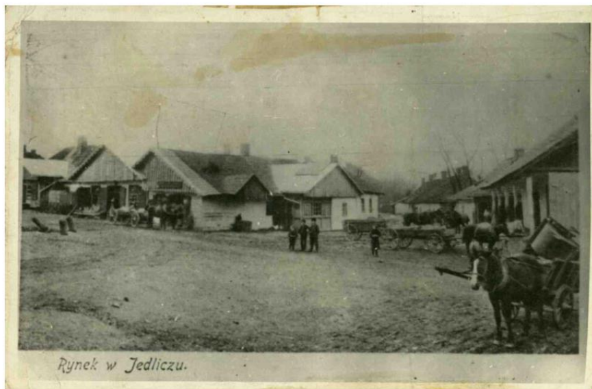
Ilustracja 2 - Rynek w Jedliczu. Poczтівka z pocz. XX w.