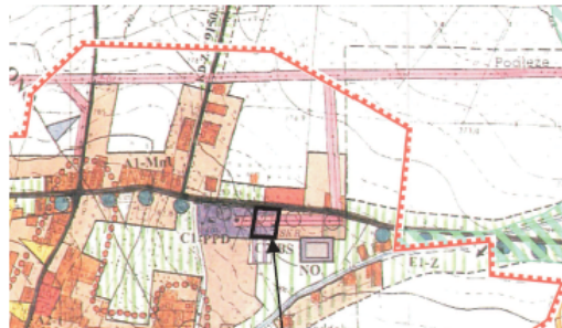
OBSZAR OBJĘTY MPZP "SAMOKŁĘSKI III"

WYRYS ZE STUDIUM UWARUNKOWAŃ I KIERUNKÓW ZAGOSPODAROWANIA PRZESTRZENNEGO GMINY OSIEK JASIELSKI