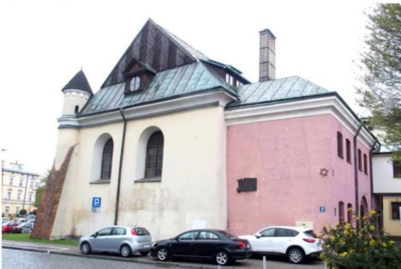
Zdjęcie nr 12. Synagoga Staromiejska

Synagoga Staromiejska, zwana Małą, (Stara Szkoła), ul. Bożnicza 4