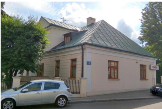
Zdjęcie nr 17. Dworek Skrzyńskich

Dworek Skrzyńskich (1 ćw. XIX w., 1928 - 1930) zachował swoją historyczną bryłę. Jest to rozłożysty parterowy budynek, kryty wysokim czterospadowym dachem z facjatą w elewacji półd. Dworek ozdobiony skromnym wystrojem architektonicznym - pasowa dekoracja ścian, nad otworami okiennymi półkoliste płyciny z dekoracją palmetową, tokańska kolumna przy wejściu. W zespole dworku jest także oficyna (1 ćw. XIX w.) położona na zach. od głównego budynku.