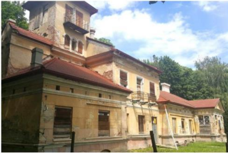
Zdjęcie nr 23. Dwór w zespole dworsko - parkowo - folwarczny w Słocinie

Zespół dworsko - parkowo - folwarczny w Rzeszów - Słocinie - jeden z najlepiej zachowanych. Zachował się tu dwór oraz otaczający go park, a także dość duży zespół zabudowy towarzyszącej: domek ogrodnika, rządówka, zabudowania gospodarcze. Ponadto kapliczka św. Floriana, z poł. XIX w., osobno wpisana do rejestru zabytków.