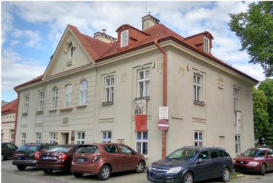
Zdjęcie nr 16. Dworek Piątkowskiego