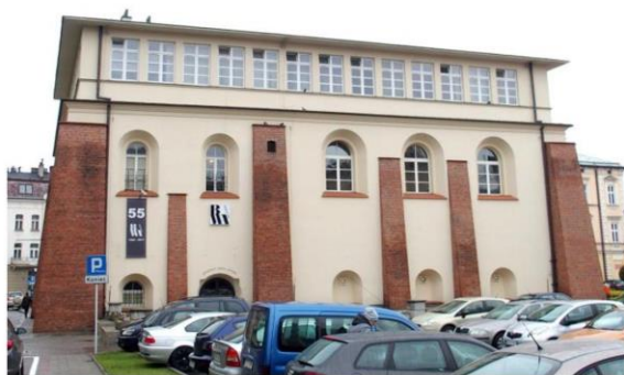
Zdjęcie nr 13. Synagoga Nowomiejska

Synagoga Nowomiejska zw. Dużą (Nowa Szkoła) wzniesiona w l. 1705 - 1712, wg proj. arch. Jana Chrzyciela Bellottiego. Budowa zrealizowana została ze środków gminy żydowskiej, która uzyskała pożyczkę, m.in. od rzeszowskich bernardynów i pijarów. Po pożarze w 1842 r. została odbudowana: m.in. zmiana dachu z brogowego na dwuspadowy, kryty blachą. W 1902 r. przeprowadzono prace konserwatorskie pod kierunkiem Zygmunta Hendla. W czasie okupacji wykorzystywana na magazyny wojskowe, w 1944 r. została podpalona. Odbudowana w l. 1954 - 1965 wg proj. arch. Gerarda Pająka z przeznaczeniem na Biuro Wystaw Artystycznych ze zmianą formy architektonicznej (zmiana dachu, zrezygnowano z odbudowy babinica, nadbudowano dodatkowe piętro zwieńczone od zewnątrz wydatnym gzymsem, wewnątrz sali głównej podzielono stropem na 2 poziomy).