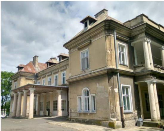
Zdjęcie nr 21. Pałac Jędrzejowiczów