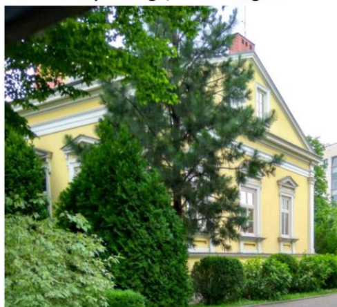
Zdjęcie nr 19. Dworek Karpińskiego