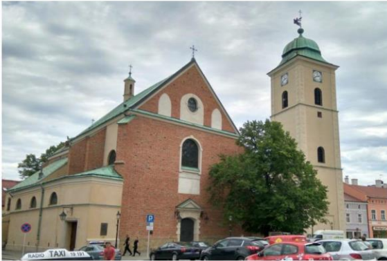
Zdjęcie nr 1. Kościół parafialny pw. św. Stanisława i św. Wojciecha