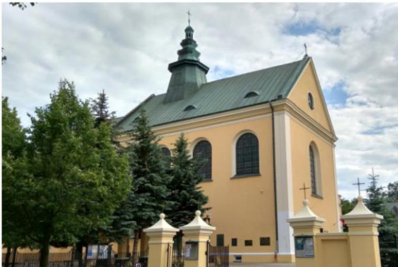
Zdjęcie nr 4. Kościół oo. Reformatów pw. Narodzenia Panny Marii