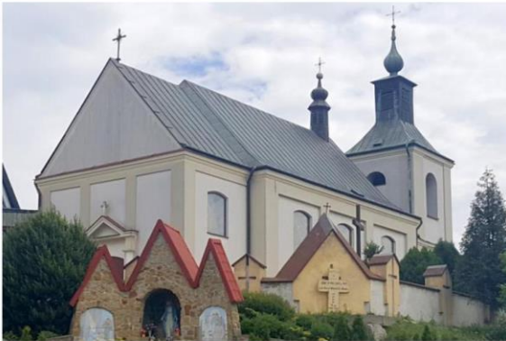
Zdjęcie nr 10. Kościół pw. Św. Mikołaja w Przybyszówce