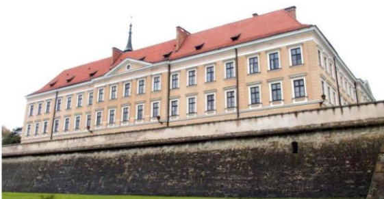
Zdjęcie nr 14. Zamek Lubomirskich, ob. Gmach Sądu Okręgowego

Zamek - w szeregu inwestycji podjętych przez Spytka Ligęzę było umocnienie miasta i budowa zamku. Ta ostatnia rozpoczęła się w k. XVI w. na płd. od miasta adaptując istniejący w tym miejscu korzystny układ wodny. Już w 1620 r. Mikołaj podjął przebudowę zamku w typie palazzo in fortezza. Powstały umocnienia ziemne, wały, bastiony w obowiązu