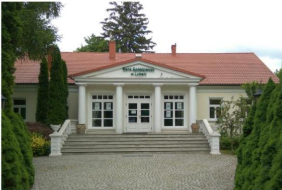
Zdjęcie nr 20. Dworek Liwów

Dworek Liwów (ok. 1918 r.) - nieduży, parterowy budynek, o skromnym wystroju, z pseudoportykiem zwieńczonym trójkątnym frontonem.