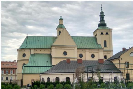
Zdjęcia nr 2. Klasztor i kościół oo. Bernardynów pw. Wniebowzięcia NMP

Klasztor i kościół oo. Bernardynów pw. Wniebowzięcia NMP wzniesiony został z fundacji Mikołaja Spytka Ligęzy w latach 1624 - 1629 na miejscu wcześniejszej drewnianej świątyni. Autorem projektu mógł być budowniczy z południowo - niemieckich warsztatów