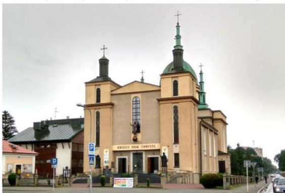
Zdjęcie nr 6. Kościół paraf. pw. Chrystusa Króla