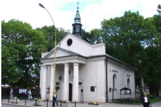
Zdjęcie nr 5. Kościół pw. św. Trójcy

Kościół pw. św. Trójcy wzniesiony przed 1745 r. z fundacji księcia Jerzego Ignacego Lubomirskiego, jako kościół szpitalny. Powstał nieopodal, funkcjonującego od XV w., kościoła szpitalnego. W tym czasie odbudowano też szpital ubogich. Na planie K.H. Wiedemanna z 1762 r. jest on przedstawiony jako prosta budowla z przedsionkiem nakryta czterospadowym dachem z wieżyczką na sygnaturkę. Po kilku latach kościół św. Trójcy spłonął w 1763 r. lub w 1779 r. i w latach 1787 - 1792 został odbudowany za Franciszka Lubomirskiego, zapewne na fundamentach poprzedniego kościoła i być może z wykorzystaniem części jego murów. Powstał już, jako kaplica cmentarna pw. Św. Trójcy, w związku z przeniesieniem cmentarza parafialnego spod kościoła farnego. Wiązało się to z zakazem pochówków na cmentarzach przykościelnych w obrębie miast. Na terenie byłego ogrodu szpitalnego wyznaczono obszar cmentarza. Nowa kaplica - klasycystyczna - była wielokrotnie. W 80. latach XX w. obiekt przejęła parafia farna w Rzeszowie. Wkrótce nastąpiła jego rozbudowa poprzez dobudowę zakrystii.