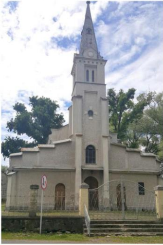
Zdjęcie nr 9. Kościół pw. Matki Bożej Śnieżnej

Kościół pw. Matki Bożej Śnieżnej w Rzeszów - Budziwoju, wybudowany w latach 1905 - 1907 wg projektu Adolfa Sumpera z Rzeszowa, rozbudowany w 1961 r. - dobudowanie naw bocznych. Budynek murowany, trójnawowy, z trójkondygnacyjną wieżą oraz prosto zamkniętym prezbiterium z przylegającymi po bokach zakrystią i składzikiem. Do skromnych elementów zewnętrznego wystroju architektonicznego kościoła należą m.in. gzyms wieńczący elewację z fryzem kostkowym, fryz arkadkowy dekorujący zwieńczenie wieży. W nawie głównej sklepienie krzyżowe, w nawach bocznych płaskie stropy.