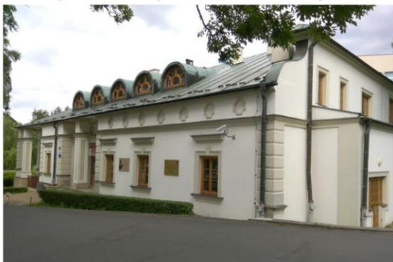
Zdjęcie nr 24. Dwór w Zalesiu

Dwór i pozostałości parku w Rzeszów - Zalesiu - budynek wzniesiony w 4 ćw. XIX w. dla rodziny Gumińskich, właścicieli Zalesia w okresie ok. poł. XIX w. - 1944 r. Dwór założony na planie podkowy, parterowy z piętrowym skrzydłem pfd. Elewacja frontowa wsch. poprzedzona jest głębokim podcieniem wspartym na dwóch filarach. Elewacje ozdobione detalem w postaci m.in. boniowania, opasek okiennych, gzymsów.