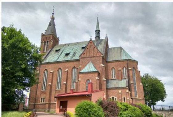
Zdjęcie nr 7. Kościół pw. św. Józefa Oblubieńca

Kościół pw. św. Józefa Oblubieńca usytuowany w Rzeszów - Staromieście - neogotycki, wybudowany w 1900 r. wg projektu Zygmunta Hendla, z inicjatywy proboszcza ks. Józefa Stafieja. Budowniczym kościoła był Karol Nikodemowicz. Konsekrowany został w 1932 r. Powstał na miejscu kilku istniejących tu wcześniej świątyń.