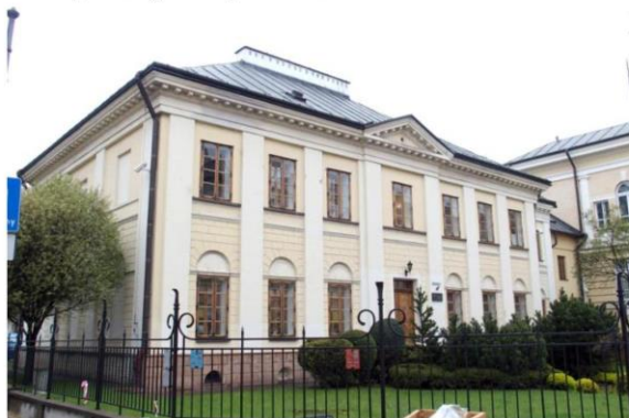
Zdjęcie nr 18. Pałac Burgallera

Pałac Burgallera (l. 1818 - 1823, 1910 r.) to klasycystyczny budynek, wybudowany najprawdopodobniej przez budowniczego Burgallera, swoim usytuowaniem przeciął oś planistyczną zamek - fara. Jest to obiekt piętrowy o wyważonych proporcjach, kryty wysokim czterospadowym dachem. Jego elewacje zostały podzielone lizenami w wielkim porządku, parter ozdobiony boniowaniem, a półkoliste płyciny nad oknami parteru pokryte zostały ornamentem palmetowym. Całość zwieńczona jest pełnym belkowaniem. Na osi elewacji frontowej pseudoryzalit z wejściem, zwieńczony niewielkim tympanonem.