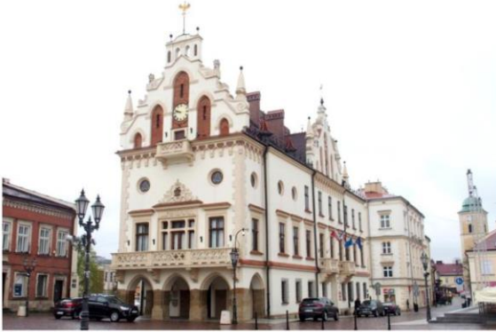
Zdjęcie nr 25. Ratusz