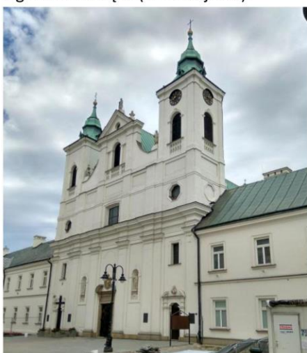
Zdjęcie nr 3. Kościół klasztorny pw. Św. Krzyża

Zespół kościelno - klasztorny oo. Pijarów: kościół pw. Św. Krzyża (ul. 3 Maja 17), klasztor oo. Pijarów - ob. Muzeum Okręgowe (ul. 3 Maja 19), Kolegium Pijarskie, ob. I Liceum Ogólnokształcące (ul. 3 Maja 15).