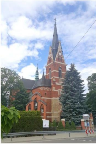
Zdjęcie nr 8. Kościół pw. św. Marcina i św. Rocha

Kościół pw. św. Marcina i św. Rocha w Rzeszowie - Słocinie to kościół neogotycki wg proj. lwowskiego architekta Tadeusza Obmińskiego. Budowę realizowano w latach 1913 - 1916 pod kierunkiem rzeszowskiego architekta Mateusza Tadeusza Tekielskiego. Cmentarz przykościelny otoczony metalowym ogrodzeniem na ceglany cokole i ceglanych słupkach. W sąsiedztwie kościoła znajduje murowana z cegły dzwonnica, kaplica grobowa Szymanowskich i Chłapowskich z 1880 r. Na cmentarzu przykościelnym zachowany klasycystyczny nagrobek z rzeźbą mężczyzny, żeliwne krzyże, pochówki z pocz. XX w., m.in. proboszcza ks. R. Malinowskiego zm. 1916 r. - nagrobek z bogatą metaloplastyką krzyża i ogrodzenia. W sąsiedztwie kościoła znajduje się zespół zabudowań plebańskich: wikarówka z 1890 r., dom parafialny z 1938 r. i ochronka z 1896 r.