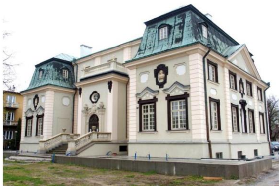
Zdjęcie nr 15. Pałac Letni Lubomirskich