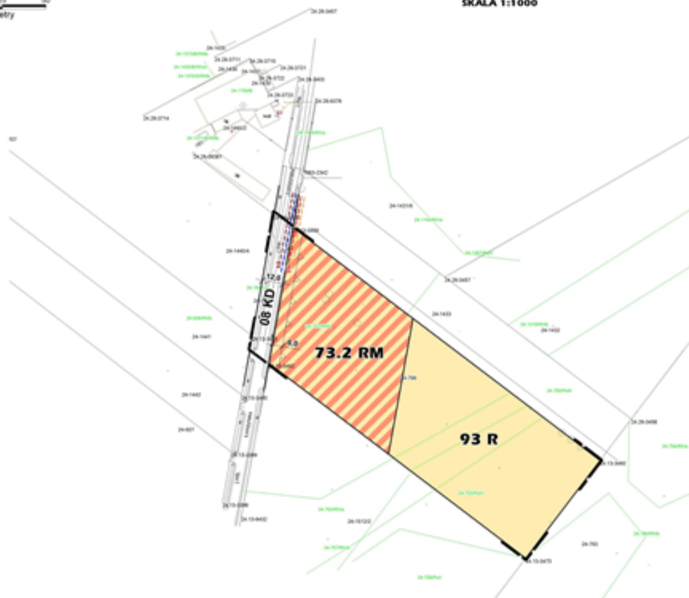
WYKRES ZE STUDIUM UWARUNKOWAŃ I KIERUNKÓW ZAGOSPODAROWANIA PRZESTRZENNEGO GMINY RADZIŁÓW