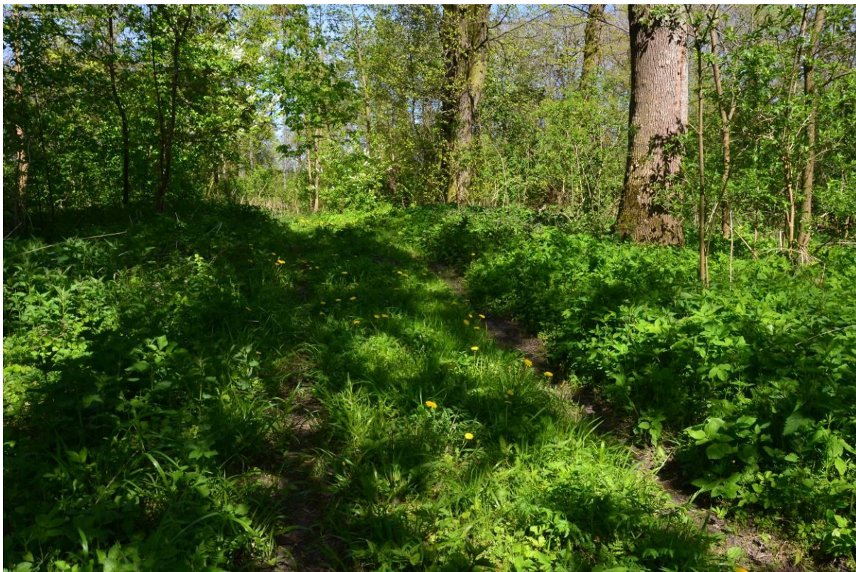
7. Dwór obronny - grodzisko w Osieczu Wielkim