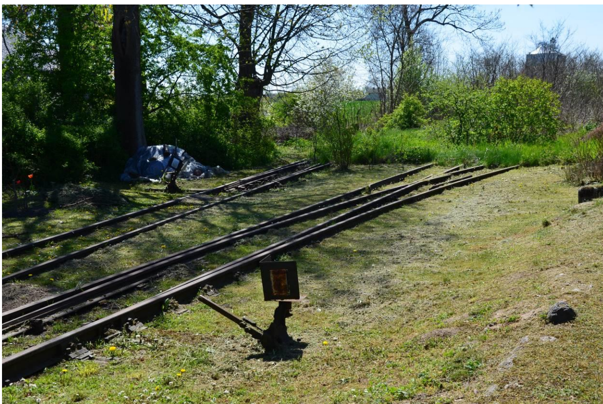
4. Linia kolejki wąskotorowej w Boniewie