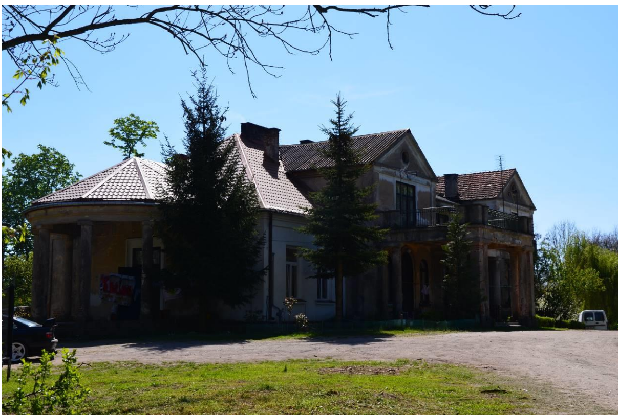
8. Zespół dworsko-parkowy w Otmianowie - dwór