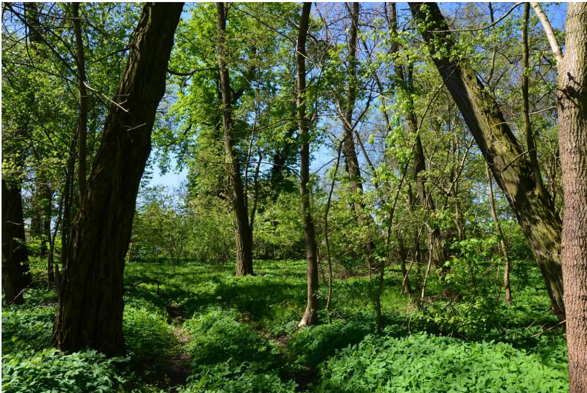
2. Zespół dworsko-parkowy w Boniewie - park