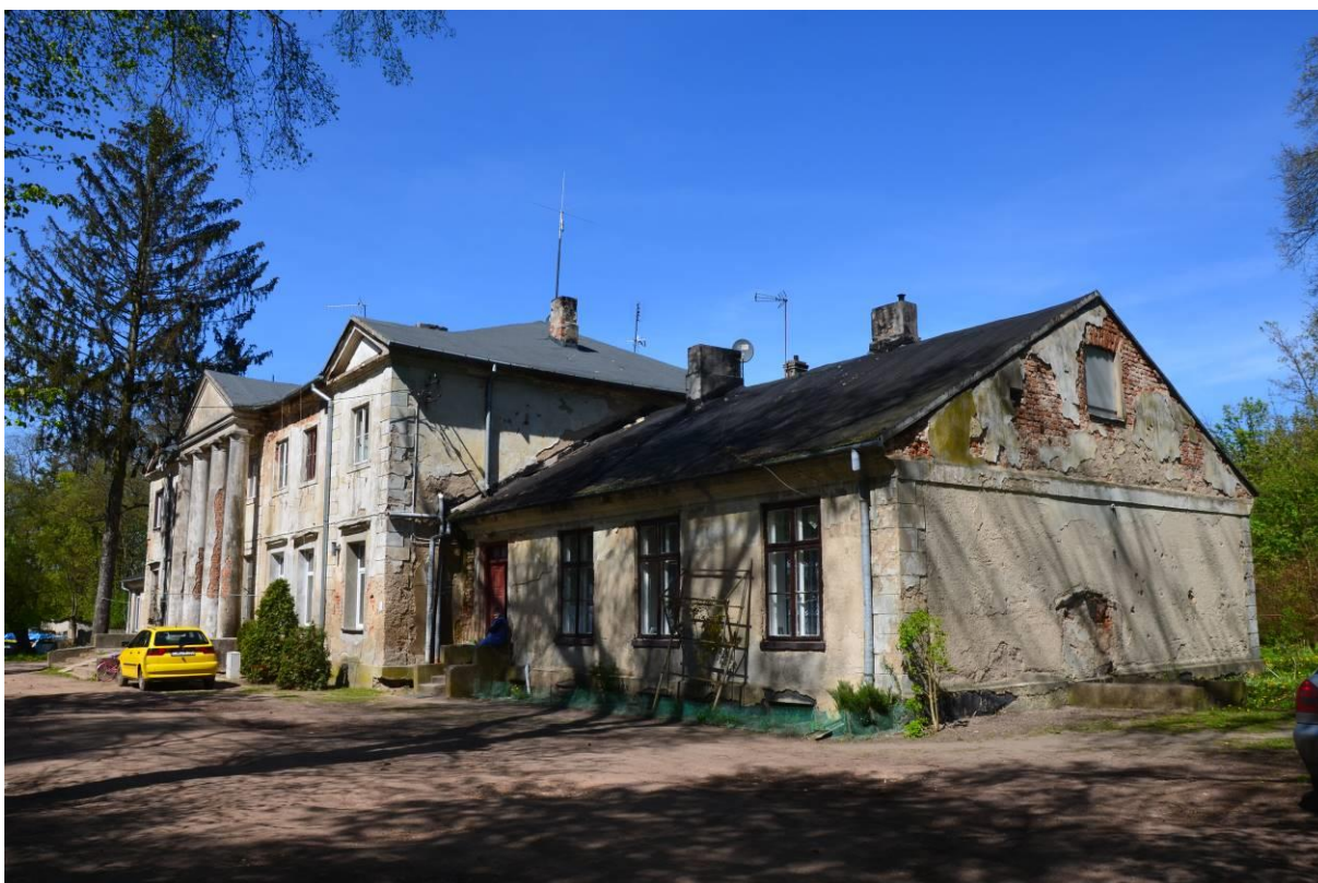
10. Zespół dworsko-parkowy w Osieczu Wielkim - pałac