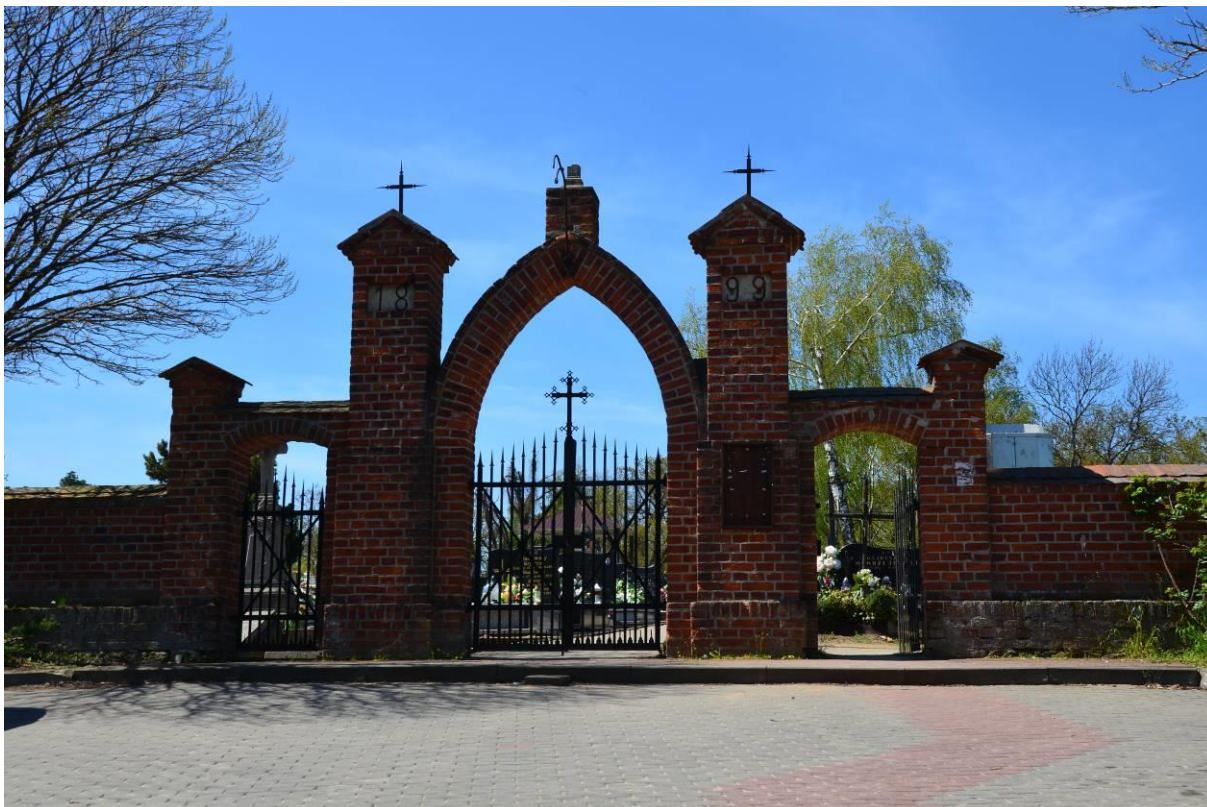
3. Cmentarz komunalny rzymskokatolicki w Boniewie