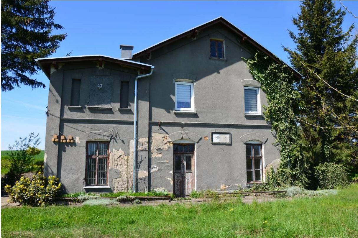
5. Dworzec kolejki wąskotorowej w Boniewie