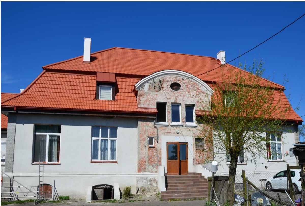
6. Zespół dworsko-parkowy w Kaniewie - dwór