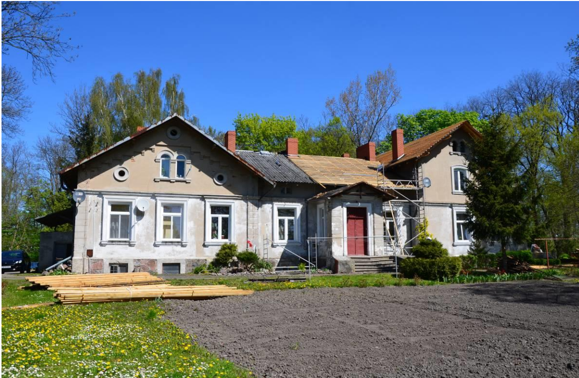
1. Zespół dworsko-parkowy w Boniewie - dwór