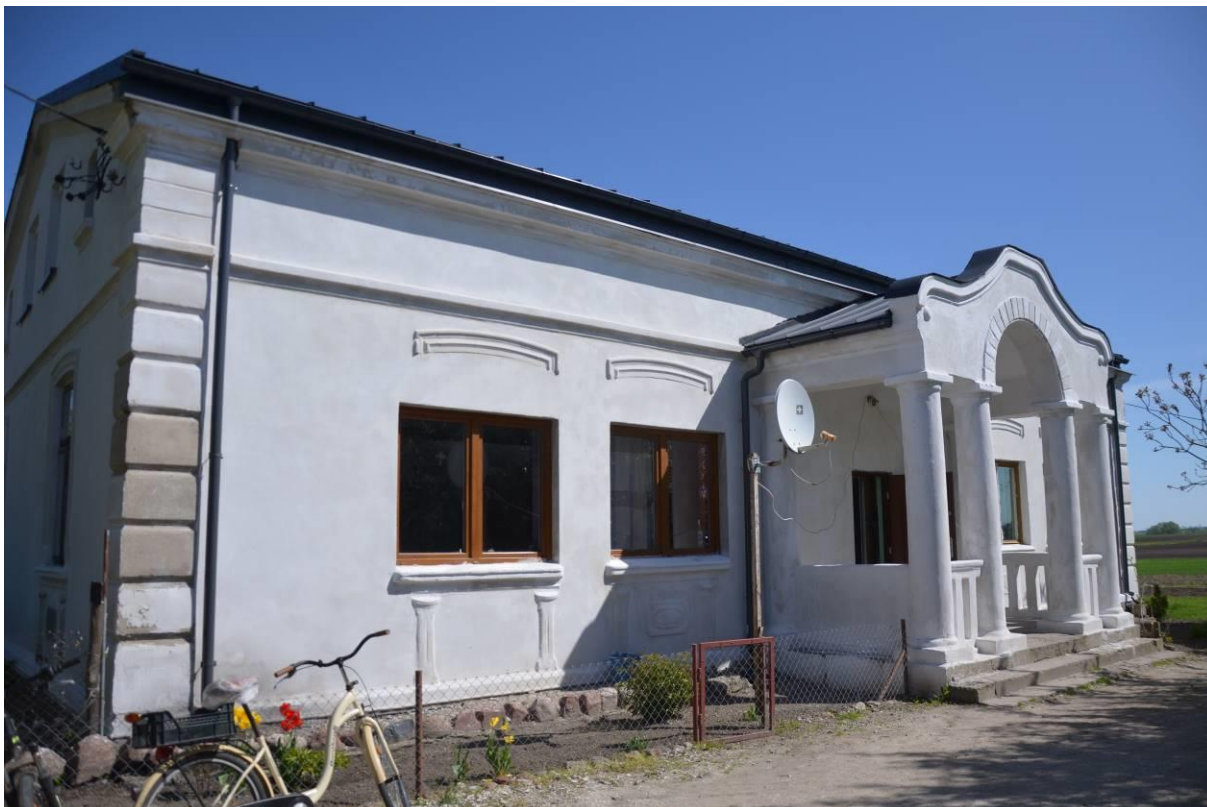
9. Zespół dworsko-parkowy w Mikołajkach - dwór