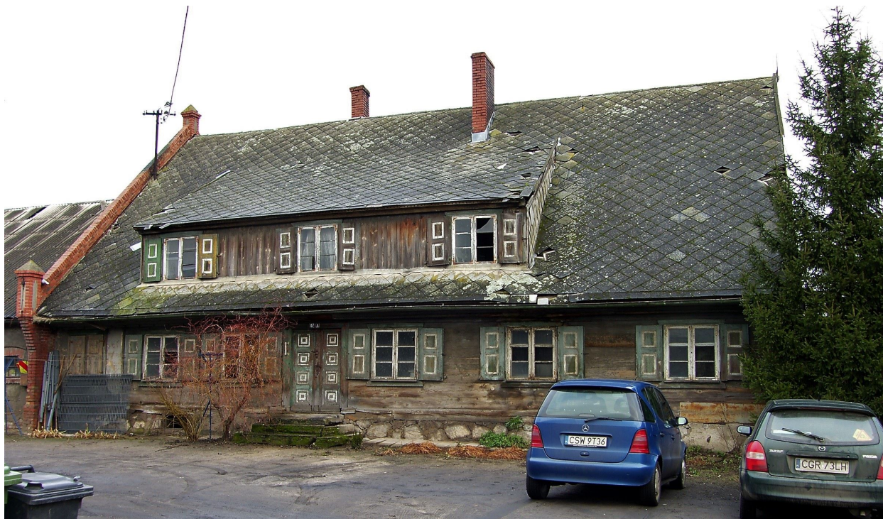
OBIEKTY WPISANE DO EWIDENCJI ZABYTEKÓW - CHATY