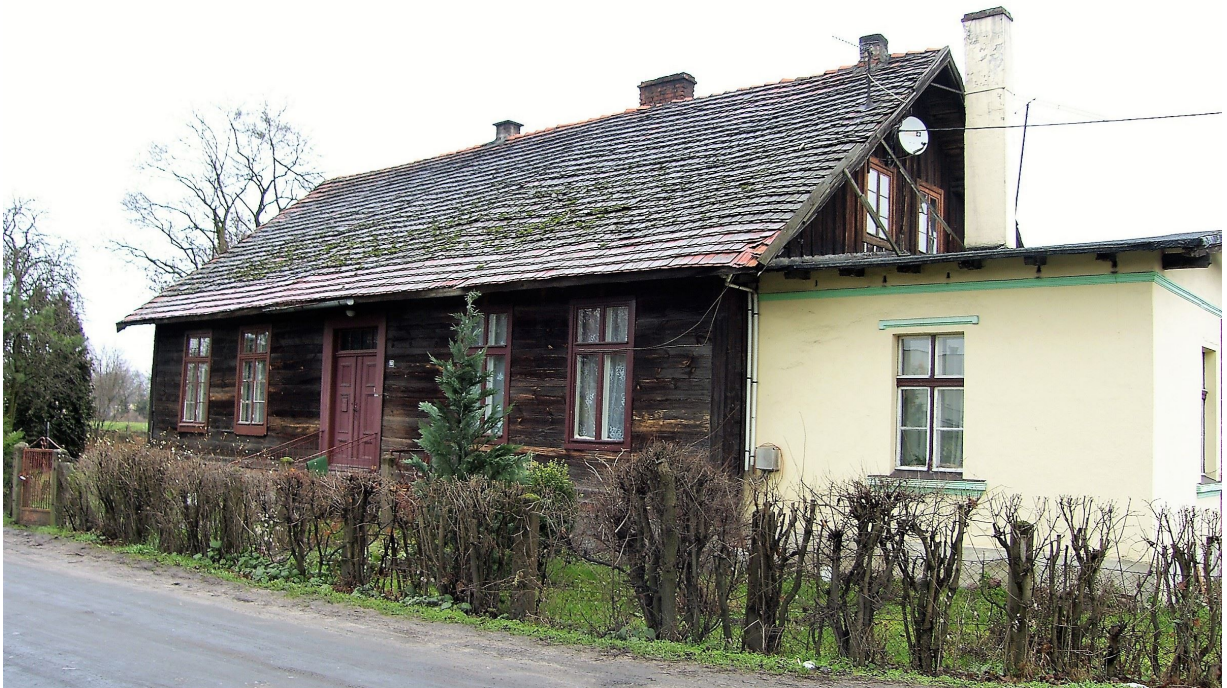
Dragacz 57, chata, 2 poł. XIX w,