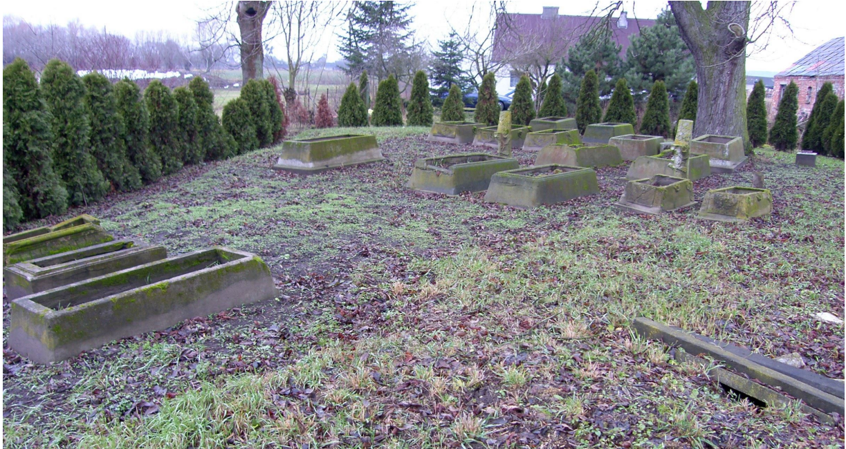
Wielkie Stwolno, cmentarz ewangelicki, poł. XIX w.