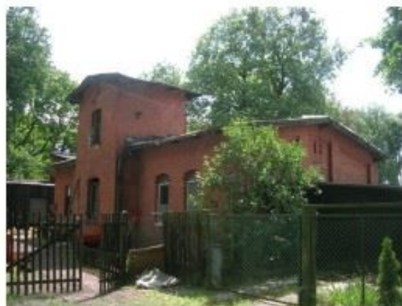
obok nr 10