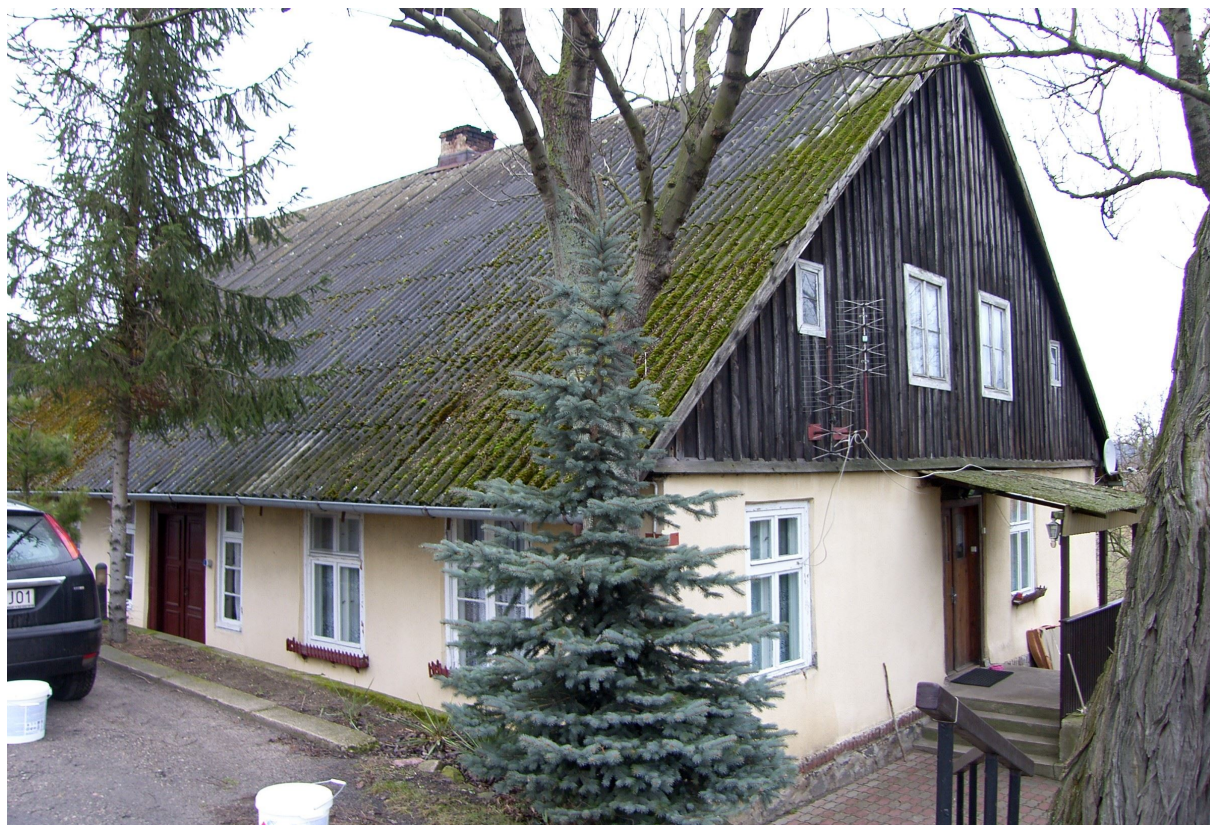
Michale nr 127, zespół „Białej Karczmy”, 1898 r.