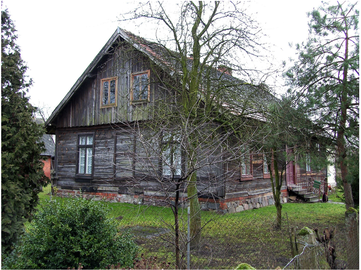
Dragacz 58, chata, 2 poł. XIX w.