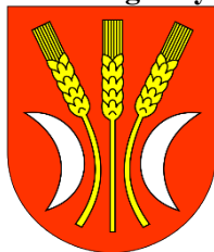
Rysunek . Herb gminy Rojewo