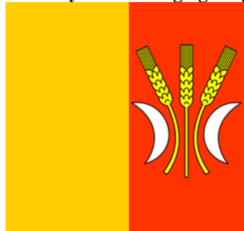
Rysunek . Flaga gminy Rojewo