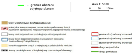
Wyrys ze Studium uwarunkowań i kierunków zagospodarowania przestrzennego gminy Jeżewo uchwalonego uchwałą nr XIV/103/2012 Rady Gminy Jeżewo dnia 28 marca 2012 r.