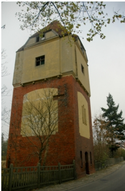
Wieża ciśnień – PKP Więcbork

Na terenie gminy Więcbork do GEZ wpisano kilkanaście założeń dworsko –parkowych. Najcenniejsze z nich zlokalizowane są w Runowie Krajeńskim, Suchorączku oraz Sypniewie i zostały wpisane do rejestru zabytków. Poza tym w wielu miejscowościach wiejskich znajdują się mniej wartościowe układy. Niestety stan zachowania części założeń jest bardzo zły. Cennym przykładem założenia cmentarnego jest nekropolia parafialna w Więcborku (w jej skład wchodzi m.in. kaplica cmentarna). Do GEZ wpisano również odcinki linii kolejowych nr 240 i 281 wraz ze stacjami kolejowymi i infrastrukturą towarzyszącą.