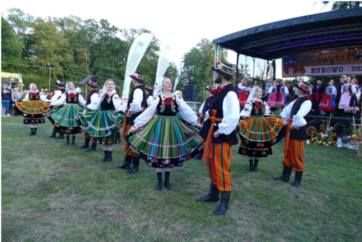
Dożynki Gminne – Runowo Kr. 2022r.