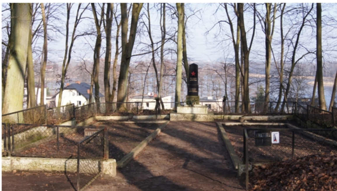
Cmentarz żołnierzy sowieckich poległych w 1945r.