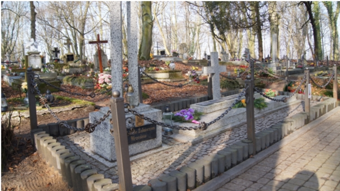
Mogiła żołnierzy polskich poległych we wrześniu 1939 r.

wojenne w Więcborku, przykładami są mogiła żołnierzy polskich z 1939r. oraz cmentarz żołnierzy radzieckich poległych w 1945r. Jest tu też kilka miejsc pamięci, przede wszystkim upamiętniających poległych w trakcie II wojny światowej, największym i najbardziej tragicznym w swojej wymowie jest cmentarz poległych w 1939r. w Karolewie.