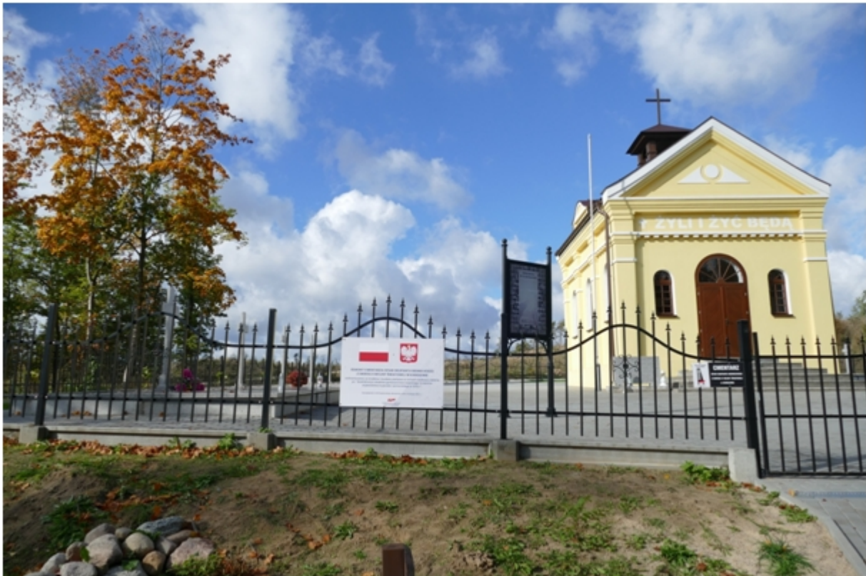
Cmentarz cywilnych ofiar w Karolewie zamordowanych przez Niemców w 1939r.