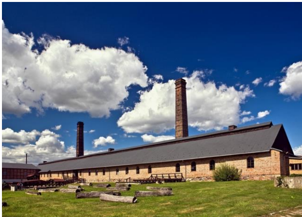
zespół zabytkowych spichlerzy wraz z panoramą od strony Wisły w Grudziądzu,