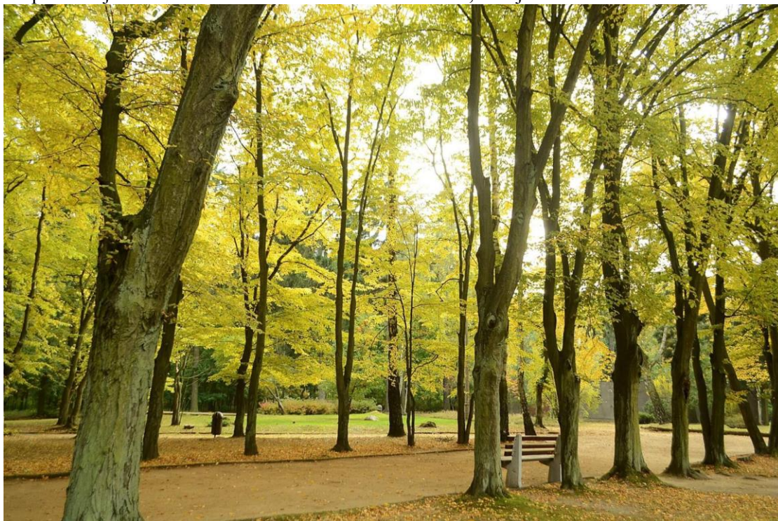
- cmentarz ewangelicki z I poł. XIXw., nr rejestru A/714 z dnia 20.12.1995