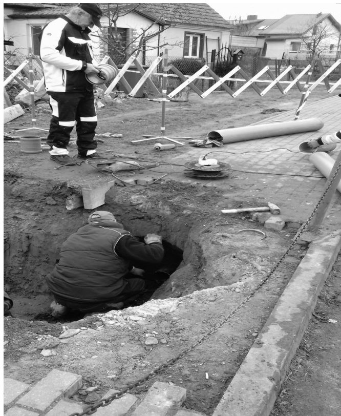
Usuwanie awarii we wsi Radomin