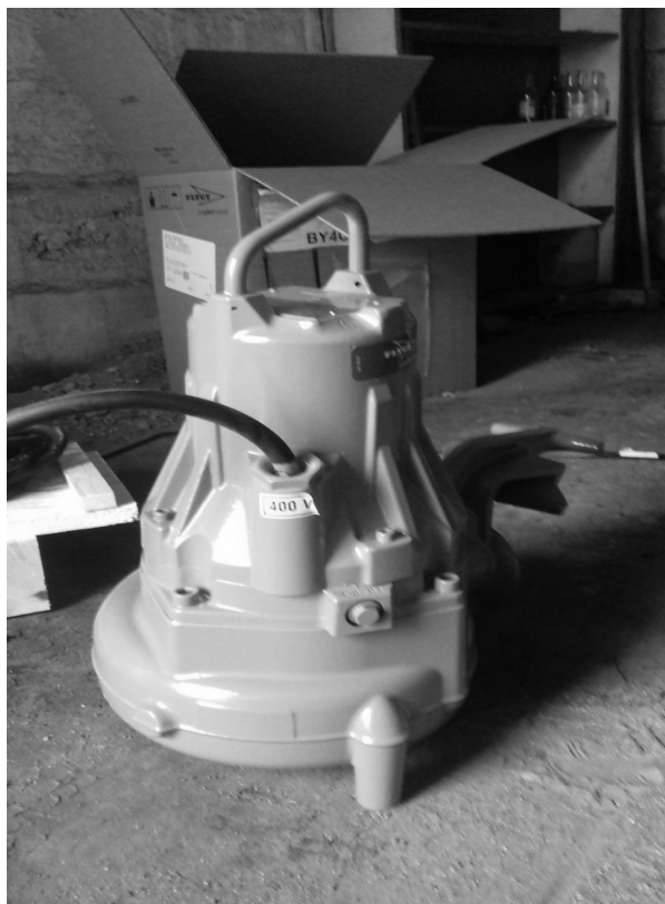
Odbiór nowej pompy kanalizacyjnej

Zakład w 2020 r. otrzymał również dotację celową w wysokości 22 000,00 zł. Dotacja ta została przeznaczona na zakup 2 pomp: Fligt NP3102.160MT/460 (silnik el. 3,1 kW) oraz Fligt NP3085.160MT/460 (silnik el. 2 kW) do przepompowni ścieków PS 1 i PS 2 w Radominie.