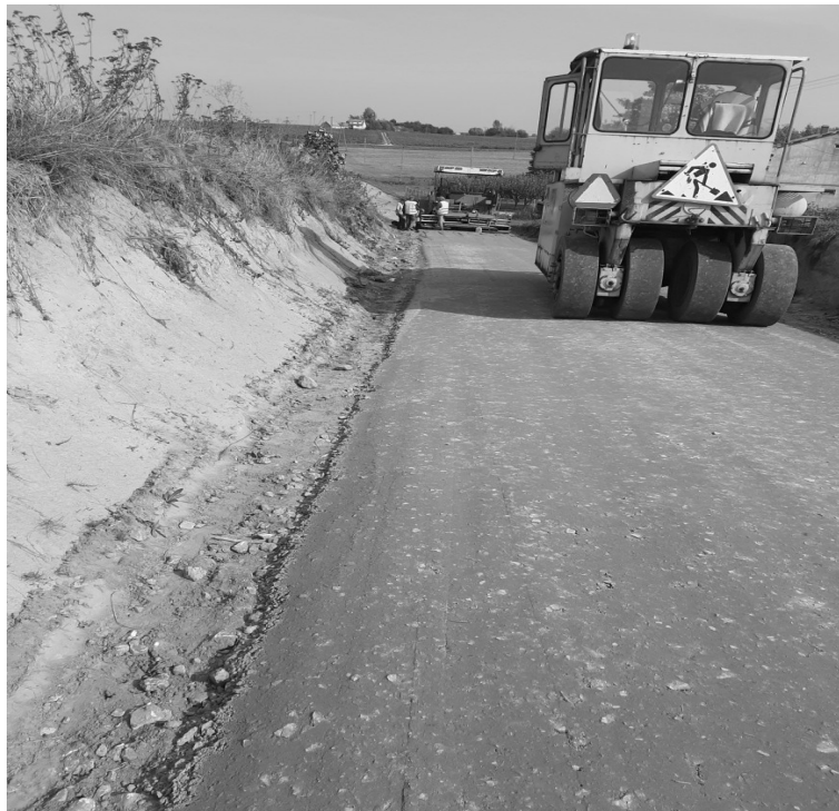
Budowa nawierzchni drogi Radomin-Gaj