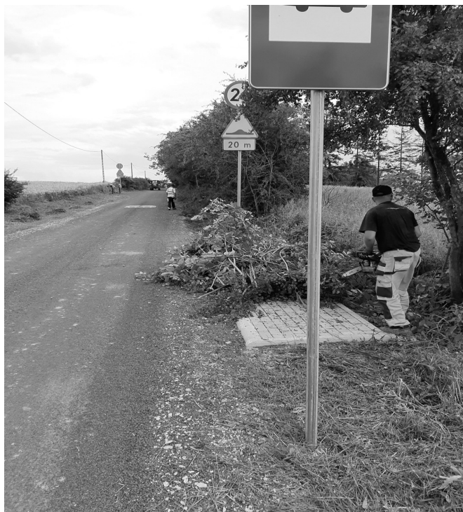
Porządkowanie poboczy drogi w Rętwinach

Natomiast dotacja na utrzymanie boisk sportowych została wykorzystana w 2020 r. w całości tj. w kwocie 10 000,00 zł.