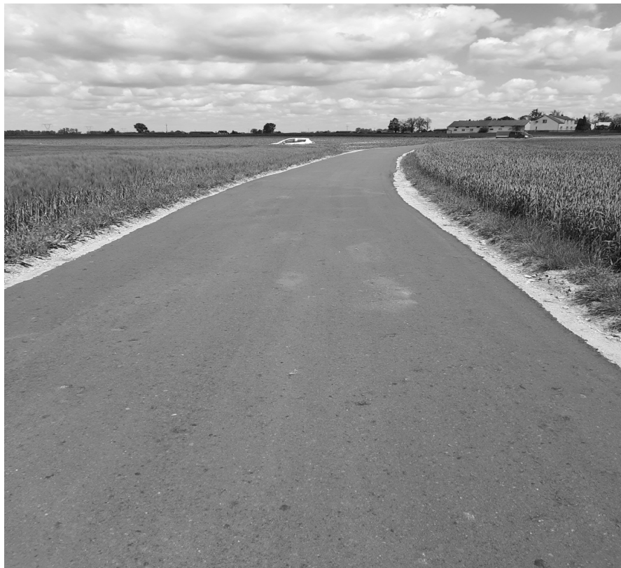
Ułożenie warstwy destruktu na drodze we Wilczewku