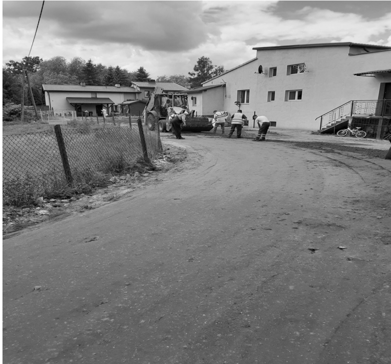
Droga w Szafarni