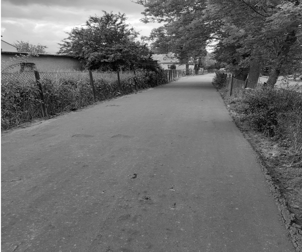
Ułożenie warstwy destruktu na drodze w Szafarni

Zakład wykonał również nawierzchnie dróg gminnych z destruktu w miejscowościach: Szafarnia (ok. 175 m), Wilczewko (ok. 470 m), Piórkowo (240 m).