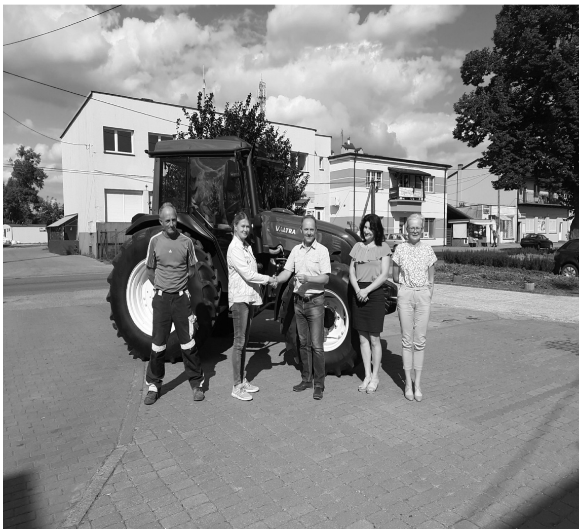
Przekazanie kluczy do ciągnika „Valtra” przez Wójta Gminy Radomin