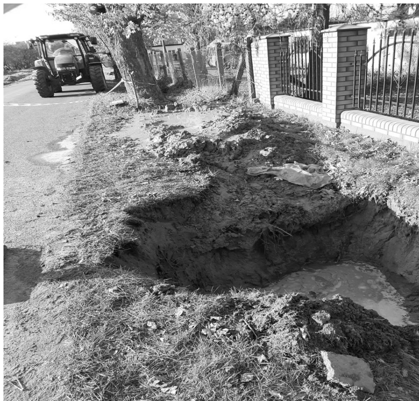
Usuwanie awarii wodociągowej w Radominie