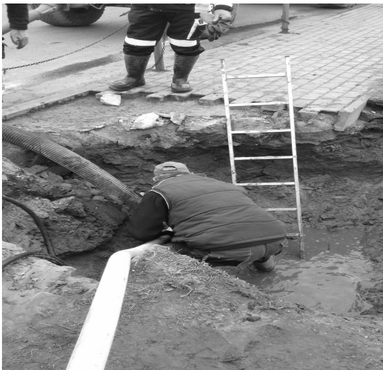
Usuwanie awarii wodociągowej w Radominie

W 2020 roku Zakładowi została przyznana przez Gminę Radominek dotacja przedmiotowa na utrzymanie zieleni gminnej w wysokości 75 000,00 zł oraz dotacja przedmiotowa na utrzymanie obiektów sportowych w wysokości 10 000,00 zł. Stawki dotacji na 2020 rok zostały ustalone w uchwale Nr XII/102/2019 z dnia 19.12.2019 r. w sprawie ustalenia stawki dotacji przedmiotowej dla Samorządowego Zakładu Budżetowego w Radominie. Zgodnie z tą uchwałą stawki dotacji przedmiotowej dla Samorządowego Zakładu Budżetowego za utrzymanie zieleni gminnej oraz boisk sportowych przedstawiają się następująco: