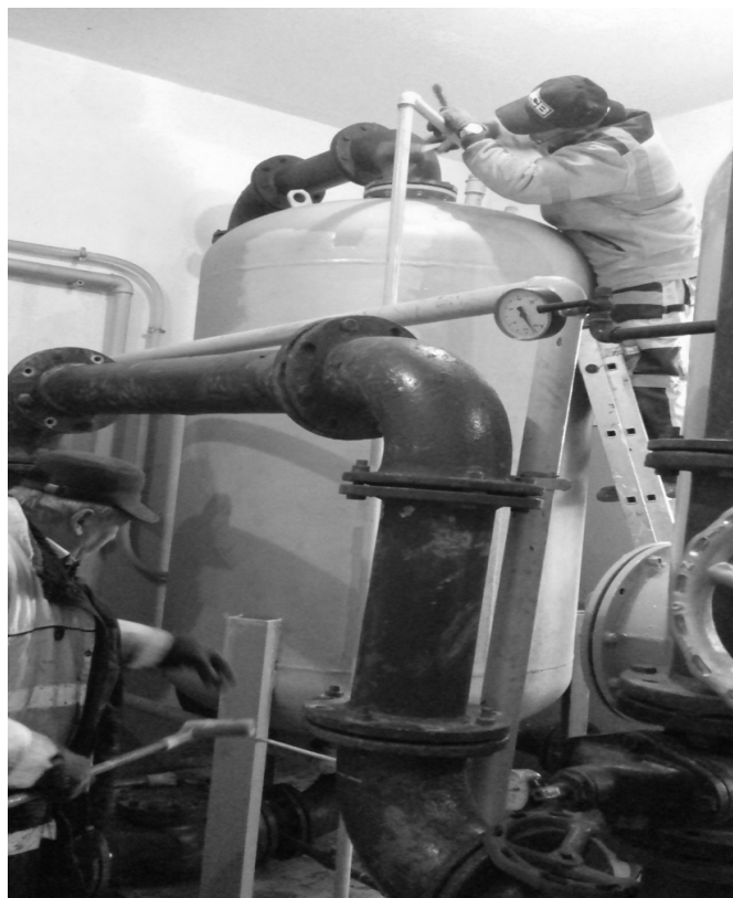
SUW Radomin - malowanie zbiorników i rur