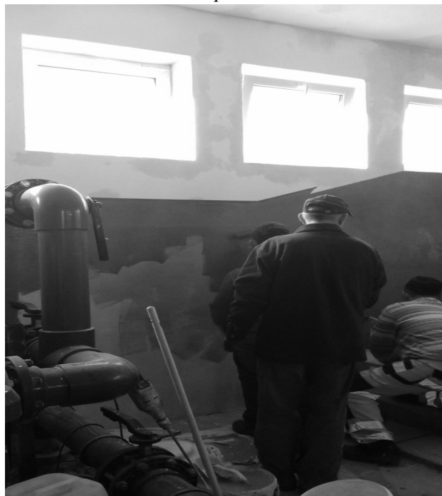
SUW Dulsk - prace malarskie