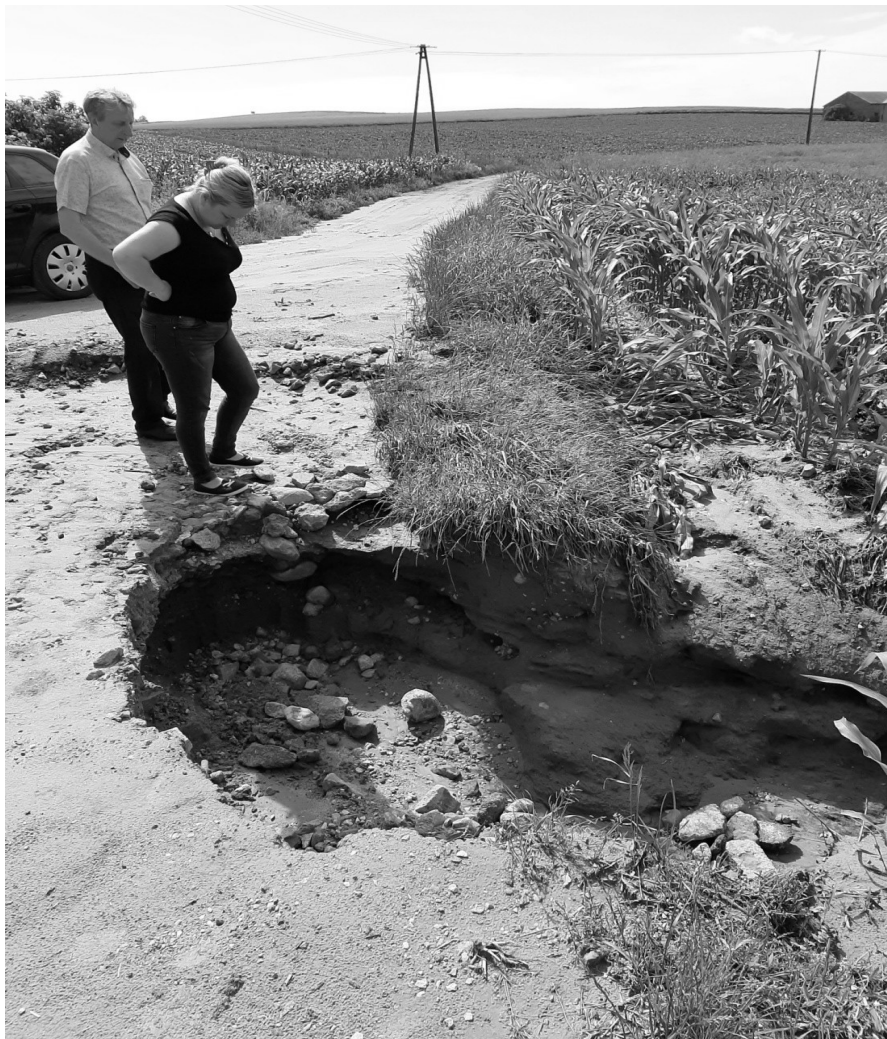
Usuwanie skutków ulewy na drodze Dulsk Frankowo