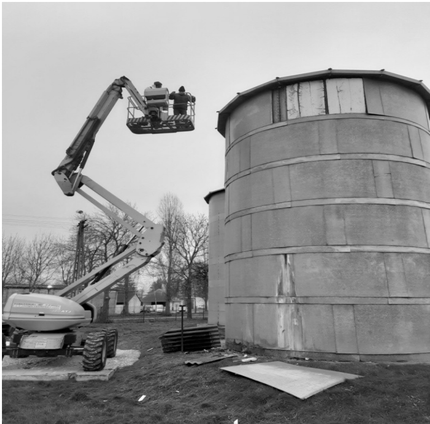
Naprawa rozszczelnienia zbiornika na SUW Radomin