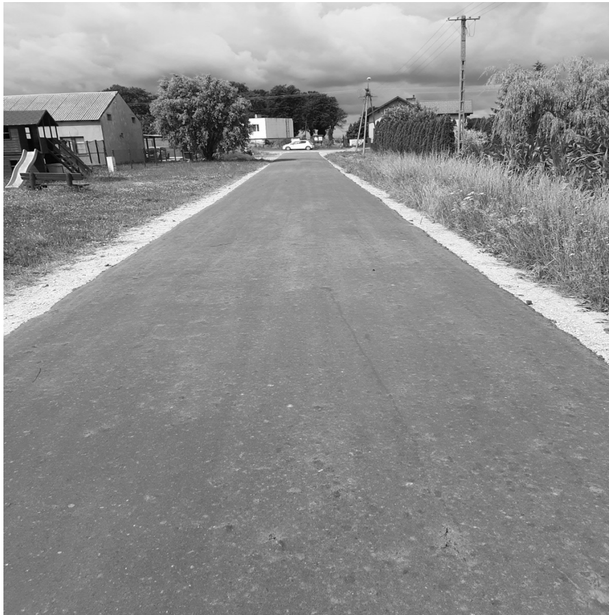
Wykonanie nawierzchni drogi z destruktu w Piórkowie