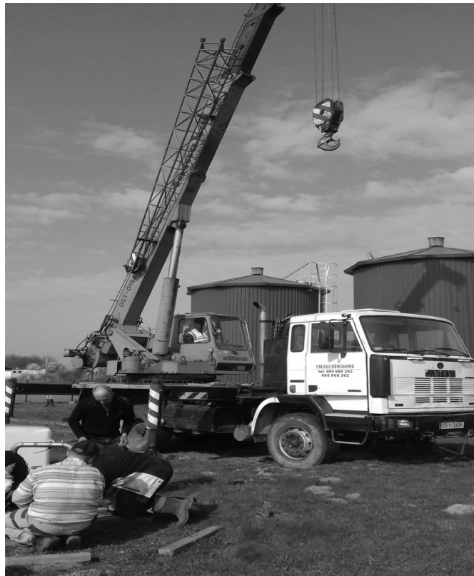
Czyszczenie pomp głębinowych na SUW Szczutowo