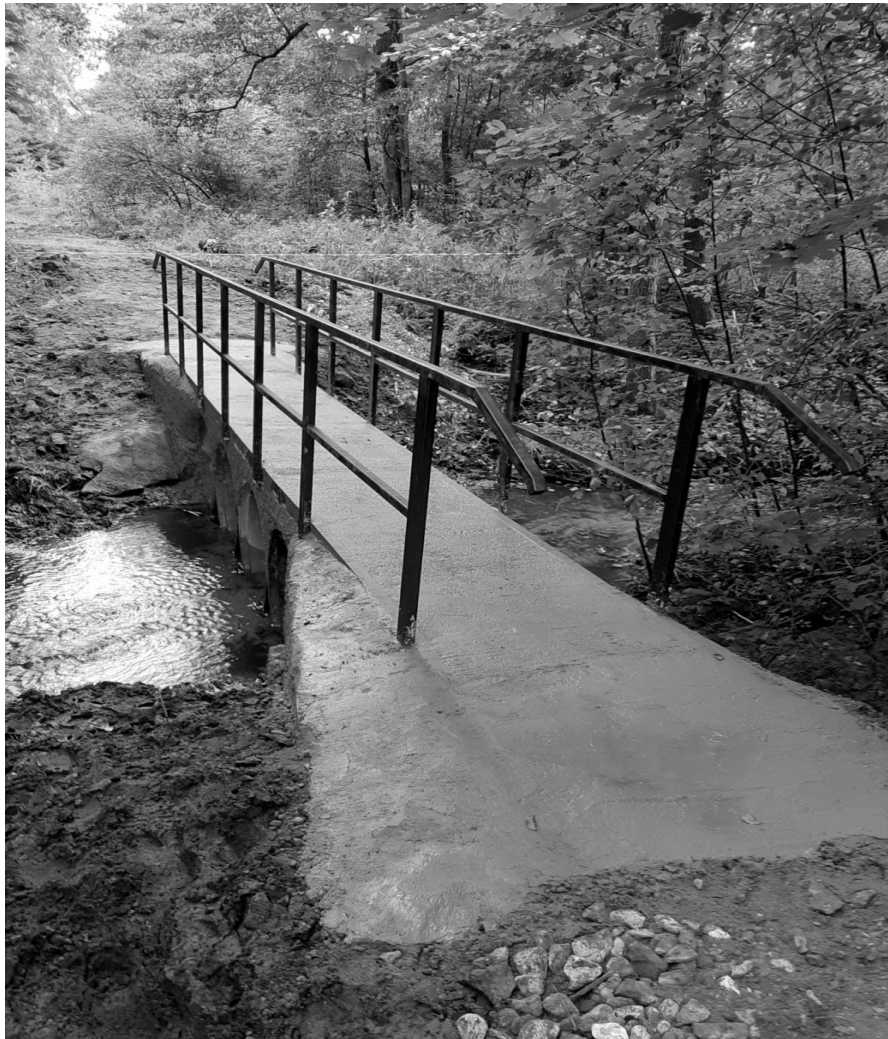
Budowa mostku w wsi Płonno