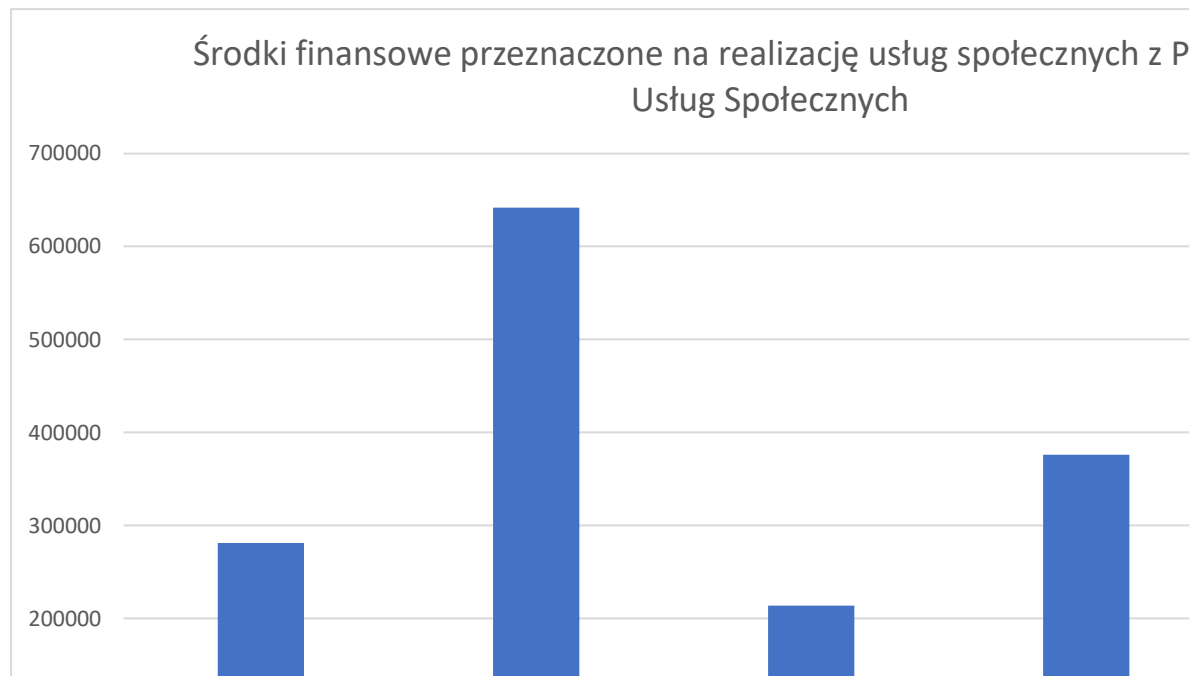
Wykres Nr 2. Środki finansowe przeznaczone na realizację Programów Usług Społecznych (w zł)