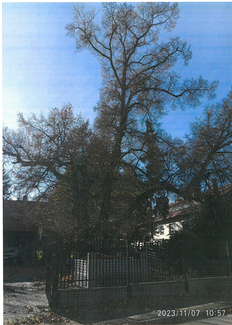
1.Lipa szerokolistna – Pierzchnica, dz. ewid. 2046/14