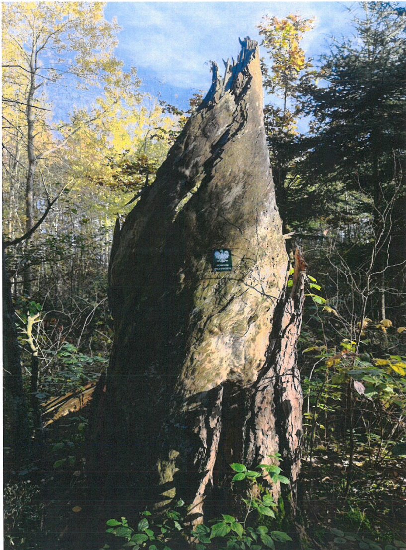
Zdj. Wykonane 6 listopada 2023 r.