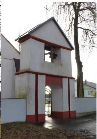
Ilustracja 1. Rączki – zespół zabytków w ich krajobrazowej relacji historycznej: dawny park, widok na bramę główną od wschodu, z drogi w stronę kościoła (1), fragment mapy archiwalnej (1931 r.) ujawniającej historyczne relacje przestrzenne i kompozycyjne przez nieistniejącą aleję dojazdową (2), zespół kościoła filialnego: kościół (3) i brama-dzwonnica (4).