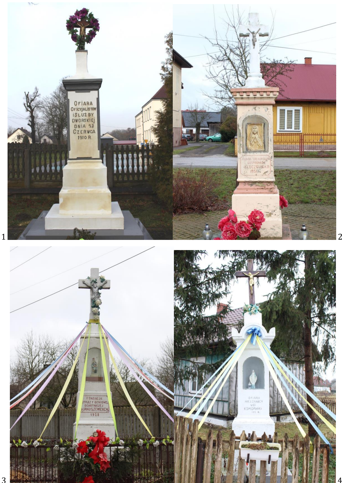
Ilustracja 4. Kapliczki przydrożne na terenie Gminy Kluczewsko, przykładowe: Dobromierz (1), Kluczewsko (2), Januszewice (3), Komorniki (4).