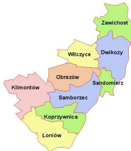
Rys. 1. Położenie gminy Samborzec.

Gmina Samborzec położona jest w południowo-wschodniej części Polski w woj. świętokrzyskim na pograniczu Wyżyny Kielecko-Sandomierskiej oraz Kotliny Sandomierskiej. Jest jedną z dziewięciu gmin powiatu sandomierskiego i stanowi 12,63 % powierzchni powiatu, a jej powierzchnia wynosi 8 537,00 ha. W skład Gminy wchodzi 28 sołectw, są to: Andruszkowice, Bogoria Skotnicka, Bystrojowice, Chobrzany, Faliszowice, Gorzyczany, Jachimowice, Janowice, Kobierniki, Koćmierzów, Krzeczkowice, Łojowice, Milczany, Ostrołęka, Polanów, Ryłowice, Samborzec, Skotniki, Strączków, Strohcice, Szewce, Śmiechowice, Wielogóra, Zajeziórze, Zawierzbie, Zawisełcze, Złota, Żuków.