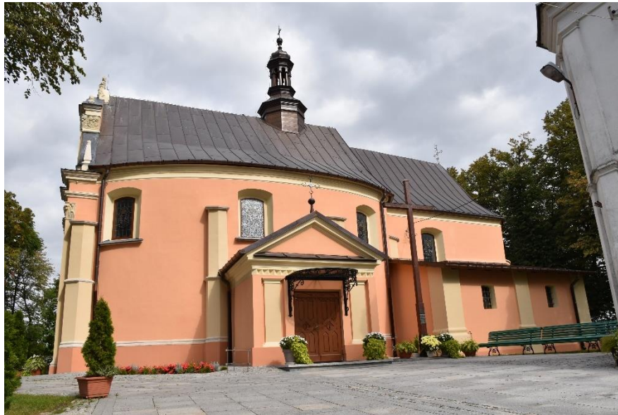
Rys. 3. Kościół Parafialny w Samborcu

Kościół Parafialny w Samborcu został prawdopodobnie wybudowany w połowie XIII w. przez Pawła z Samborca. W czasie wojen szwedzkich kościół został zniszczony. Od 1688 r. rozpoczęto odbudowę, która trwała do 1691 r. W tym czasie kościół został powiększony przez dobudowanie nawy i przekształcenie prezbiterium. W 1880 r. dobudowano zakrystię, kruchtę oraz wzniesiono dzwonnice. Plebania powstała w 1922 r. a w roku 1956 wybudowano przy niej kaplicę.