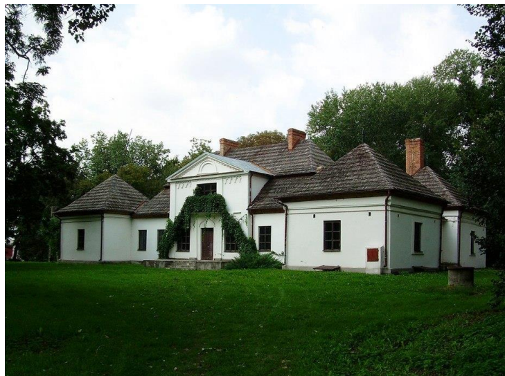
Rys. 5. Dworek w Skotnikach

Posiadłość co najmniej od pierwszej połowy XIV w. do 1945 r. w rękach Bogoriów Skotnickich. Dwór wraz z otaczającym go parkiem krajobrazowym z resztkami starodrzewiu położony wśród łąg doliny Wisły, na obszernym, niewysokim wzniesieniu, otoczonym pozostałościami fosi i wału, z resztkami parku. Zniszczony w 1945 r., odnowiony 1948-49. Zwrócony frontem na południowy-wschód, parterowy, podpiwniczony. Korpus budynku