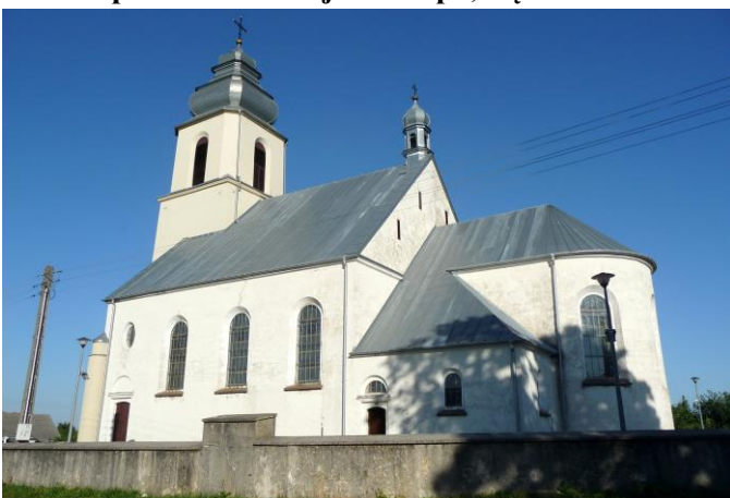
Zdjęcie nr 2. Kościół pw. Św. Mikołaja Biskupa, Dębno