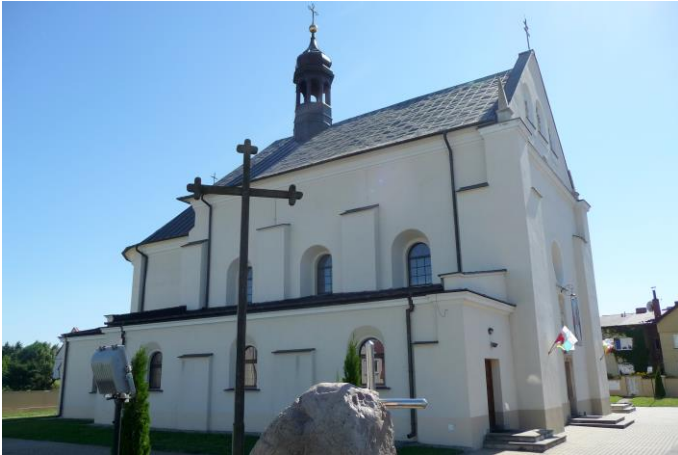
Zdjęcie nr 1. Kościół parafialny pw. św. Wawrzyńca w Nowej Słupi

Kościół zbudowany w 1678 r., rozbudowany o nawy boczne i zakrystię w latach 50-tych XX w. Budowla o cechach późnogotyckich; we wnętrzu zachowane sklepienie kolebkowe z lunetami, pokryte późnorenesansową sztukaterią. Ołtarz główny z czarnego marmuru z 1 poł. XVIII w. z rzeźbą Chrystusa na krzyżu, ołtarze boczne z obrazami z XVII w.