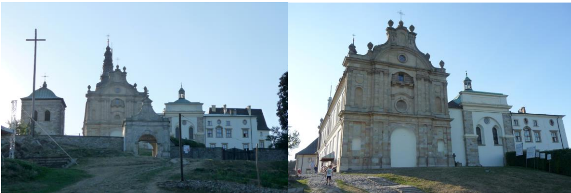
Zdjęcia nr 3, 4. Zespół klasztorny, Święty Krzyż

Zespół klasztorny benedyktynów obejmujący kościół pw. Trójcy Św., klasztor, dzwonnice, ogrodzenie z bramą i bramę wsch. oraz dawny szpital, położony jest nieco poniżej szczytu Łysej Góry, w kierunku płn.-wsch. Usytuowany w otwartej przestrzeni, dominuje nad okolicą, dookoła – puszcza jodłowa. Wzgórze opada stromym zboczem wsch. do Nowej Słupi, po którym wiedzie Droga Królewska, w górnej części wyłożona kamieniem. Ruch kołowy prowadzi od zach. Teren zespołu wrzecionowaty, wydłużony na linii wsch.-zach., częściowo naturalny, częściowo splantowany, otoczony jest murami oporowymi i ogrodzeniem z bramami. Zespół składa się z orientowanego kościoła – stanowiącego płd. zamknięcie prostokątnego wirydarza klasztornego i klasztoru – razem tworzących zamknięty czworobok zabudowań z krużgankami obiegającymi wirydarz; od zach. dwa skrzydła na rzucie litery L, które otaczają dziedziniec otwarty na płd. Na osi płn. skrzydła klasztoru – tzw. wielki ryzalit; między nim a bramą główną – obszerny plac gospodarczy otoczony wysokim, kamiennym murem. W płn.-zach. części założenia – budynek dawnego szpitala, przed nim rozległy, owalny plac – dawny dziedziniec więzienny. Obszar założenia określają mury oporowe, ogrodzenia i bramy. Brama główna – w części wsch. Między bramą a kościołem – dzwonnica. Elementem współczesnym jest tu wieża przekaźnika radiowo-telewizyjnego o wysokości 157 m, wzniesiona w 1966 r., zlokalizowana w odległości ok. 100 m od zespołu.