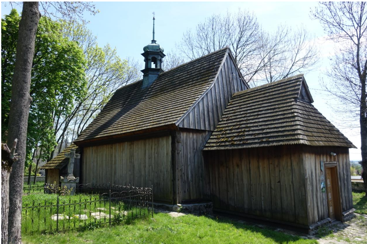
Zdjęcie 16. Drewniany kościół pw. św. Leonarda w Busku – Zdroju.