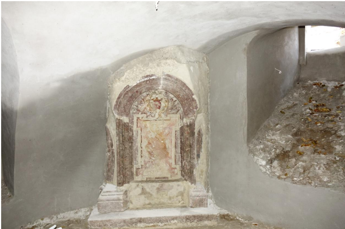
Zdjęcie 15. Krypta znajdująca się pod kaplicą św. Anny – pozostałość po kościele klasztorным w Kątach Starych.