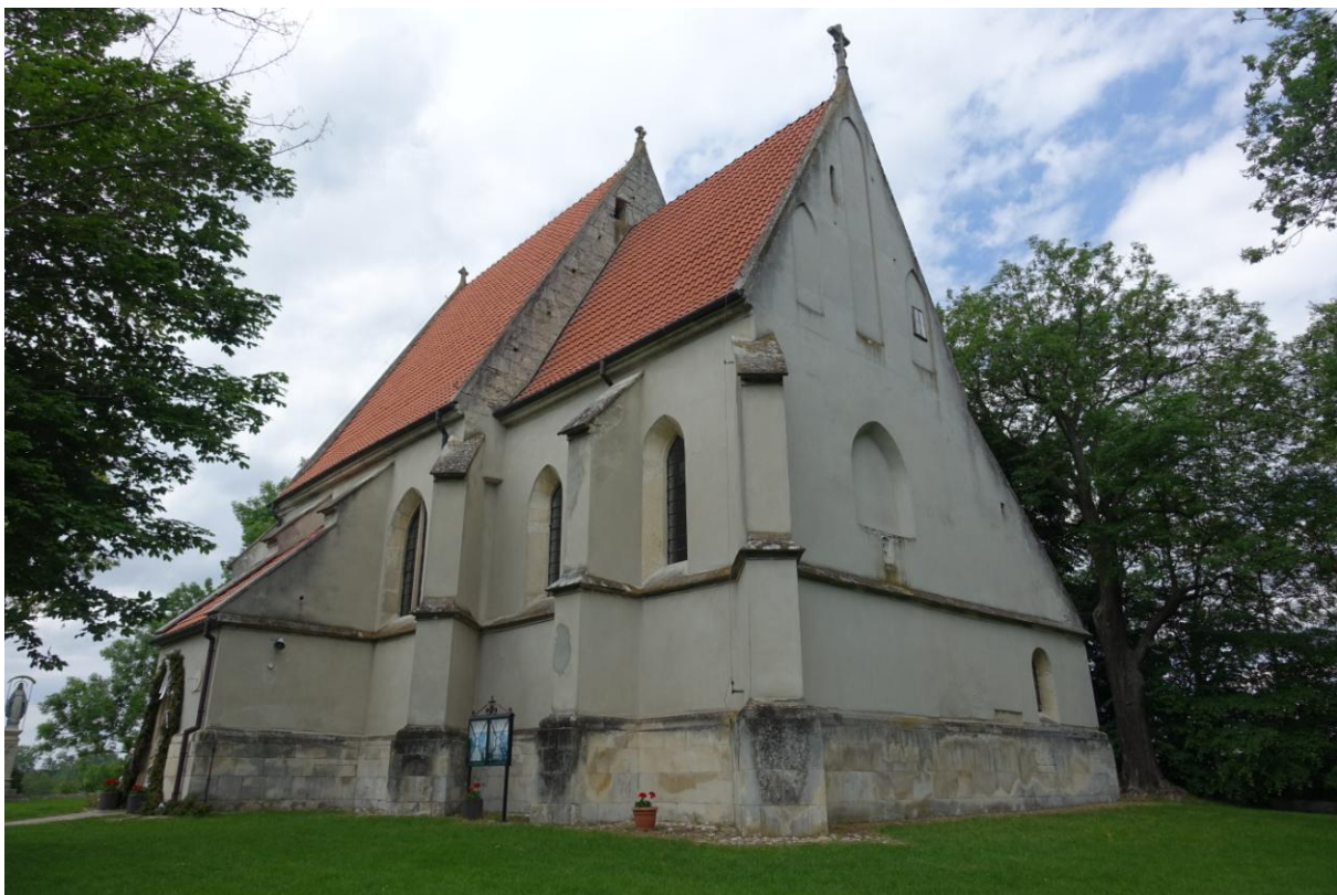
Zdjęcie 7. Gotycki kościół pw. św. Bartłomieja w Chotlu Czerwonym.