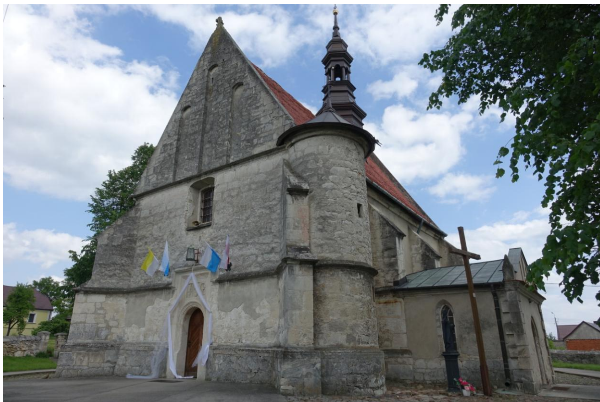
Zdjęcie 8. Kościół pw. św Marii Magdaleny w Dobrowdzie.