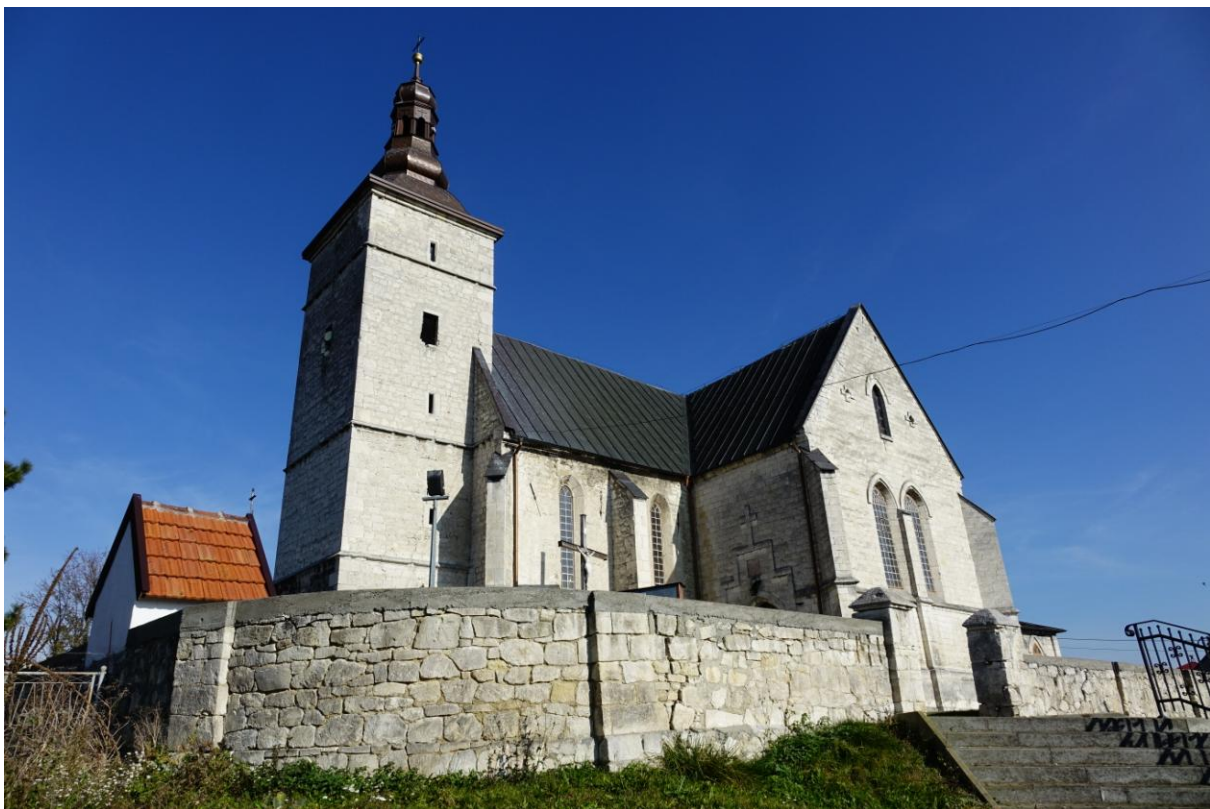
Zdjęcie 10. Kościół pw. Wniebowzięcia Najświętszej Marii Panny w Strożyskach.