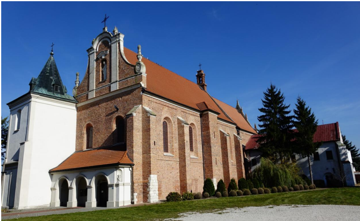
Zdjęcie 4. Kościół pw. św. Stanisława w Nowym Korczynie z widocznym skrzydłem poklasztornym przylegającym do prezbiterium kościoła.