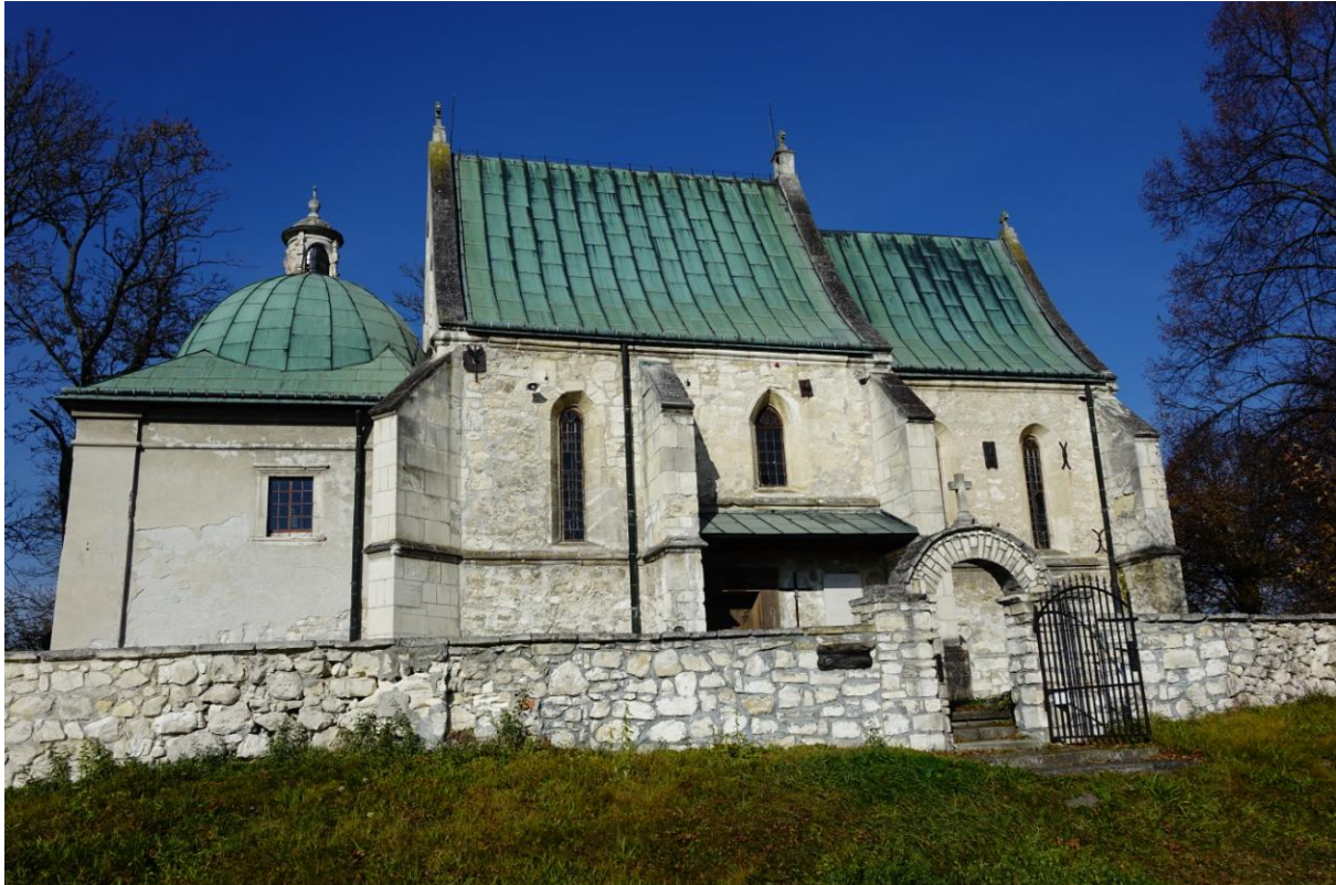
Zdjęcie 11. Kościół pw. św. Wawrzyńca diakona i męczennika w Gorzysławicach.

14) Zespół kościoła parafialnego pw. św. Jakuba Starszego Apostoła w Szczaworyżu , nr rejestru: A 40/1-2, data wpisu 02.04.2008, w skład którego wchodzi: