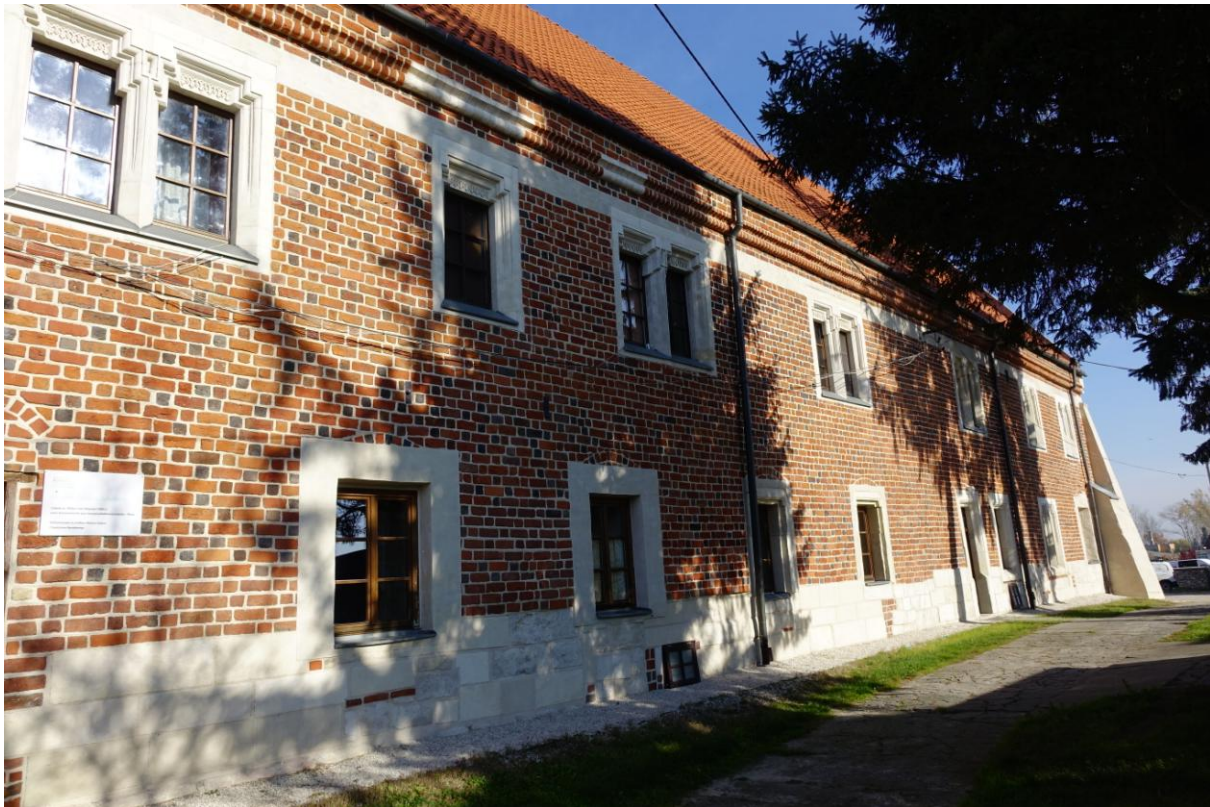
Zdjęcie 3. Dom Długosza w Wiślicy.