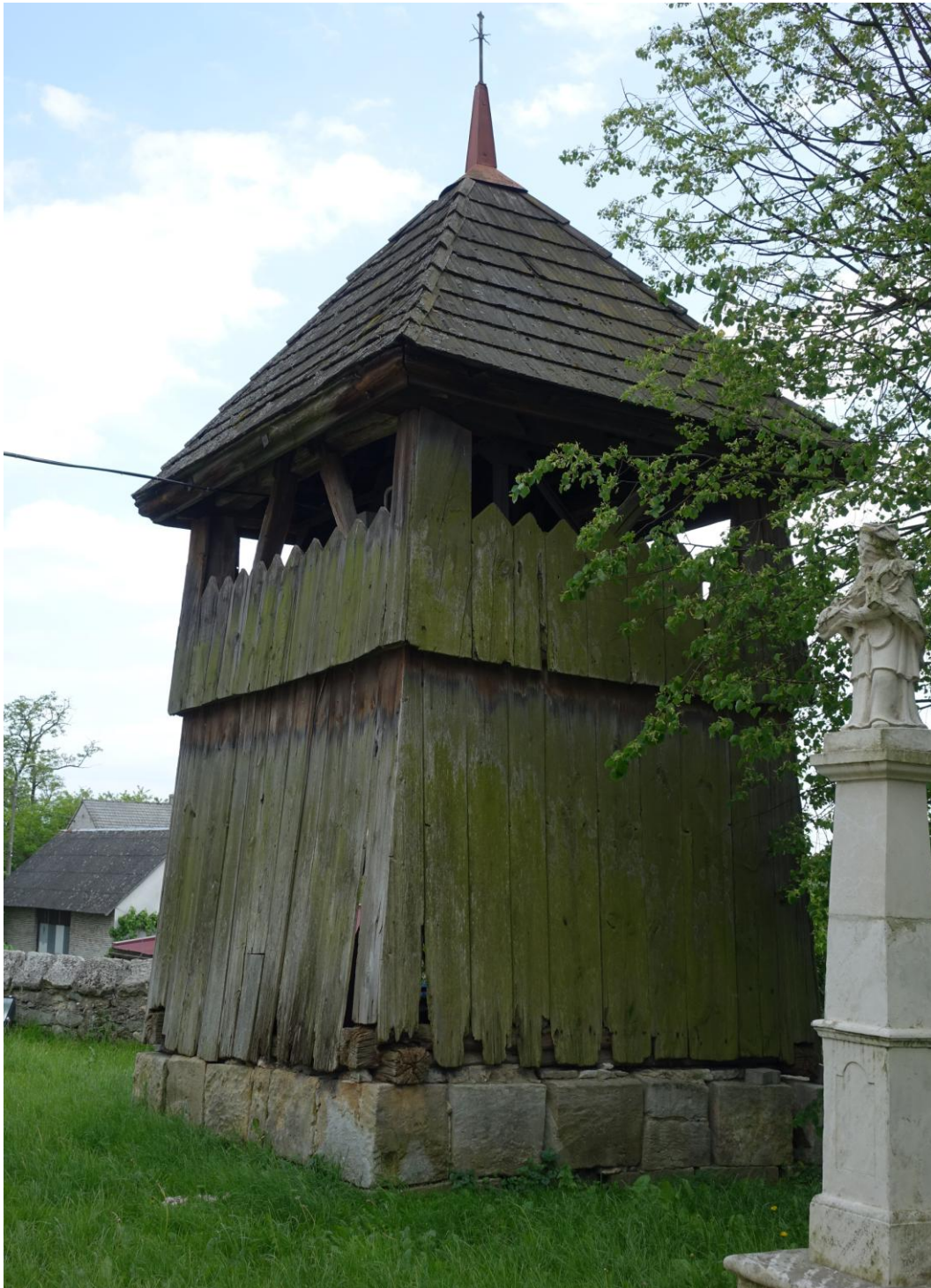
Zdjęcie 9. Drewniana dzwonnica z XVIII w. w Dobrowodzie.