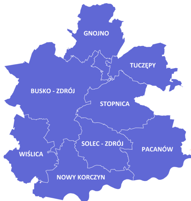
Rysunek 3. Poglądowa mapa Powiatu Buskiego.

Obszary chronionego krajobrazu w Powiecie Buskim obejmują część obszarów gmin: Busko - Zdrój, Solec - Zdrój, Nowy Korczyn, Stopnica, Pacanów i Wiślica - są to: Chmielnicko - Szydłowski, Solecko - Pacanowski, Nadnidziański i Szaniecki Obszar Chronionego Krajobrazu. W Powiecie Buskim znajdują się także rezerwat przyrody (rezerwat słonoroślwy w Owczarach) oraz rezerваты stepowe (Góry Wschodnie, Przęślin, Skorocice i Skotniki Górne).