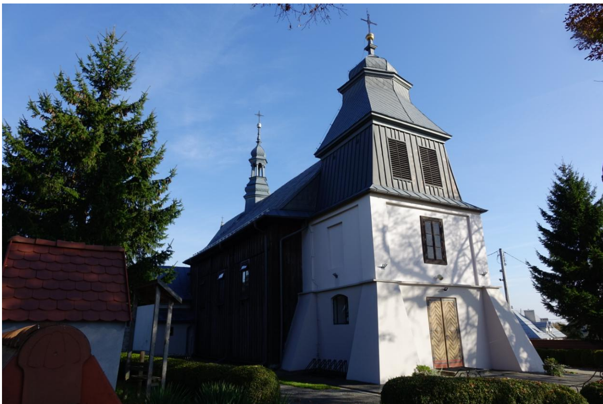
Zdjęcie 18. Drewniany kościół pw. św. Stanisława Biskupa Męczennika w Świniarach.