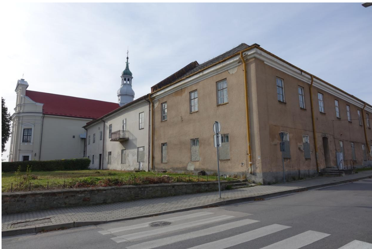
Zdjęcie 12. Ponorbertański zespół klasztorny w Busku - Zdroju.