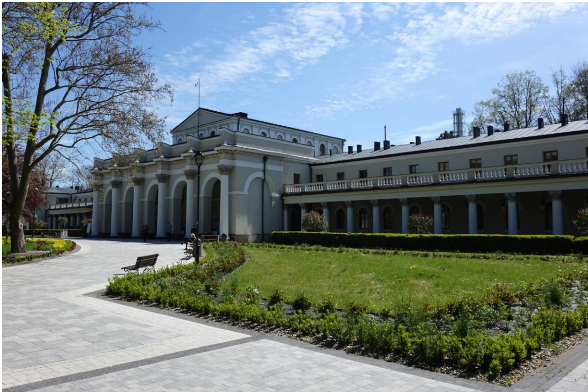
Zdjęcie 20. Sanatorium „Marconi” w Busku - Zdroju.