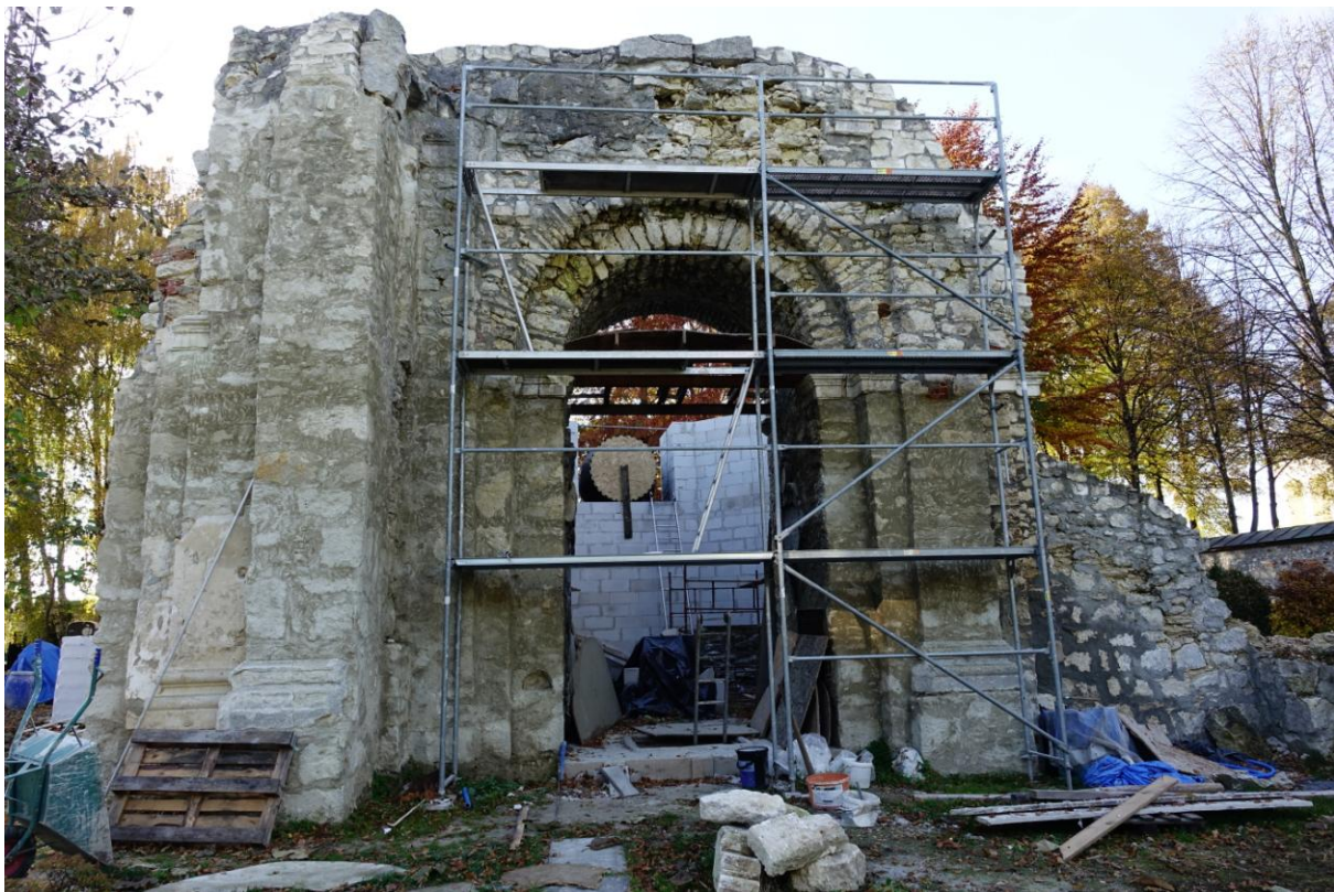
Zdjęcie 14. Odbudowa kaplicy św. Anny - pozostałość po kościele klasztornym w Kątach Starych..

16) Zespół klasztorny Księży Sercanów (dawniej oo. Reformatów) w Kątach Starych – wpisany pod numerem A.73/1-4 z 16.10.1956 i z 23.06.1967. Ufundowany przez Krzysztofa i Zofię Ossolińskich, wybudowany w 1639 r. Ojcowie reformaci zostali wprowadzeni do klasztoru w 1648 r. W 1672 r. w jego murach pochowano matkę Jana Chryzostoma Paska. Prawdopodobnie sam Jan Chryzostom Pasek spoczął tu w 1701 r. Kościół klasztorny został niemal doszczętnie zniszczony przez Niemców w dniu 7 listopada 1944 r. Niestety nie odbudowano dawnego kościoła pod wezwaniem św. Marii Magdaleny i Franciszka. Zachowały się z niego fragmenty murów przejścia z nawy do kaplicy św. Anny, pozostałości piwnic i resztki fasady. Obecnie podejmowane są działania w celu odbudowania kaplicy bocznej św. Anny z dawnego kościoła klasztornego. Istniejący kościół powstał po przebudowaniu jednego ze skrzydeł klasztornych. Do wnętrza zespołu prowadzi barokowa brama. Na murze dziedzińca umieszczono epitafium ze zniszczonego kościoła. W 1979 r. klasztor został przekazany księżom Sercanom.