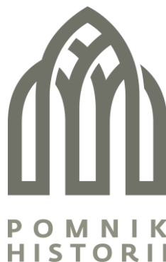
Rysunek 1. Wzór logo „pomnik historii”.

W celu wyróżnienia pomnika historii jako marki i ułatwienia działań promocyjnych, w 2011 roku Narodowy Instytut Dziedzictwa opracował logo, zaakceptowane zostało przez Ministra Kultury i Dziedzictwa Narodowego Logiem pomników historii jest godło z motywem gotyckiego łuku, dostępne jest ono w kilku wersjach kolorystycznych. Szczegółowe informacje dotyczące warunków korzystania z logo „pomnik historii” dostępne są na stronie internetowej NID pod adresem: https://nid.pl/pomniki-historii .