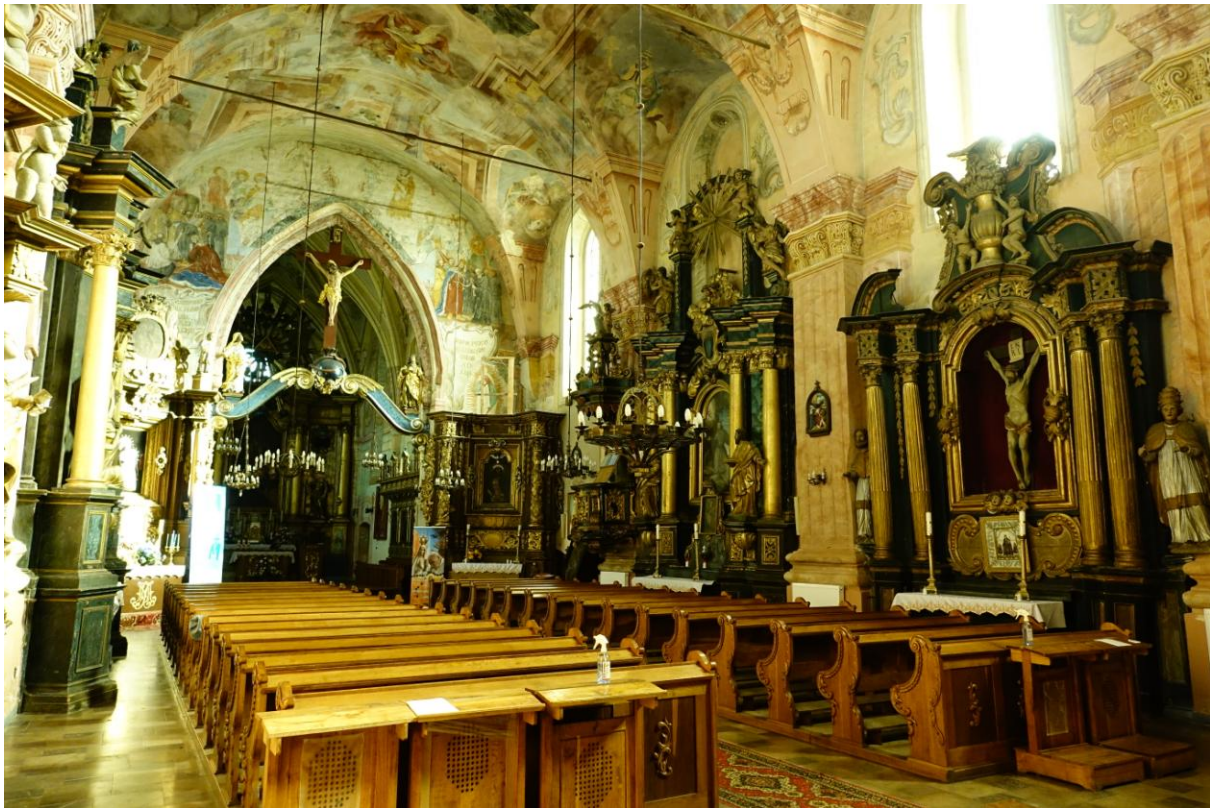
Zdjęcie 5. Wnętrze kościoła pw. św. Stanisława w Nowym Korczynie.