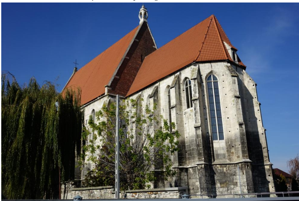
Zdjęcie 1. Bazylika kolegiacka Narodzenia Najświętszej Marii Panny w Wiślicy – widok od strony prezbiterium.