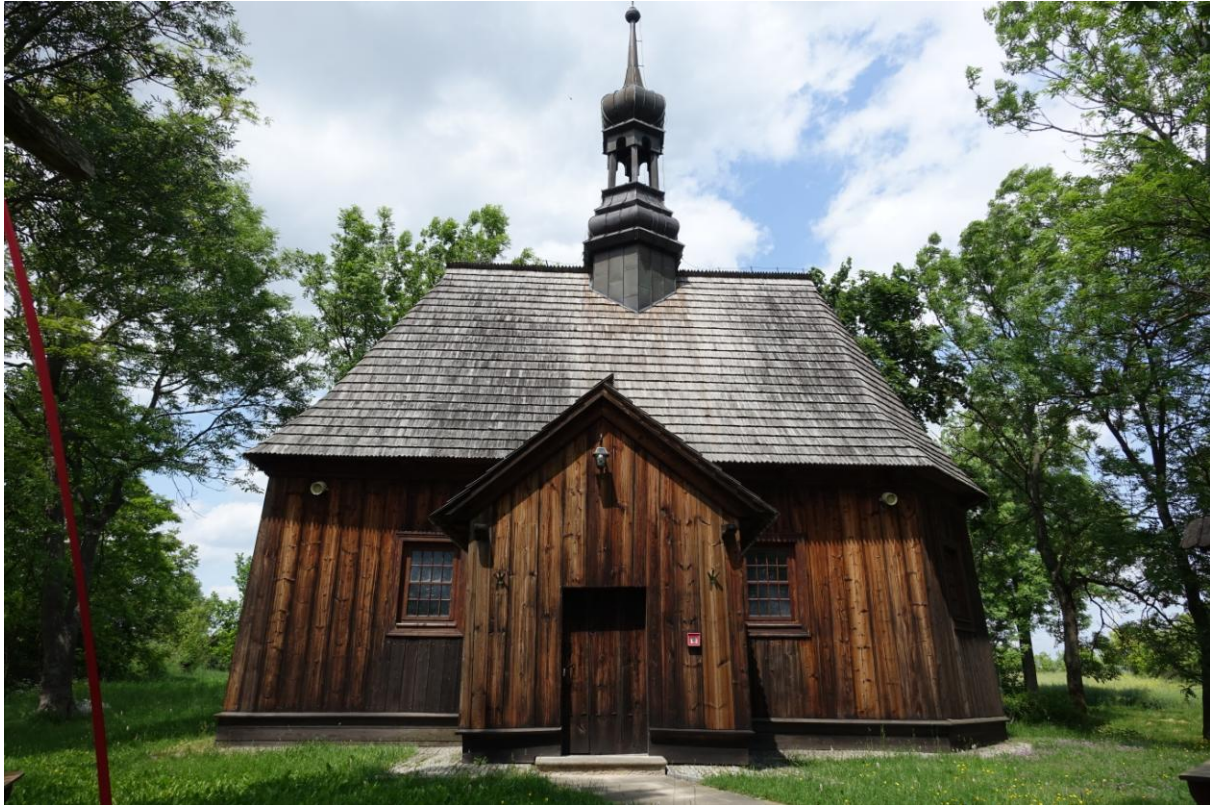
Zdjęcie 17. Drewniany kościół pw. św. Stanisława Biskupa w Chotelku.