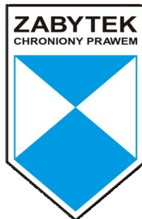
Rysunek 2. Wzór znaku „zabytek chroniony prawem”.

Na podstawie art. 12 ustawy starosta, w uzgodnieniu z wojewódzkim konserwatorem zabytków, może umieszczać na zabytku nieruchomym wpisanym do rejestru znak informujący o tym, iż zabytek ten podlega ochronie. Wzór i wymiary znaku określa Rozporządzenie Ministra Kultury z dnia 9 lutego 2004 r. ( Dz. U. 2004 Nr 30 poz. 259 ). Powinien on być wykonany z blachy w kształcie pięciokątnej tarczy o wymiarach 185 mm x 100 mm. Tarcza skierowana winna być ostrzem w dół, a w jej polu – prócz znaku Błękitnej Tarczy zgodnej z Konwencją Haską z 1954 r. – w jej górnej części zamieszczony powinien być napis „Zabytek chroniony prawem”.