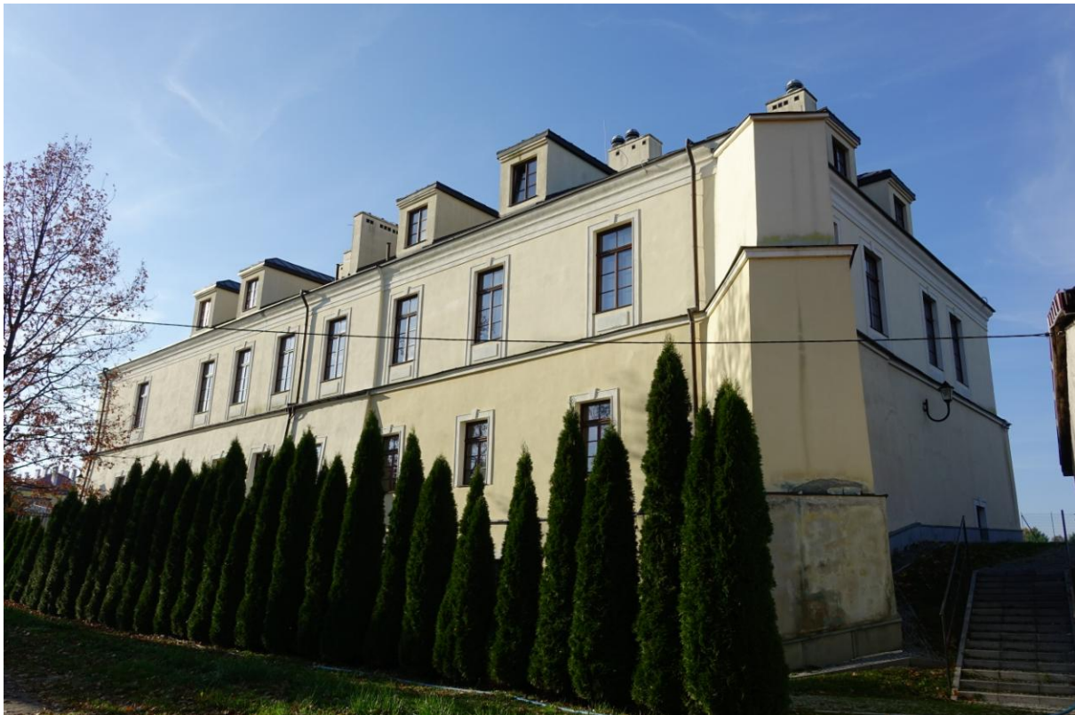
Zdjęcie 19. Zamek w Stopnicy – widok współczesny.