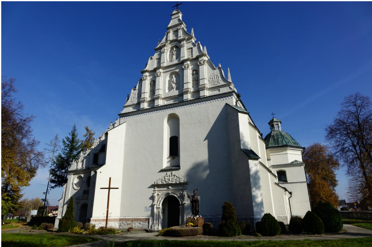
Zdjęcie 6. Kościół pw. św. Świętej Trójcy w Nowym Korczynie.