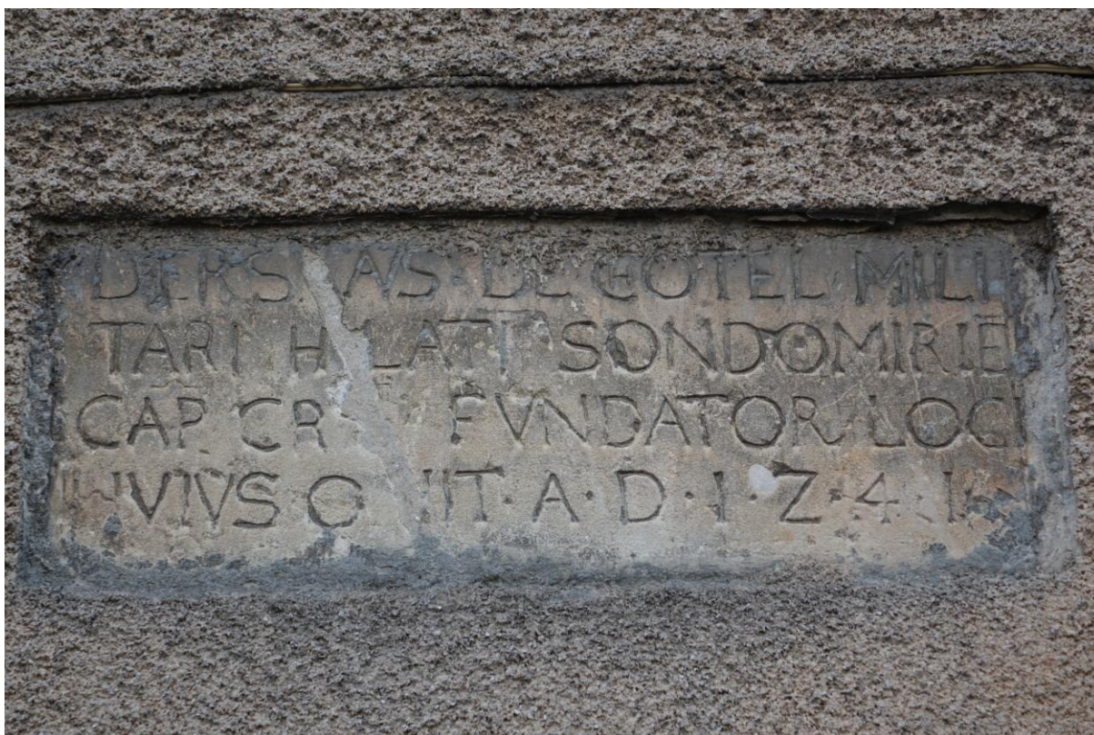
Zdjęcie 13. Tablica wmurowana w północną ścianę budynku poklasztornego odnaleziona w XIX w. z inskrypcją po łacenie: „ Derslaw Chotel militari Palatinus Sandomiriac Capitaneus Cracoviensis fundator loci huius obit anno Domini 1241 ”, co w wolnym przekładzie znaczy: Deresław z Chotla, rycerz, palatyn sandomierski, kasztelan krakowski, fundator tego miasta, zmarł roku Pańskiego 1241.