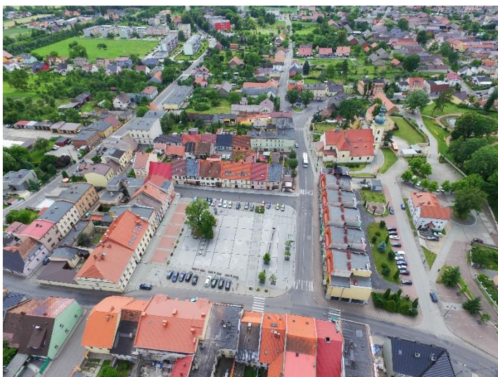
Leśnica - widok na Rynek z lotu ptaka

Przeszłość miasta należy kojarzyć z dziejami wielkich rodów magnackich: Redernami, Promnitzami (od roku 1638) oraz Colonnami (od 1650 do 1807). W okresie wojen napoleońskich Leśnica przestała być miastem prywatnym i uzyskała samorząd. W latach 1807-1808 stacjonowały tu wojska francuskie i bawarskie, a w roku 1813 rosyjskie.