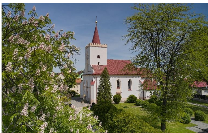
Zalesie Śląskie - kościół pw. świętej Jadwigi