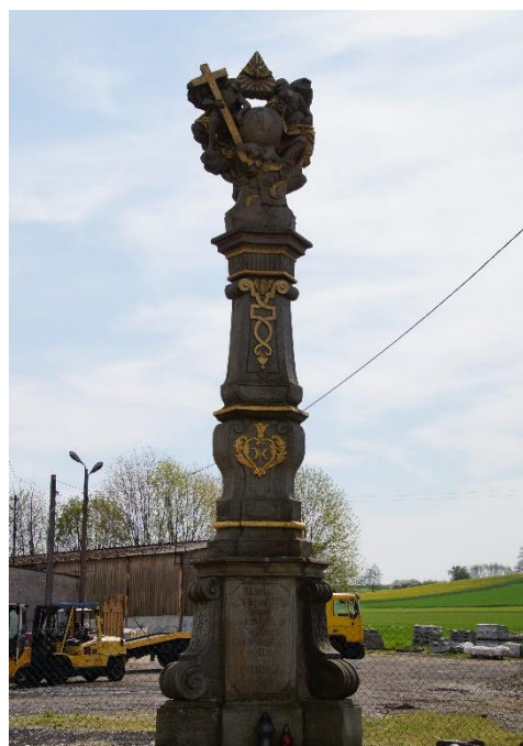
Wysoka - figura Trójcy Świętej

Na terenie Wysokiej zachowały się cenne ślady przeszłości. Najstarszy kościół wzmiankowany był w roku 1371. Kolejny powstał około