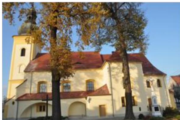
Leśnica, kościół pw. Trójcy Świętej

Najdawniejsze ślady obecności człowieka w tym rejonie pochodzą z okresu paleolitu (ok. 70 000 – 8 000 lat p.n.e). Nie wiadomo jednak, kiedy powstała pierwsza osada na terenie dzisiejszej Leśnicy, której nazwa sugeruje obfitość leśnych obszarów. Po raz pierwszy pojawia się ona – jako Lesnicie – w roku 1217 w dokumencie księcia opolskiego Kazimierza I. Ta targowa osada należała wówczas do książęcego kapelana