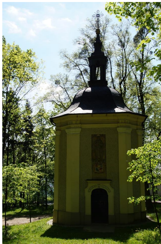
Góra Św. Anny - kaplica św. Marii Magdaleny z zespołu kaplic kalwaryjskich

Góra Św. Anny to centrum pielgrzymkowe śląska opolskiego.