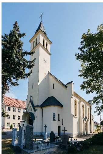
Raszowa – kościół pw. Wszystkich Świętych

Nazwa wioski wywodzi się od nazwiska właściciela lub dzierżawcy Rass. W wykazie wsi książeńcych z 1532 roku użyto nazwy Russowa, a w kościelnych sprawozdaniach powizytacyjnych z lat 1679 i 1688 wieś występuje jako Raszowa oraz Rassowa. Do 1810 roku wioska należała do klasztoru cystersów w Jemielnicy. W tym czasie liczyła ona 259 mieszkańców. Obecnie jest to duża wieś zamieszkała przez 1020 mieszkańców.