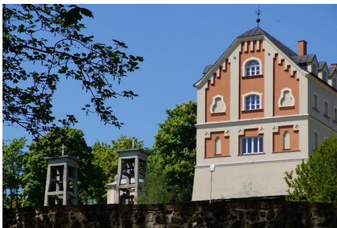
Góra Św. Anny - widok na klasztor Zakonu Braci Mniejszych

Na wschodnim i południowym zboczu Góry św. Anny pomiędzy drzewami rozciąga się annogórska kalwaria, która wzniesiona została staraniem Jerzego Adama de Gaschin w latach 1700-1709. Najpierw powstały trzy duże kościoły i 30 małych kaplic męki Pańskiej, a w późniejszym czasie pozostałe. Ukształtowanie terenu Góry sprzyjało temu, aby „wkomponować” w nie miejsca związane z wydarzeniami ostatnich dni ziemskiego życia Jezusa. Podobnie jak w Jerozolimie, na wschód