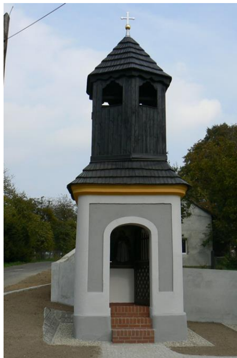
Lichynia - kaplica św. Jana Nepomucena

Bardzo ciekawym obiektem zabytkowym jest przydrożna kapliczka z drewnianą wieżyczką z przełomu XVIII i XIX wieku, kompleksowo odrestaurowana w roku 2013.