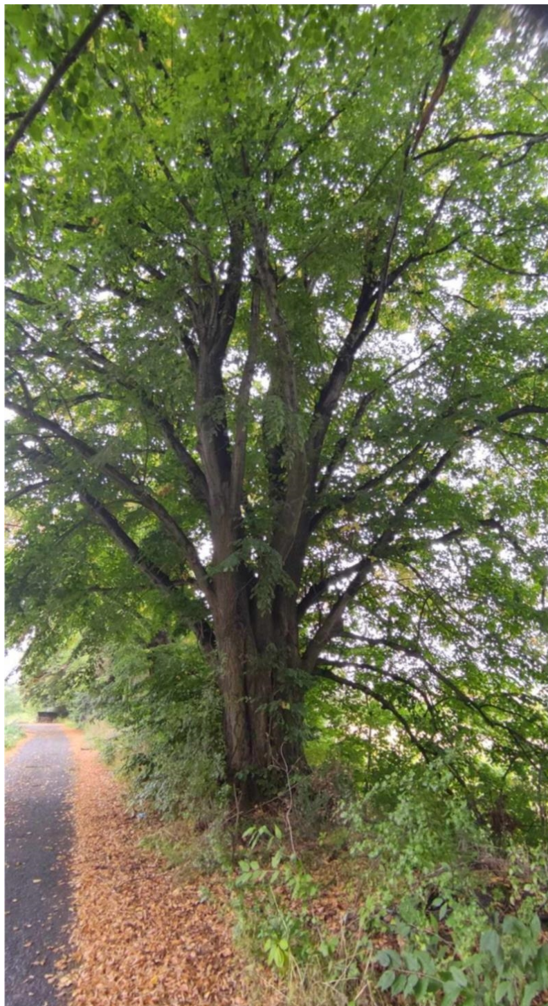
Fot. 4 Lipa drobnolistna Tilia cordata (11 drzewo w alei) Lokalizacja drzewa nr 4 – dz. nr 838/4 (GPS: N: 50.087099, E:17.940581)