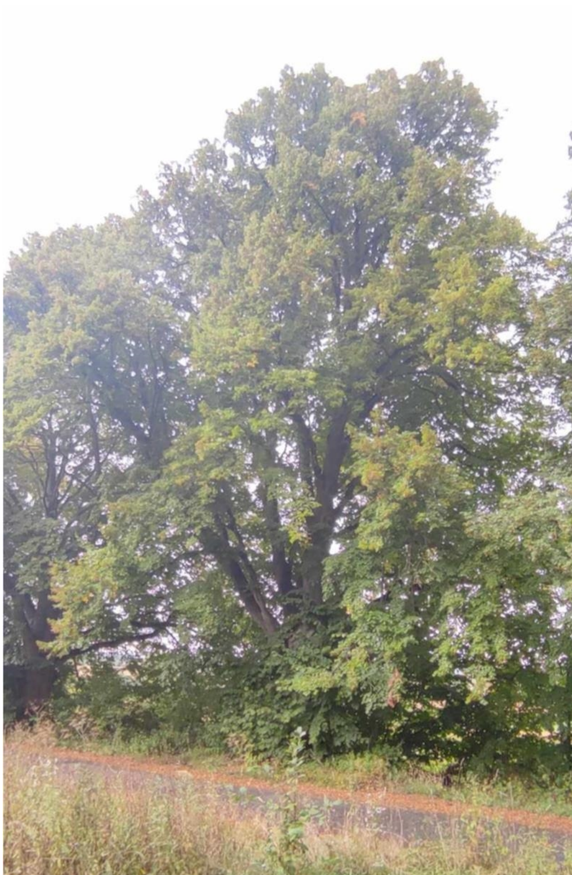
Fot. 2 Lipa drobnolistna Tilia cordata (7 drzewo w alei)

Lokalizacja drzewa nr 2 – dz. nr 838/4 (GPS: N: 50.087337, E:17.941157)