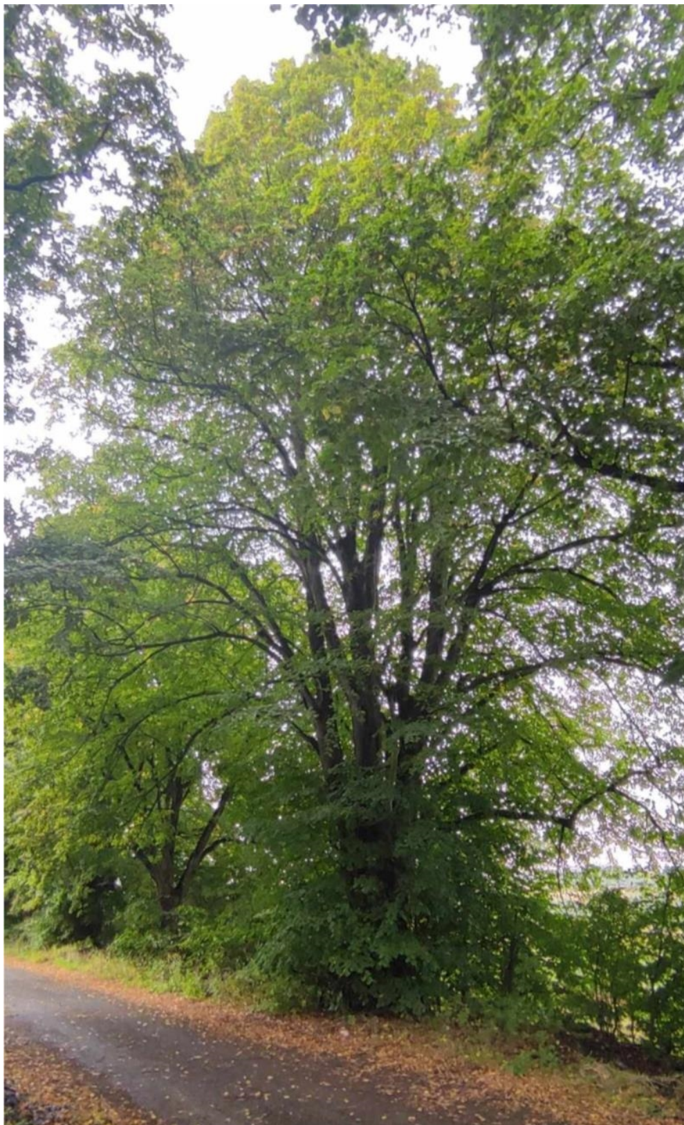
Fot. 1 Lipa drobnolistna Tilia cordata (5 drzewo w alei)

Lokalizacja drzewa nr 1 – dz. nr 838/4 (GPS: N: 50.087452, E:17.941447)