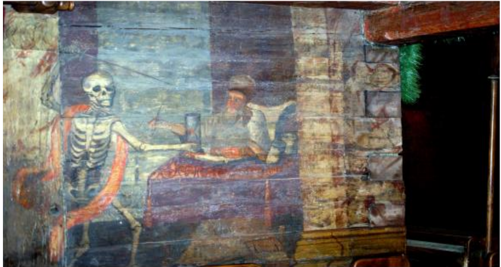
Bierzka śmierć

Dobrzeń Wielki – pierwsze wzmianki o miejscowości pochodzą z 1228, wymieniana jest jako wieś przynależna do klasztoru w Czarnowasach. Kościół p.w. świętego Rocha drewniany wybudowany w 1658 roku, usytuowany na cmentarzu na końcu wsi. Ołtarz główny barokowy z 1700r. z obrazem św. Rocha. 16.08 to dzień pielgrzymek z okazji imienin patrona, do dziś żywy jest tu kult św. Rocha.