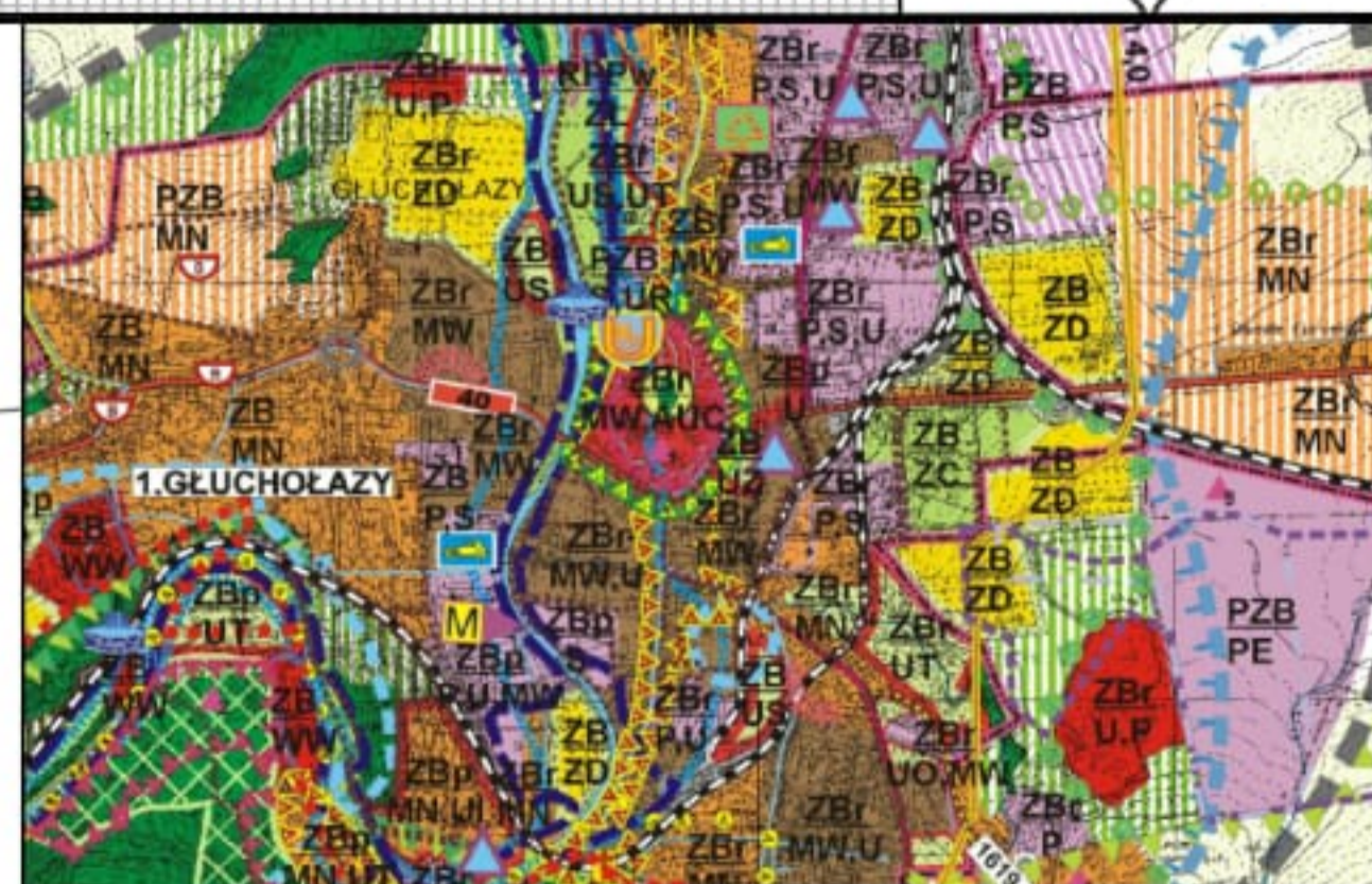
WYRYS ZE ZMIANY STUDIUM UWARUNKOWAŃ I KIERUNKÓW ZAGOSPODAROWANIA PRZESTRZENNEGO GMINA GŁUCHOŁĄŻY