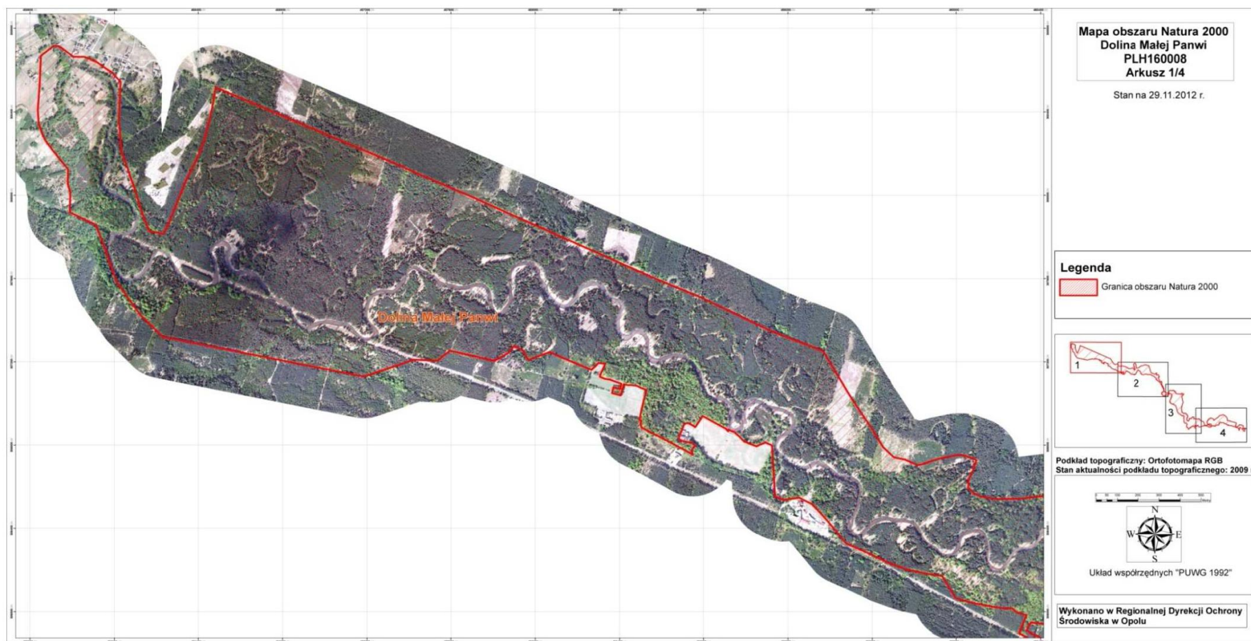
Mapa obszaru Natura 2000