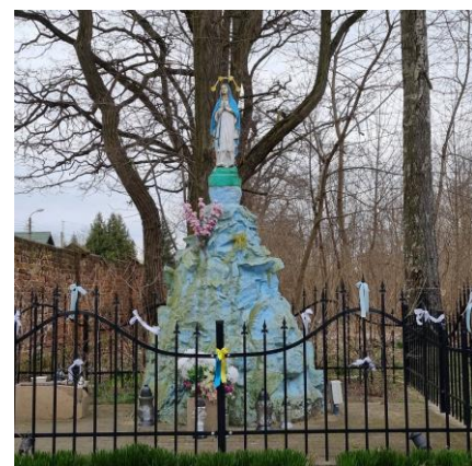
Fotografia 3. Przykład kapliczki przydrożnej zlokalizowanej w miejscowości Pawłowice.

W gminnej ewidencji zabytków zostało zewidencjonowanych 19 kapliczek przydrożnych.