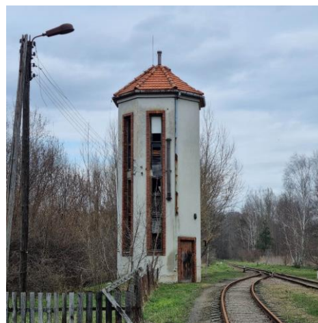
Fotografia 11. Widok na wodociągową wieżę ciśnień w Rudzie.