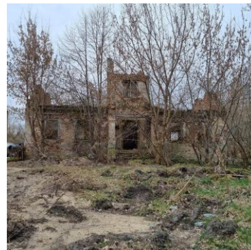
Fotografia 6. Widok na ruinę dworu w Komornikach.