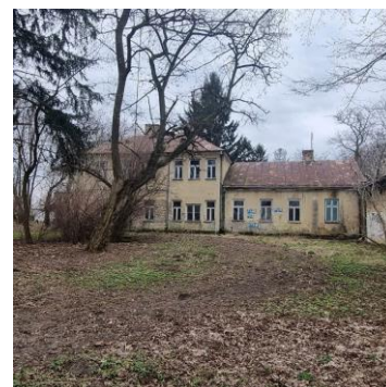
Fotografia 8. Widok na dwór w Drozdach.