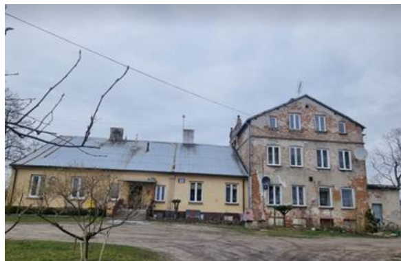
Fotografia 9. Widok na dwór w Kopanej.

Obiekt wybudowany w połowie XIX w. Budynek składa się z 2 części: pierwszej parterowej prawdopodobnie wybudowanej w 1 poł. XIX w. krytej dachem dwuspadowym (blacha) oraz drugiej części, przylegającej od wschodu, pochodzącej z 1901 r. (data w attyce) dwukondygnacyjnej z użytkowym poddaszem krytej dachem dwuspadowym. Jeszcze później zostały dobudowane dwa symetryczne aneksy, po bokach ryzalitu wejściowego.