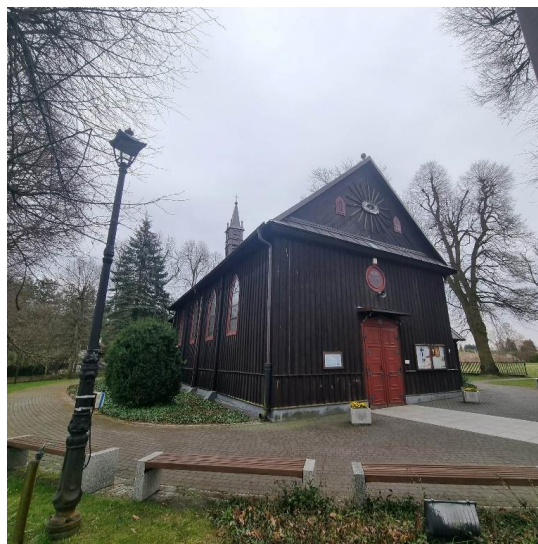
Fotografia 2. Widok na kościół parafialny pw. Jana Chrzciciela w Rembertowie.