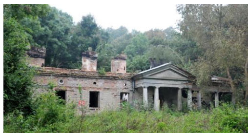
Fotografia 10. Widok na dwór w Jeżewicach.