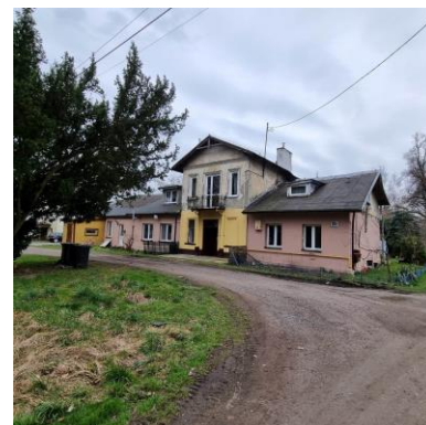
Fotografia 7. Widok na dwór w Pawłowicach.