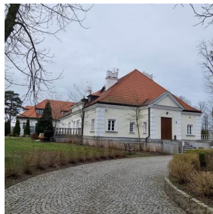
Fotografia 4. Widok na dwór w Manach.

Dwór budowany przez architekta Tadeusza Tołwińskiego w roku 1928 z przeznaczeniem na willę własną. Budynek prawdopodobnie powstał z wykorzystaniem starszej budowli, nie został jednak ukończony. W roku 1947 dwór przeszedł w posiadanie Stanisława Wójcika. W 1989 roku dwór od córek tego ostatniego nabył Artur Borzewski. Zaraz potem rozpoczął się generalny remont budynku. Dwór rozebrany bez zgody konserwatora zabytków został całkowicie zrekonstruowany.