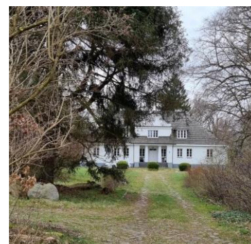
Fotografia 5. Widok na dwór w Pracach Dużych.

Obiekt wybudowany w 2 połowie XIX w. dla Apolinarego Budnego. Użytkowany do połowy lat 70-tych XX w., następnie w ruinie. Odbudowany po 2000 r. Reprezentuje styl dworski o cechach baroku.