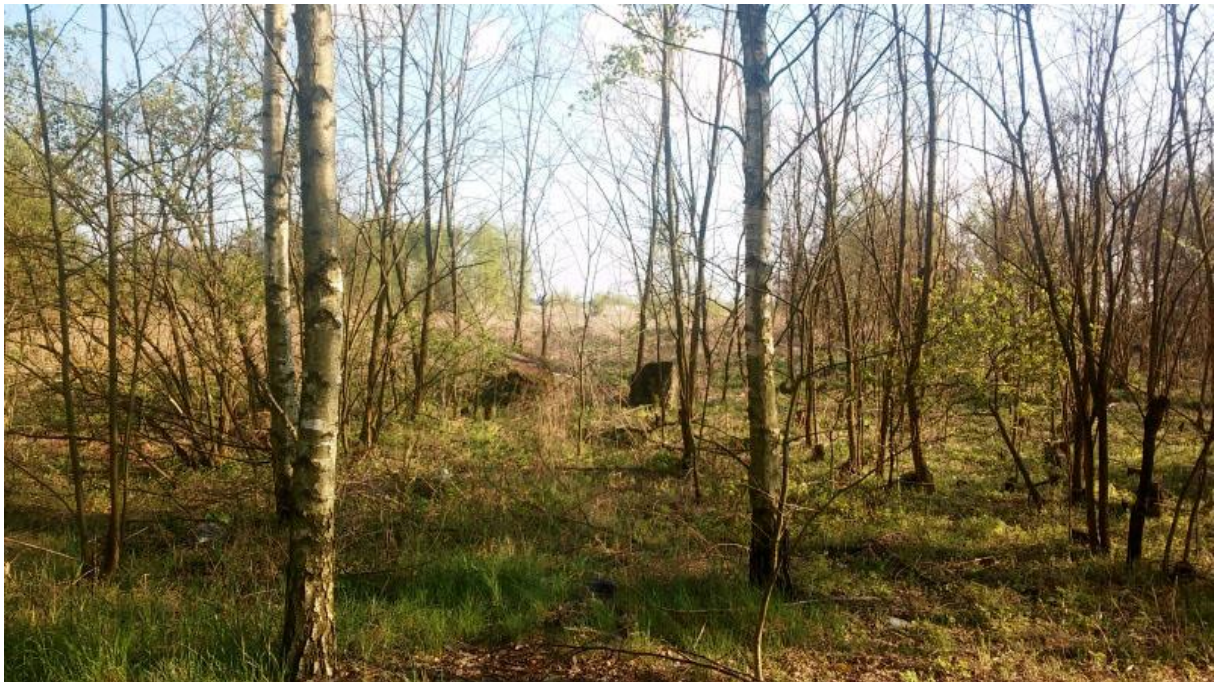
Fot. 4. Wolanów. Cmentarz żydowski (fot. autor opracowania).