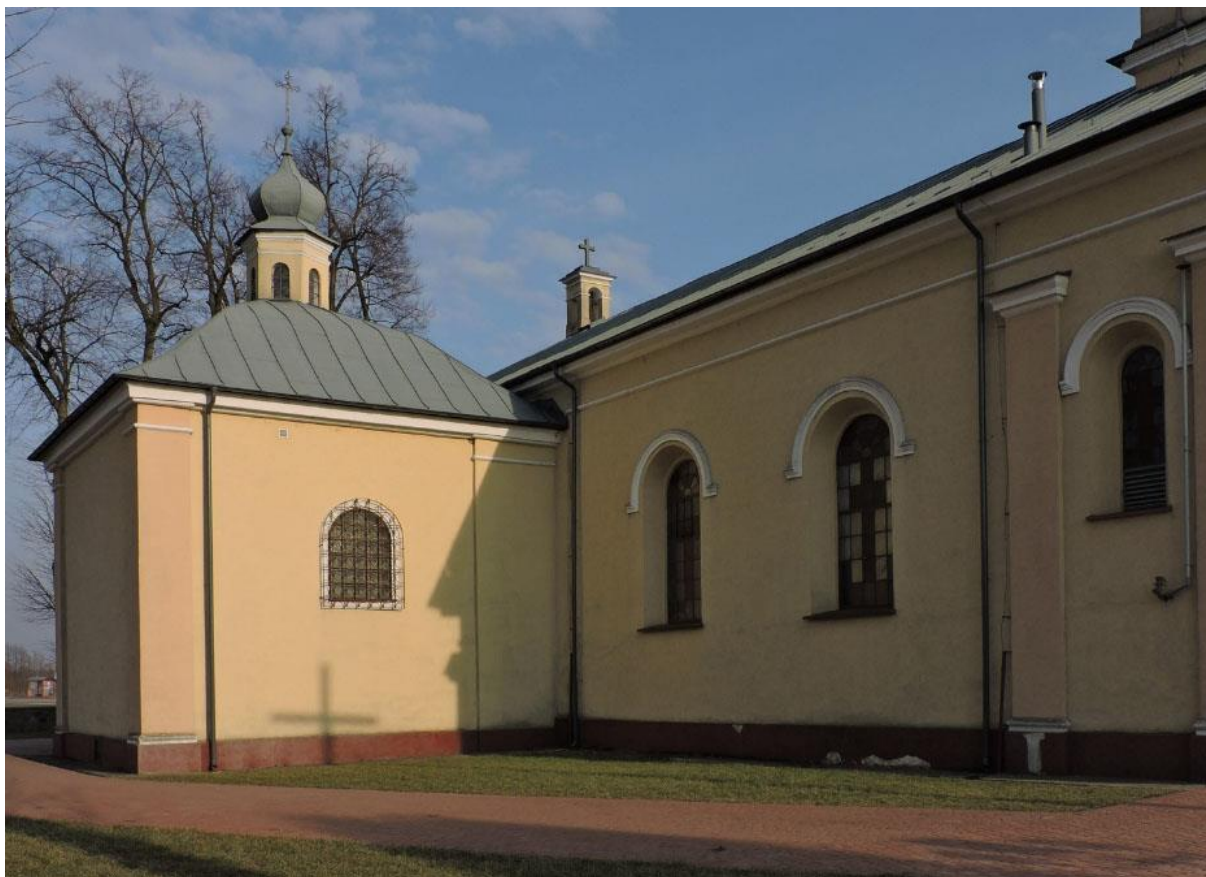
Fot. 2. Mniszek. Kaplica pw. Św. Józefa.

Kaplica pw. Św. Józefa w Mniszku (rejestr zabytków nr 460/A). Kaplica z 1667 r. murowana z cegły, tynkowana, na rzucie kwadratu. Zlokalizowana po lewej stronie korpusu kościoła, nieznacznie niższa od korpusu. Nakryta pseudo-kopułą z latarnią nakrytą cebulastym hełmem. Elewacje zewnętrzne zdobione profilowanym gzymsem i pilastrami w narożach. Strop płaski w kaplicy. Portal ujmujący wejście z kaplicy do nawy, kamienny, rustykowany z 2 poł. XVII w. z herbem Grzymała i literami MD w kluczu.