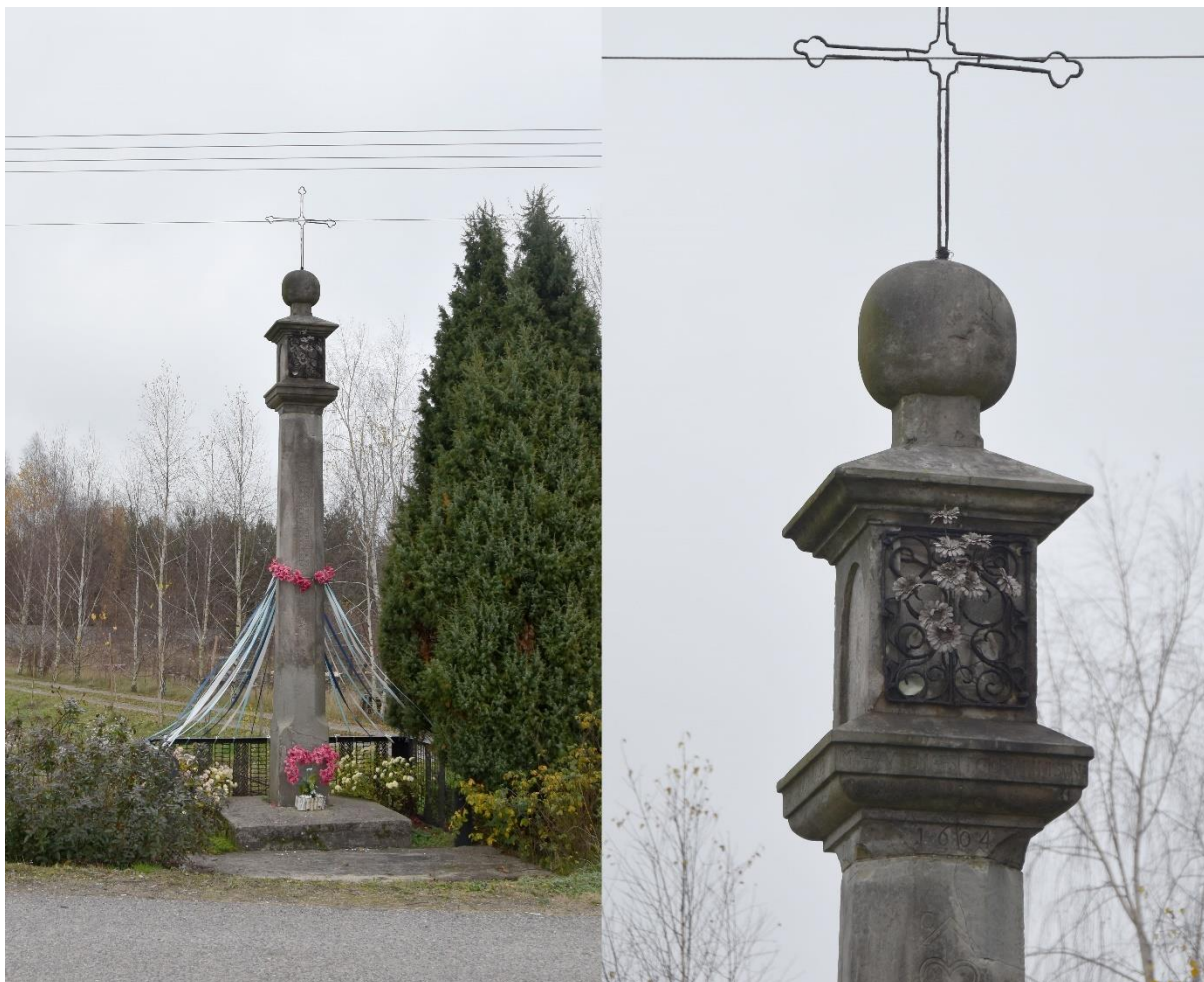
Fot. 8. Mniszek. Kapliczka z 1604 r..