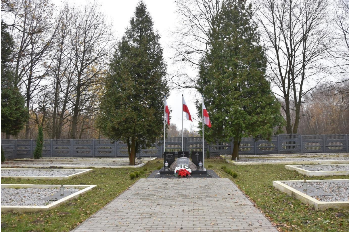
Fot. 3. Chruślice. Cmentarz wojenny.

Cmentarz żydowski w Wolanowie. Zlokalizowany na pd. - zach. od centrum miejscowości, przy ul. Spacerowej. Dokładna data założenia cmentarza nie jest znana. Z całą pewnością istniał w latach 80-tych XVIII w. Wiadomo, że w okresie międzywojennym był ogrodzony. Obiekt uległ daleko posuniętym zniszczeniom podczas II wojny światowej oraz w latach późniejszych. Ostatni nagrobek w obrębie cmentarza znajdował się na początku lat 90. XX w.