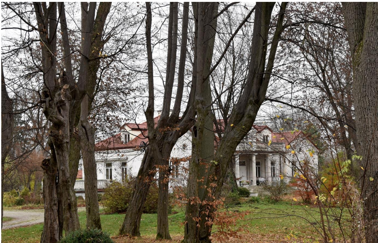
Fot. 5. Strzałków. Dwór.

Park zajmuje powierzchnię ok. 4,5 ha. Kompozycja zespołu dworskiego opierała się na trzech alejach. Obecnie zachowały się dwie: brzozowa (północna część parku) i grabowa (południowo-zachodnia). Aleja dojazdowa - grabowa, przy drodze do dworu straciła swój pierwotny charakter przez częściowe wycięcie drzew i zmianę przebiegu drogi. Ale brzozowa dobrze zachowana. W części północnej parku znajdują się stawy. Drzewostan mieszany. Park wpisany jest do rejestru zabytków pod nr 762.