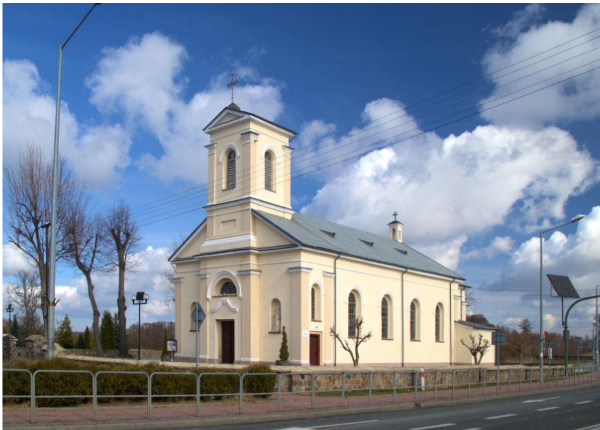
Fot. 1. Mniszek. Kościół parafialny pw. Św. Jana Chrzciciela i Św. Stanisława Kostki.

Kościół murowany z cegły, tynkowany. Od południowego - zachodu, trójkondygnacyjna wieża nad kruchtą, nakryta dachem dwuspadowym. Jednonawowy korpus, nakryty dwuspadowym dachem. Po lewej stronie korpusu kaplica, nieznacznie niższa od korpusu. Prezbiterium równe wysokością korpusowi, nakryte trójpołaciowym dachem, o kalenicy niższej od kalenicy korpusu. Po bokach prezbiterium zakrystia i pomieszczenie po lewej stronie, niższe od prezbiterium, nakryte pulpitowymi dachami. Sklepienie kolebkowe o łuku odcinkowych w zakrystii, w pomieszczeniu po lewej stronie prezbiterium i w kruchcie. Pokrycie dachu: blacha stalowa, ocynkowana. Okna wysokie, prostokątne, zamknięte łukiem pełnym, w żeliwnych ramach. Elewacje zewnętrzne dzielone profilowanymi gzymsami i pilastrami. Wyposażenia: ołtarz barokowy z 2 poł. XVII w., kamienne epitafium Antoniego Kietlińskiego zm. 1798 r., feretron z obrazem Matki Boskiej z Dzieciątkiem z k. XVIII w.