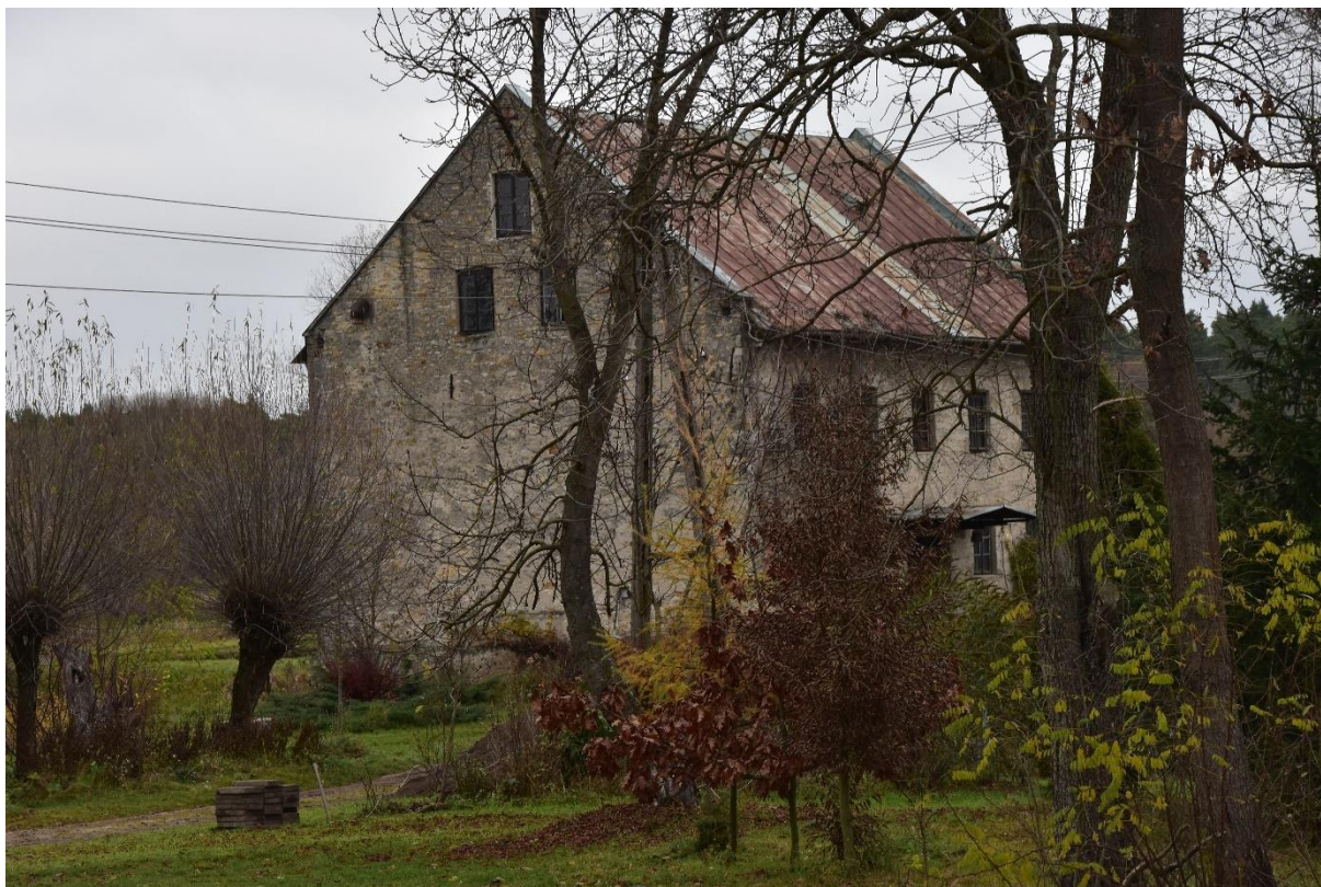
Fot. 6. Wymysłów-Soszyn. Młyn.

Wymysłów-Soszyn. Młyn wodny (rejestr zabytków nr A-939). Obiekt wzniesiony w k. XIX w., zlokalizowany na rzece Szabasówka. Murowany, tynkowany, na planie prostokąta, skierowany na południe, dwukondygnacyjny z użytkowym poddaszem. Elewacja frontowa 5-osiowa, z otworem wejściowym na osi poprzedzony zadaszeniem. Dach dwuspadowy, kryty blachą.