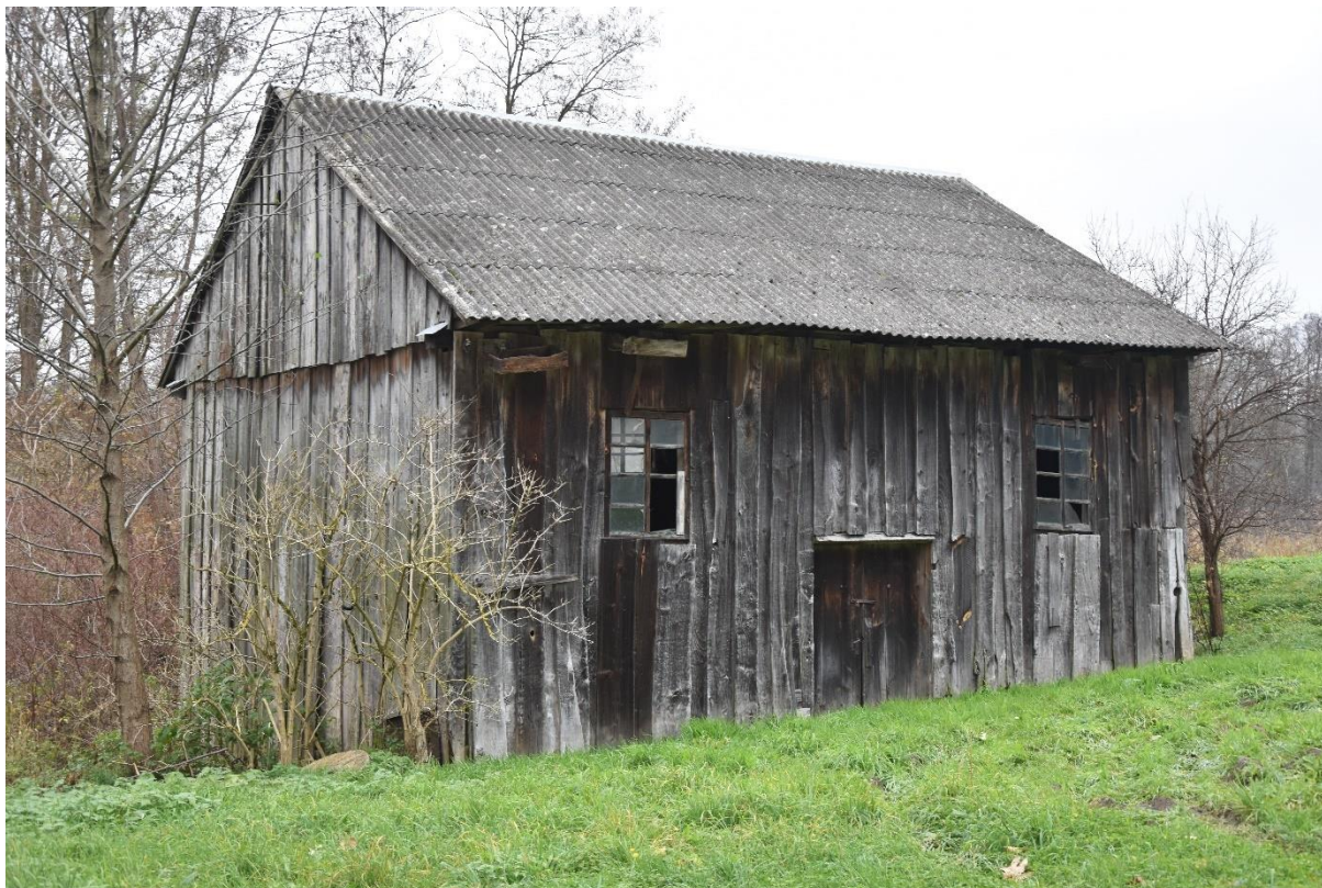
Fot. 7. Zabłocie. Młyn.

Szalowany pionowymi deskami. Elewacja frontowa 3-osiowa z dwoma otworami okiennymi i wejściem na osi. Dach dwuspadowy, kryty eternitem.