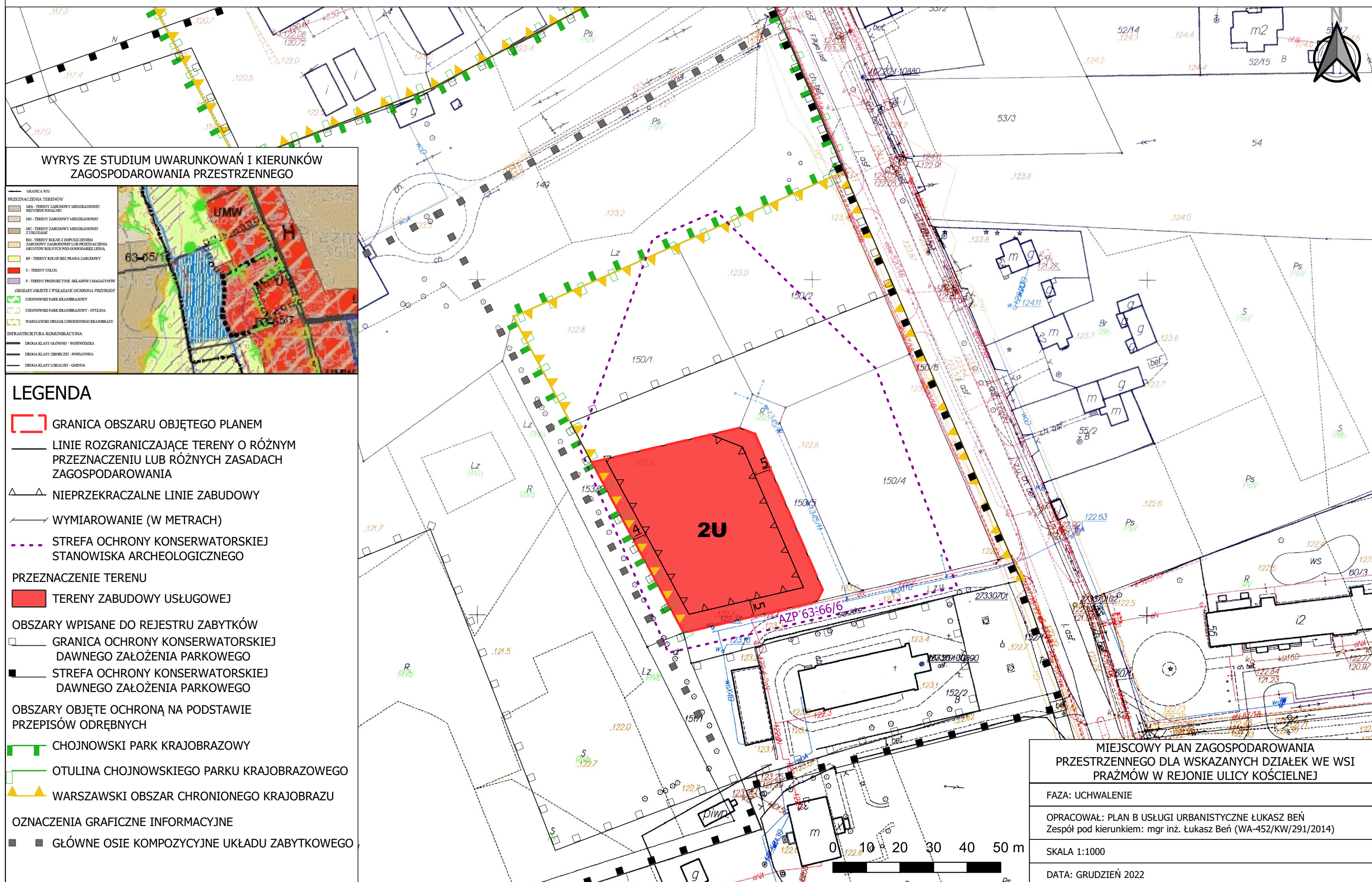
WYRYS ZE STUDIUM UWARUNKOWAŃ I KIERUNKÓW ZAGOSPODAROWANIA PRZESTRZENNEGO

Załącznik nr 1 do Uchwały nr XLVII.544.2022 Rady Gminy Prażmów z dnia 5 grudnia 2022r.