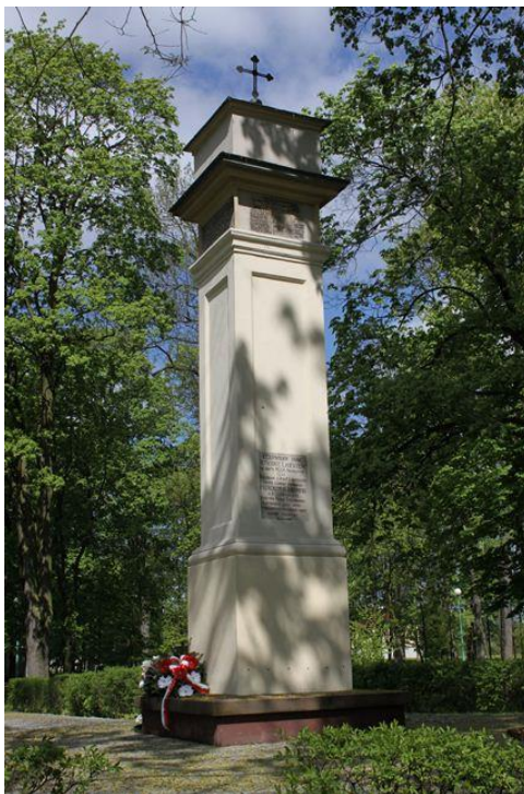
Rysunek 2. Kolumna upamiętniająca narodziny króla Zygmunta I Starego z początku XVI wieku.

Cenne elementy wyposażenia znajdują się w kościele pw. Św. Krzyża w Kozienicach. Należą do nich: