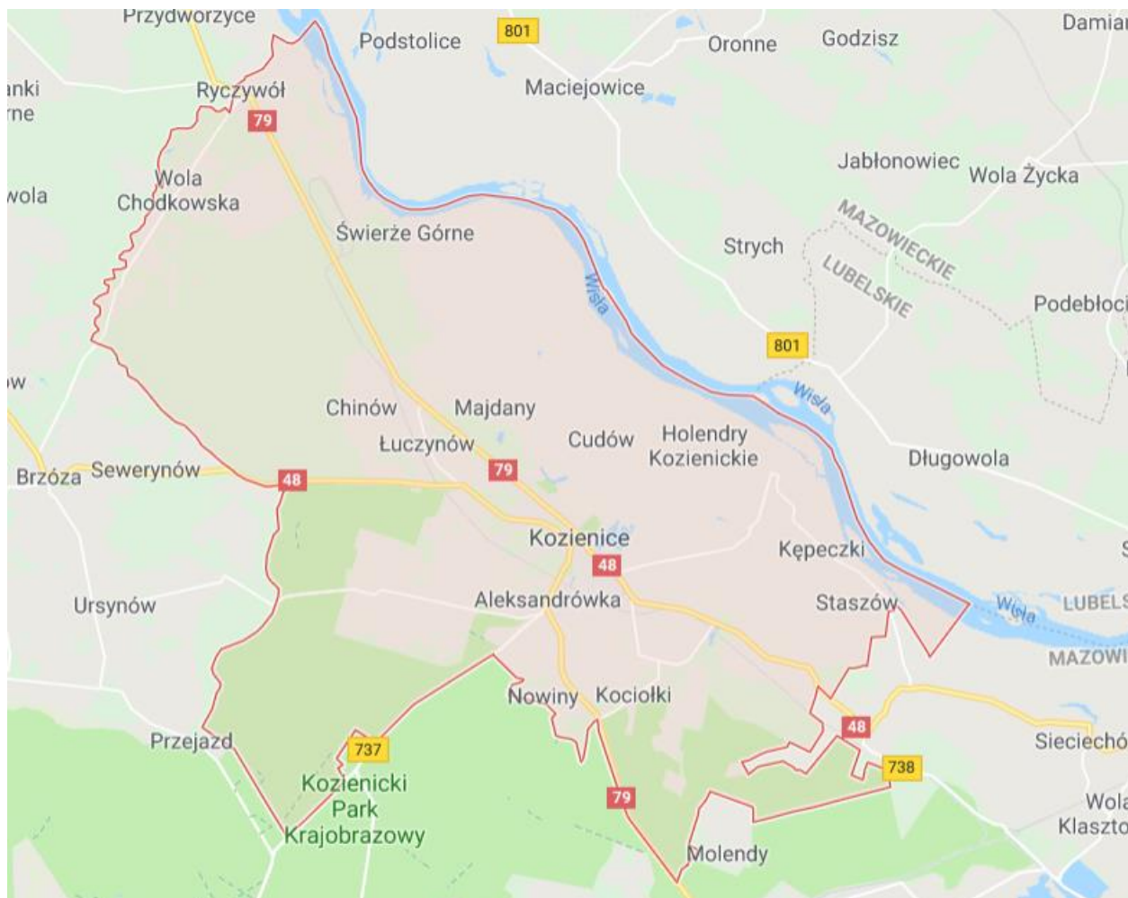
Rysunek 1. Granice gminy Kozienice.