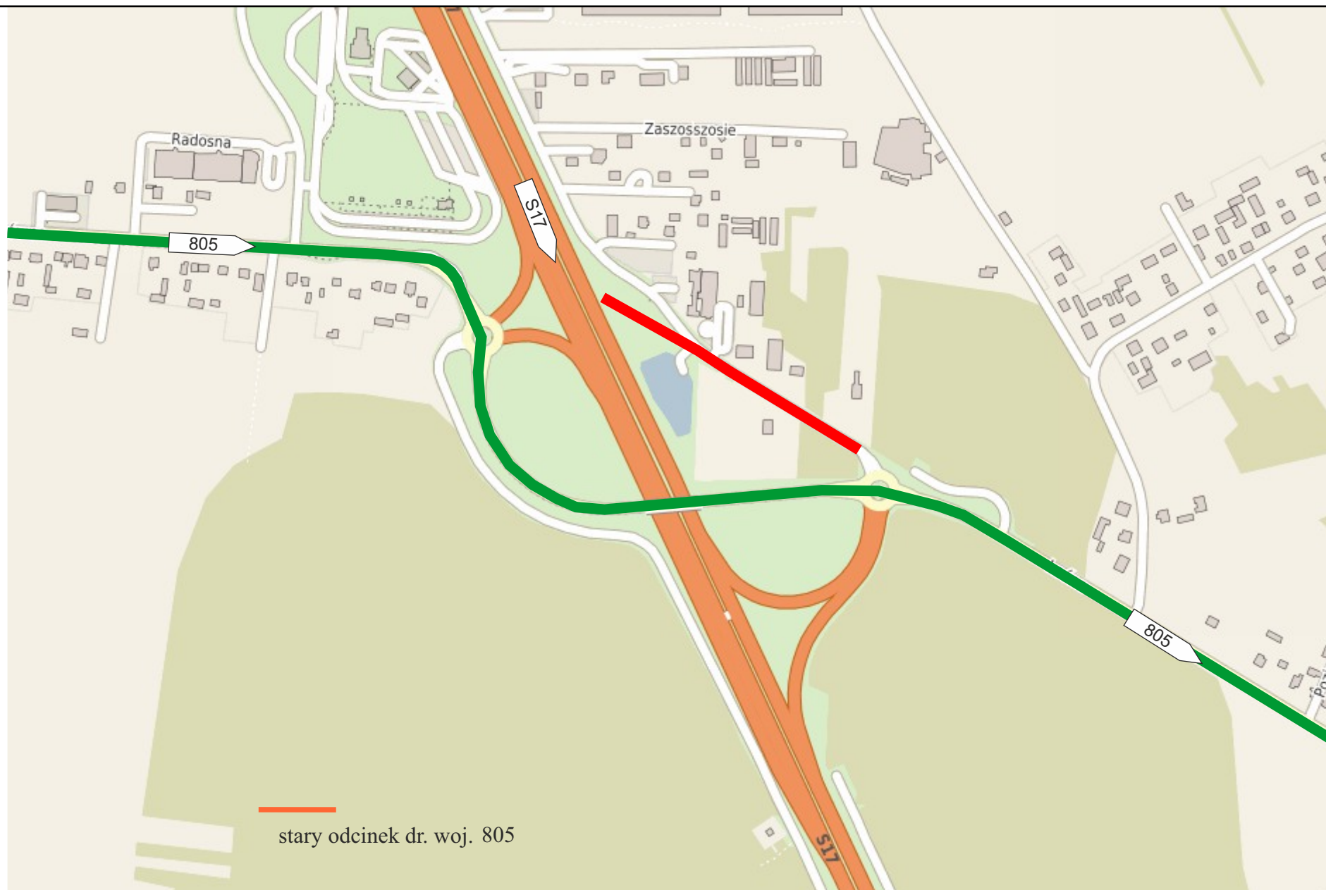
Załącznik mapowy nr 1 do Uchwały Nr LXII/341/2023 Rady Powiatu Garwolińskiego z dnia 26 maja 2023r.