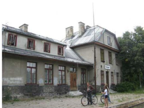
Grójecka Kolejka Dojazdowa – przestrzenny układ komunikacyjny Grójec ul. Przedstacyjna