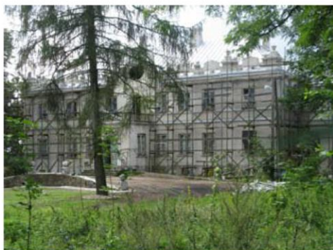
Zespół pałacowy w Głuchowie