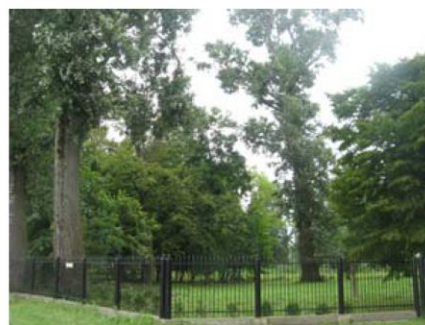
Park w Falęcinie