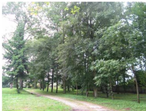
Park w Kobylinie