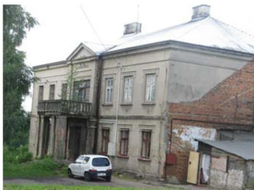
Pałac w Woli Worowskiej