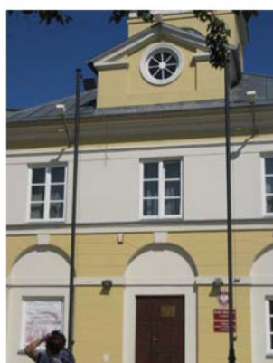
Ratusz Grójec ul. Plac Wolności 1