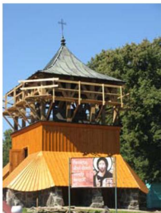
Dzwonnica przy kościół p.w. Mikołaja Biskupa Grójec ul. Worowska 1