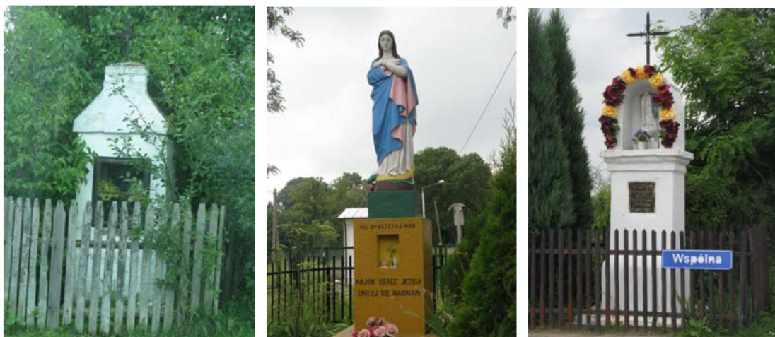
Kapliczki w: Gościeńczech, Kociszewie i Mirowicach.

Stan zachowania kapliczek jest ogólnie dobry, wymaga jednak zabiegów konserwatorskich. Wiele z tych obiektów zostało odremontowanych dzięki staraniu i środkom mieszkańców lub staraniom gminy czy sołectwa (niektóre obiekty zostały poddane gruntowemu remontowi i odbudowane w całości). Porządkowaniem i dekorowaniem kapliczek zajmują się najczęściej mieszkańcy poszczególnych miejscowości, częste są przypadki ozdabiania kolorowymi wstęgami lub wieńcami ze sztucznych kwiatów.