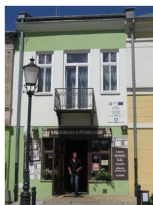
Budynek mieszkalny Grójec ul. Plac Wolności 2