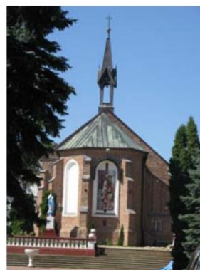
Kościół p.w. Mikołaja Biskupa Grójec ul. Worowska 1