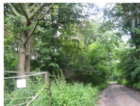
Park w Mirowicach