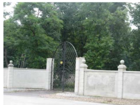
Park w Głuchowie