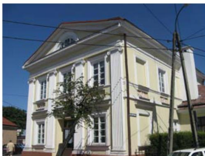
Szkoła Podstawowa nr 3 Grójec ul. Armii Krajowej 34