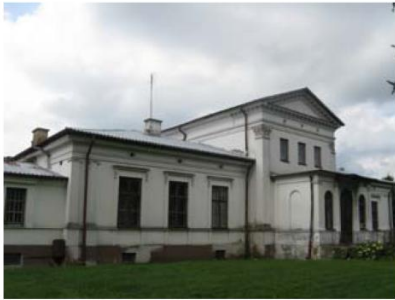
Dwór w Zalesiu