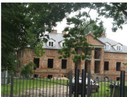
Pałac w Falęcinie