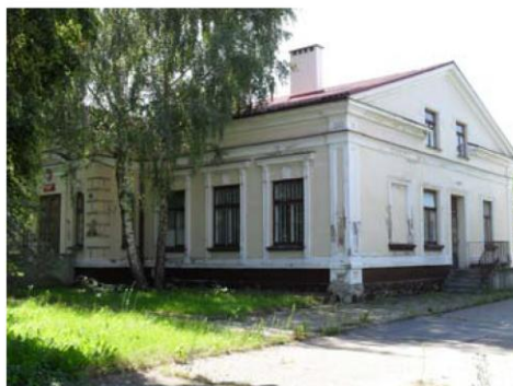
Dom Grójec ul. Niepodległości 20