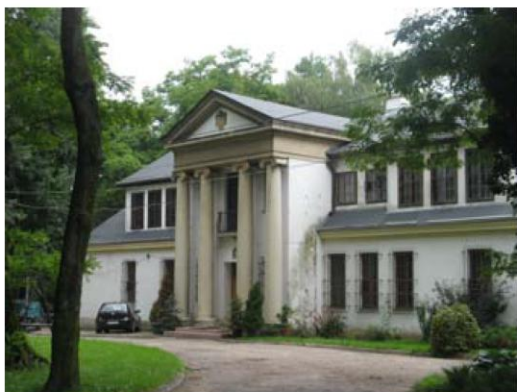
Dwór w Kociszewie