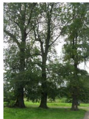
Park w Pabierowicach