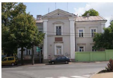
Szpital Grójec ul. Piotra Skargi 10