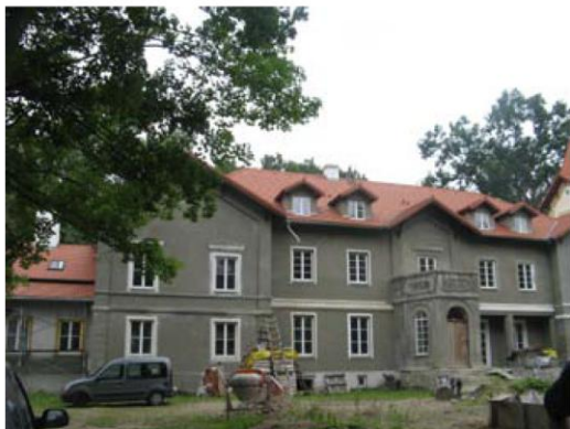
Dwór w Kobylinie