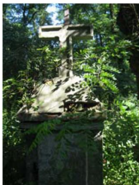
Cmentarz ewangelicki Grójec ul. Mogielnicka