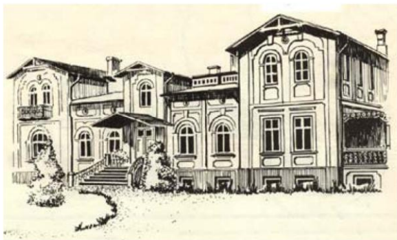
Dwór w Krobowie