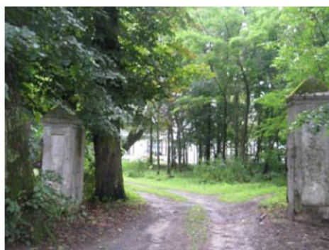
Park w Gościeńcach