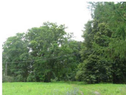
Park w Lesznowoli