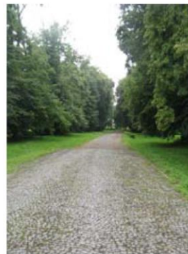
Park w Krobowie