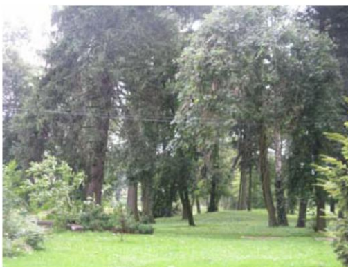
Park w Kociszewie