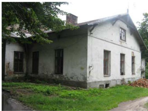
Dwór w Lesznowoli