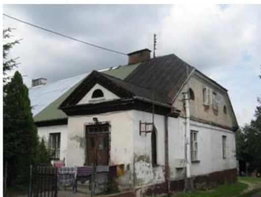
Dwór w Pabierowicach