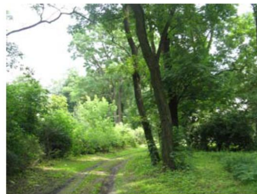
Park przy dworze w Uleńcu