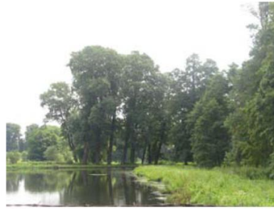
Park w Zalesiu

Karty poszczególnych obiektów znajdujących się w Rejestrze Zabytków Województwa Mazowieckiego znajdują się w Gminnej Ewidencji Zabytków dla Gminy i Miasta Grójec, która stanowi nieodłączny załącznik i podstawę sporządzenia niniejszego opracowania.