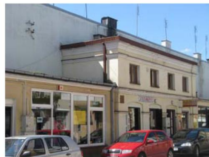
Jatki Grójec ul. Jatkowa