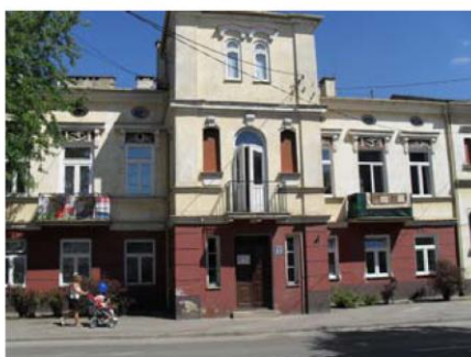
Budynek mieszkalny Grójec ul. Piłsudskiego 11