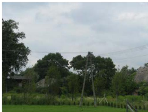
Park w Kośminie