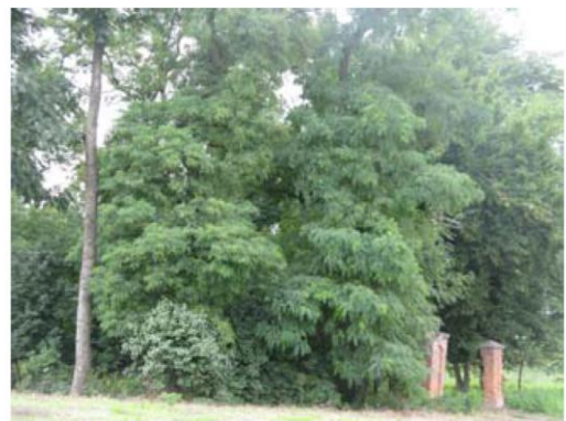
Park w Skurowie