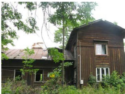
Dawny dwór Ciechan w Kośminie