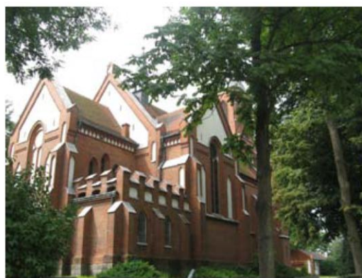
Kościół parafialny w Worowie