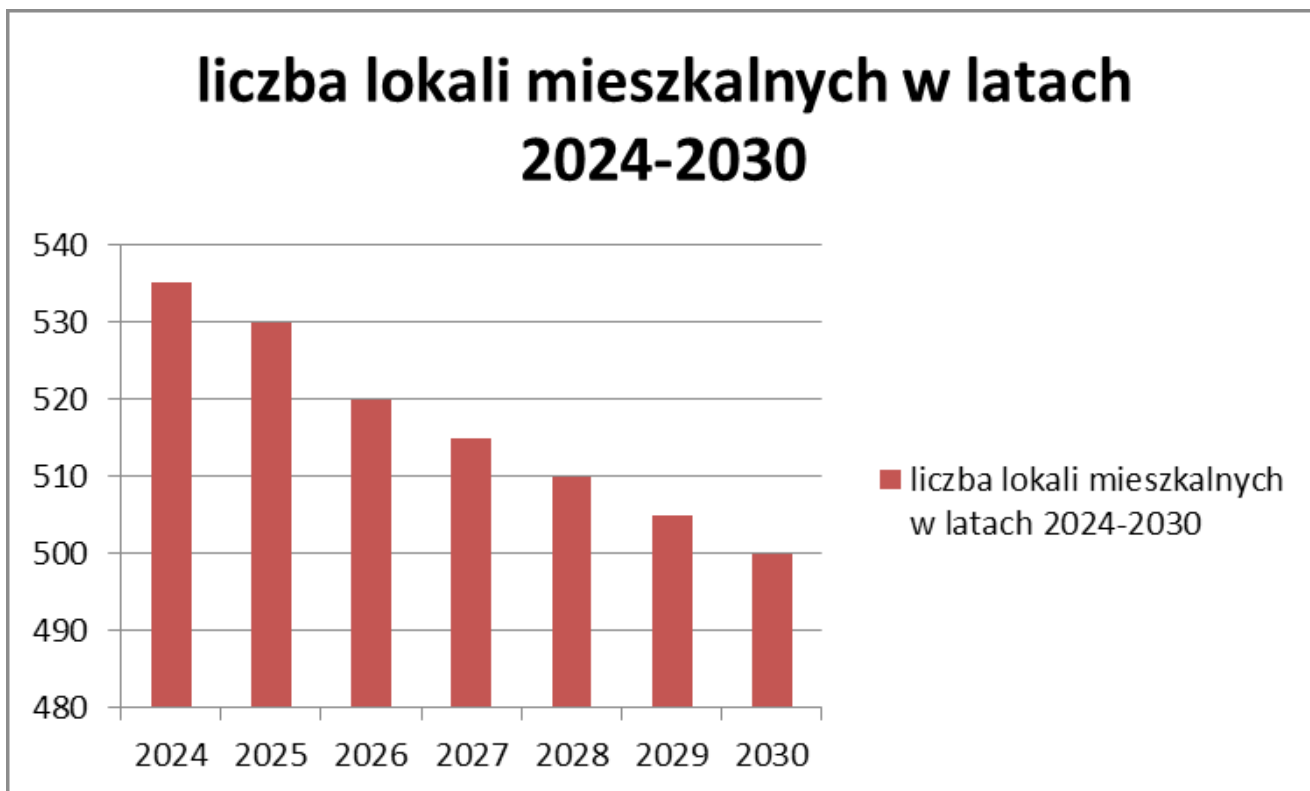
Wykres nr 2 - prognoza wielkości mieszkaniowego zasobu Gminy Tuszyń na dzień 30.09.2023 r.