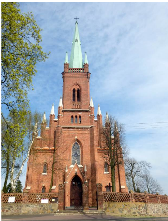
Zdjęcie nr 6. Kościół pw. św. Stanisława Biskupa i św. Mikołaja Biskupa w Borszewicach

Kościół pw. św. Stanisława Biskupa i św. Mikołaja Biskupa w Borszewicach , usytuowany na owalnym cmentarzu przykościelnym, ogrodzonym kamiennym murem zwieńczonym ażurowym parkanem z cegły. Kościół neogotycki, wzniesiony w latach 1894-1902 wg projektu Kornela Szretera. W latach 1924-1925 dobudowano wieżę o wysokości 25 m, cztery niższe wieżyczki połączone attyką oraz hełm zwieńczony krzyżem. W zespole kościoła znajduje się dzwonnica z pocz. XX w., organistówka z 1914 r. i plebania z 4 ćw. XIX w.