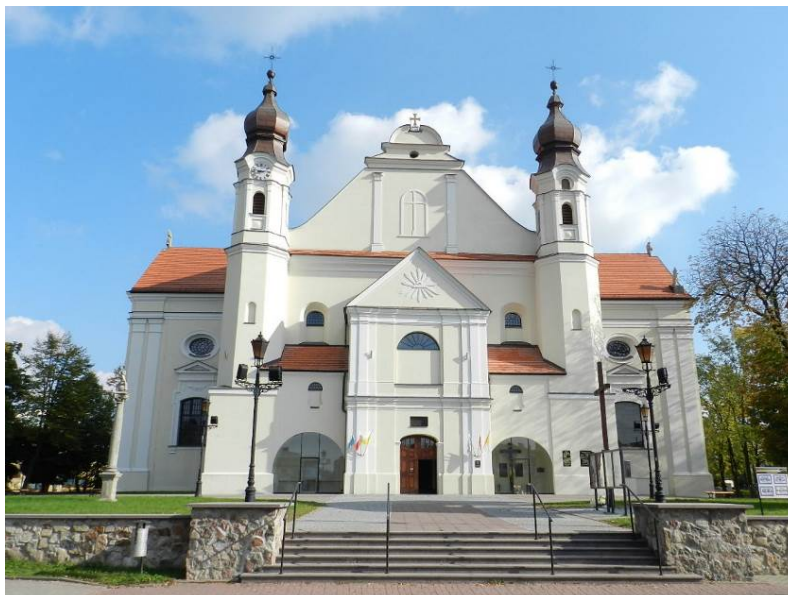
Zdjęcie nr 4. Kościół kolegiacki pw. Niepokalanego Poczęcia Najświętszej Maryi Panny i św. Michała Archanioła w Łasku

Kościół kolegiacki pw. Niepokalanego Poczęcia Najświętszej Maryi Panny i św. Michała Archanioła w Łasku , późnogotycki, wzniesiony w latach 1517-1523, przebudowany po 1749 r. W zespole kościoła znajduje się dzwonnica i zlikwidowany cmentarz przykościelny, otoczony niskim, kamiennym nurem, zagospodarowany ścieżkami i zielenią. Obiekt jest jedną z najbardziej okazałych późnogotyckich świątyń województwa łódzkiego, równocześnie jest Sanktuarium Maryjnym.