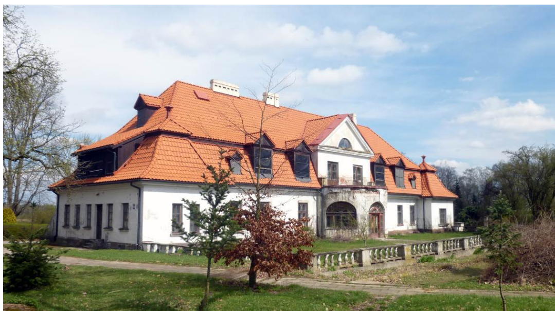
Zdjęcie nr 1. Dwór w Ostrowie