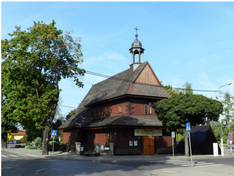
Zdjęcie nr 5. Kościół pw. Świętego Ducha w Łasku

Kościół pw. Świętego Ducha w Łasku , ob. garnizonowy, barokowy, jeden z najcenniejszych obiektów zabytkowych województwa łódzkiego. Średniowieczny kościół, zbudowany w 1495 r. w sąsiedztwie szpitala (przytułek), spłonął w 1665 r. Obecny, modrzewiowy wzniesiono 1666 r., w 1810 r. został przekazany ewangelikom - do 1979 r. W latach 1990-1997 poddany kapitalnemu remontowi. Teren przykościelny współcześnie zagospodarowany, ogrodzony w 1936 r. Na cmentarzu drewniana dzwonnica z 1895 r. - na planie prostokąta, oszalowana w dolnej części, kryta dachem dwuspadowym.