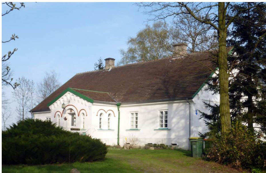
Zdjęcie nr 2. Dwór w Woli Bałuckiej

Dwór w Woli Bałuckiej pochodzi z ok. 1840 r., wykupiony w 1981 r. i wyremontowany przez prywatnego właściciela. Usytuowany w relikcie parku z zachowanym starodrzewem. Po 1945 r. budynki gospodarcze zostały rozebrane, dwór popadał w ruinę.