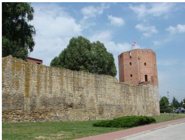
Mury miejskie z zespołem „Prochowni” i basztą „Męczarnia” w Wieluniu.