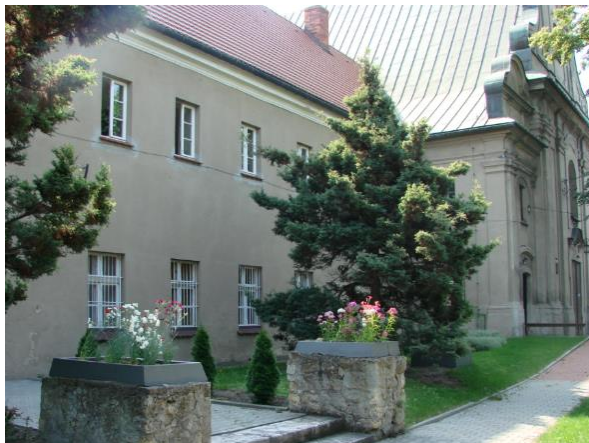
Klasztor poreformacki w Wieluniu.