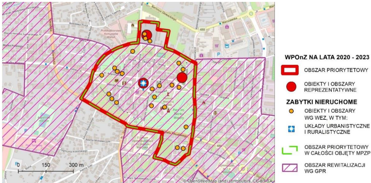
Ustalenia WPOnZ na lata 2020-2023 dla układu urbanistycznego Starego Miasta w Wieluniu.

Niniejszy Gminny Program Opieki nad Zabytkami Gminy Wieluń dla Miasta i Gminy Wieluń uwzględnia opisane powyżej dokumenty wyższego szczebla – krajowego i wojewódzkiego.