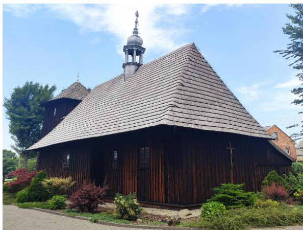
Kościół parafialny w Gaszynie.