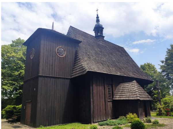
Kościół parafialny w Kadłubie.