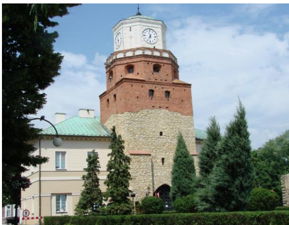
Brama Krakowska z ratuszem w Wieluniu.