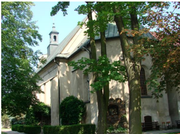
Kościół poreformacki w Wieluniu.

Reformaci bezpośrednio po przybyciu do Wielunia w 1629 r. rozpoczęli budowę kościoła, którą zakończyli w 1634 r. Klasztor budowano w latach 1637-1643. W czasie potopu szwedzkiego kompleks klasztorny został splądrowany. W 1662 r. w klasztorze rozpoczęło działalność wyższe seminarium duchowne. Kościół został częściowo przebudowany w XVIII w. Po wojnie część budynków klasztornych została przeznaczona na cele oświatowe, a od 1990 r. cały kompleks znów stanowi własność OO. Franciszkanów. Kościół w stylu barokowym posiada układ jednonawowy, o wydłużonym korpusie, z węższym prezbiterium zamkniętym trójbocznie, sklepienia kolebkowe z lunetami oraz Wyposażenie jednorodne stylowo, rokokowe. Od strony północnej przylega do niego budynek klasztoru w stylu barokowym z czterema skrzydłami w formie czworoboku, pomiędzy którymi zamknięty jest dziedziniec.