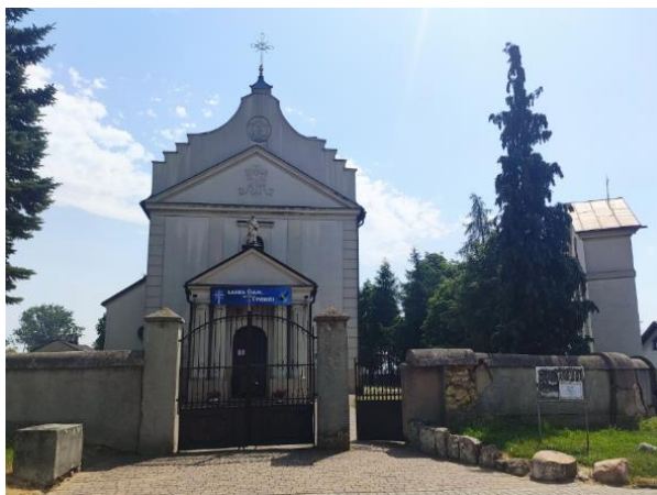
Kościół parafialny w Rudzie.

Najstarszy kościół na terenie gminy Wieluń, zbudowany na początku XII w. Usytuowany w centrum wsi, która w XII-XV w. posiadała prawa miejskie i była siedzibą kasztelanii. W 2 połowie XII w. został podniesiony do rangi kolegiaty, funkcję tę pełnił do 1419 r. Po 1420 r. nastąpiła gruntowna przebudowa świątyni, obejmująca przebudowę prezbiterium i podwyższenie ścian nawy. Obiekt szczególnie wartościowy pod względem historycznym.