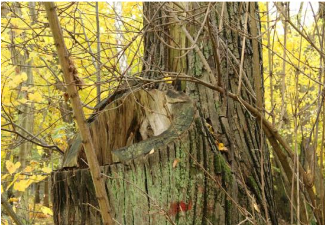
Ubytek po drugim przewodniku.