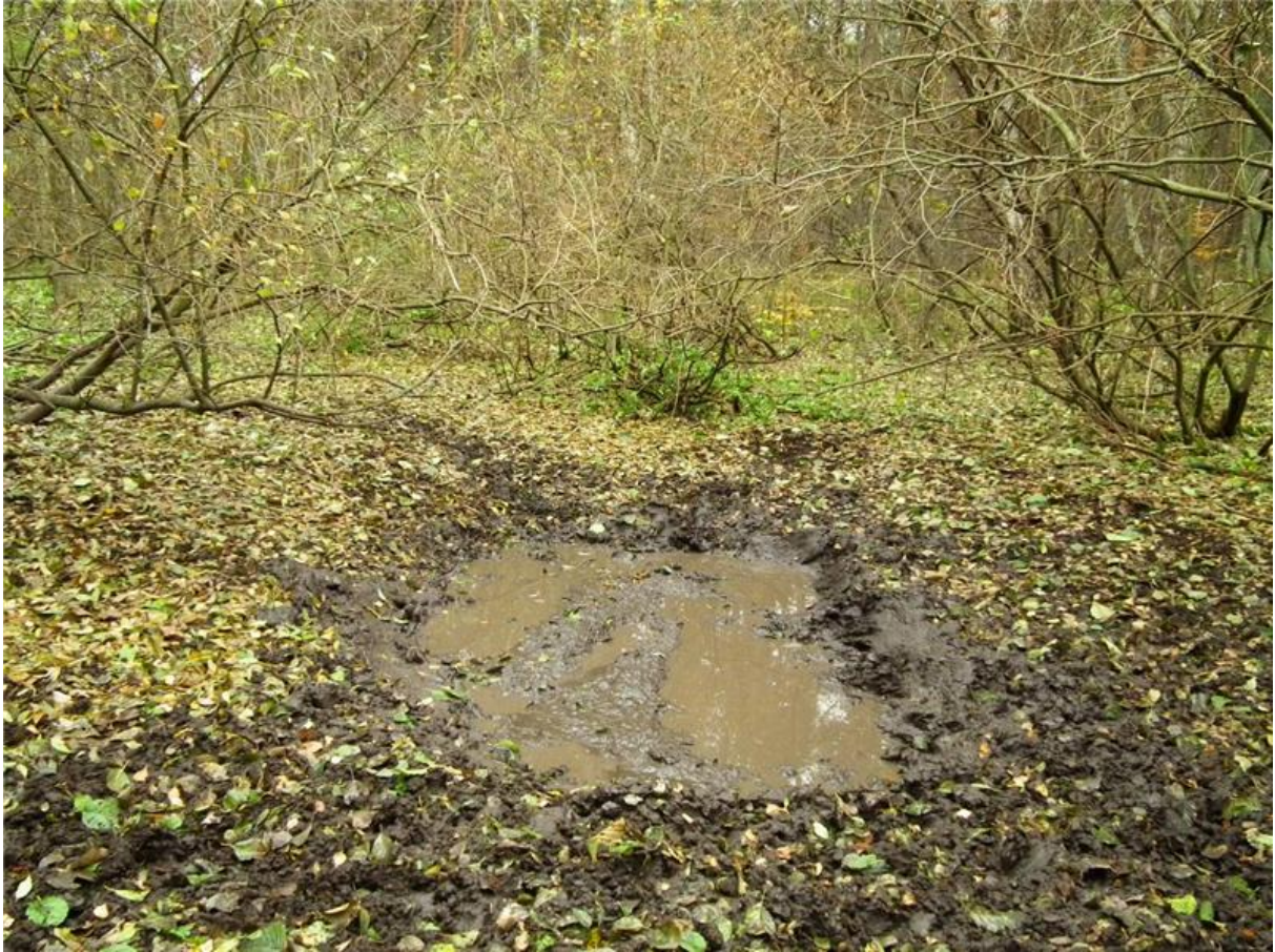
Fot. 4. Babrzysko wewnątrz zarosli wierbowych.