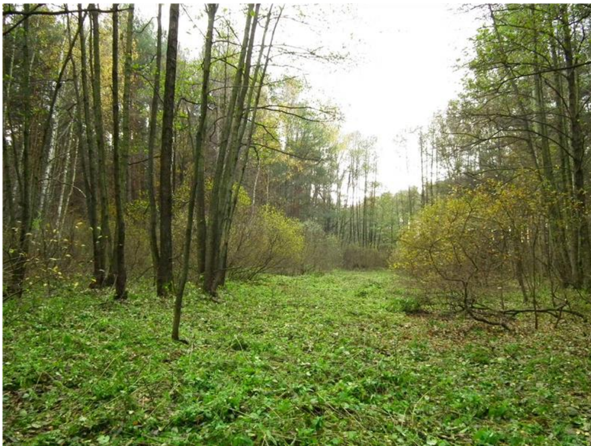
Fot. 2. Otwarta powierzchnia porośnięta zioloroślami z dominacją pokrzywy zwyczajnej, przytulii czepnej i śmiałka darniowego w południowej części użytku.