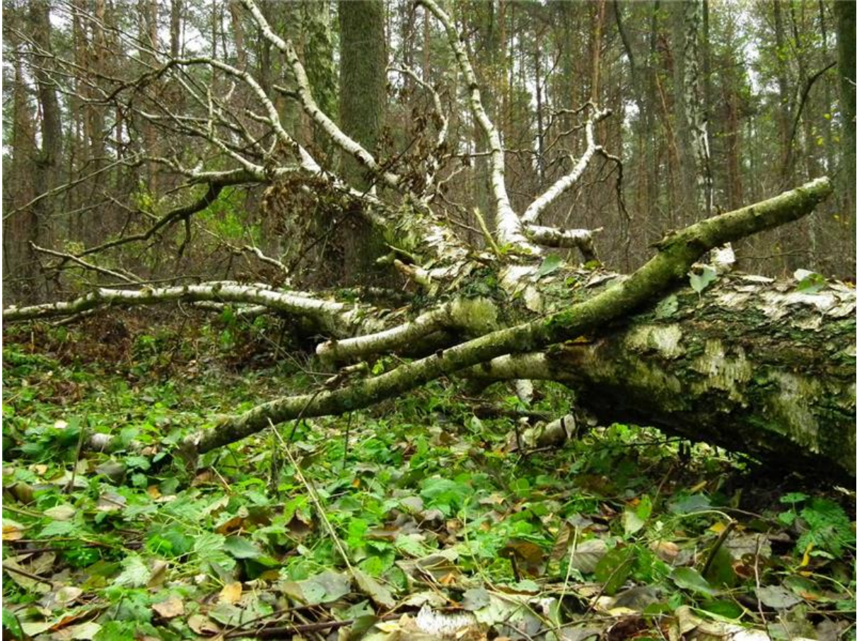
Fot. 3. Wykrot brzozowy na powierzchni użytku.