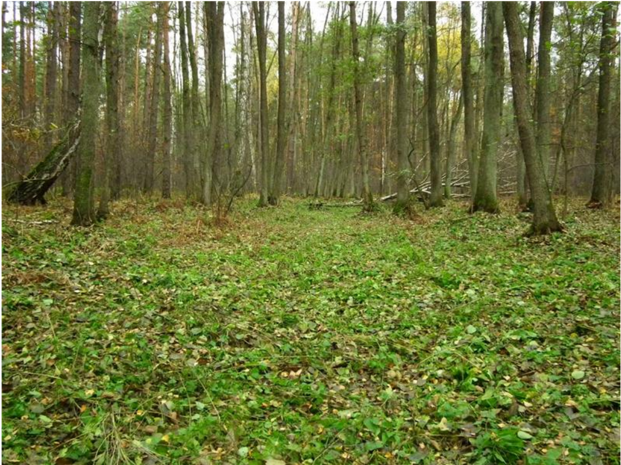
Fot. 1. Płat łągu olchowego z rozległą luką w drzewostanie w północnej części użytku.