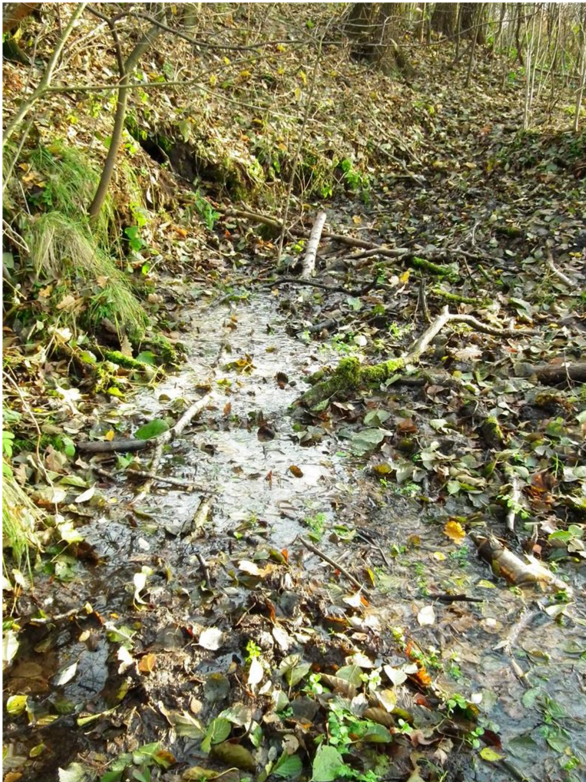
Fot. 2. Podstokowe źródło o dużej wydajności.