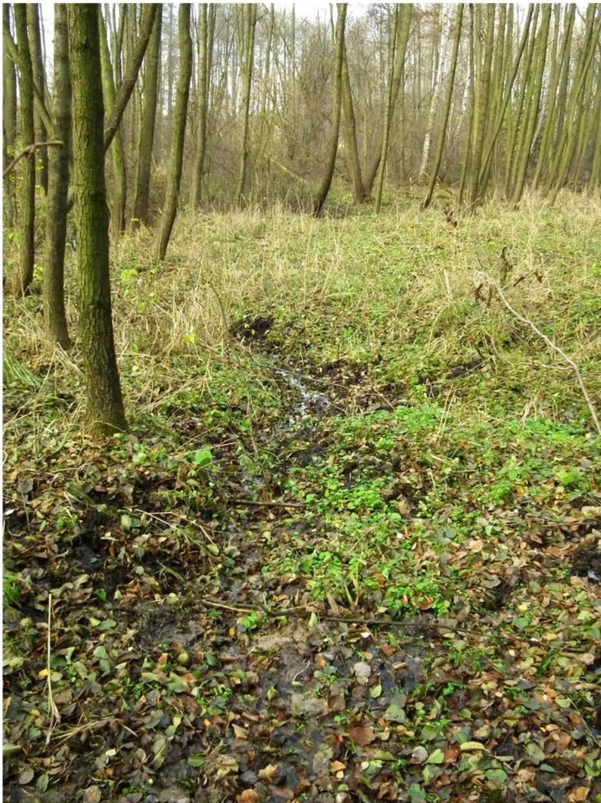
Fot. 3. Jeden z wysiękowych wypływów w obrębie użytku ekologicznego.