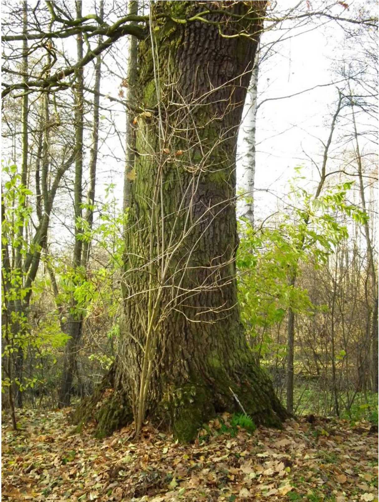
Fot. 4. Okazały dąb na krawędzi skarpy doliny.