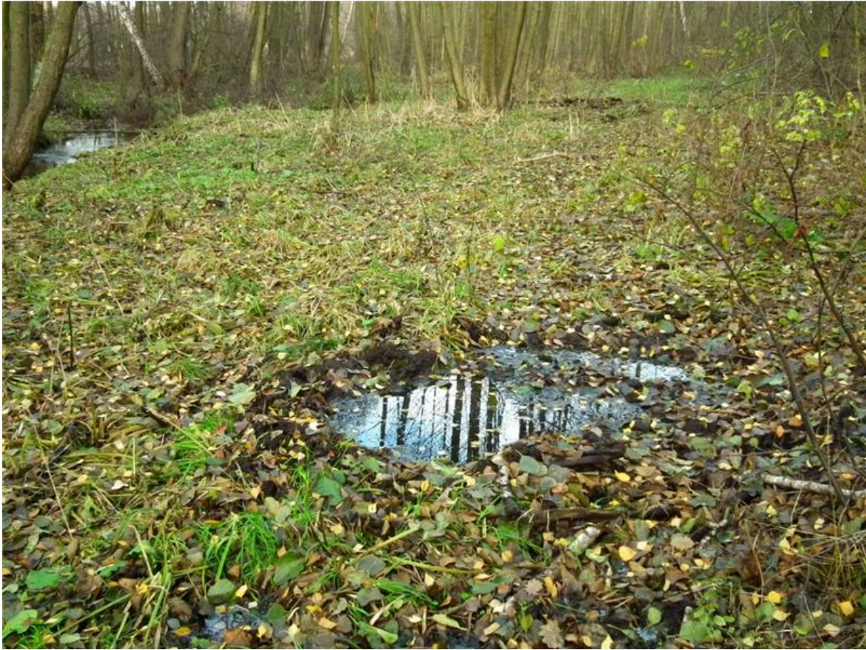
Fot. 1. Łęg i ziołorośla źródłiskowe w centralnej części użytku.