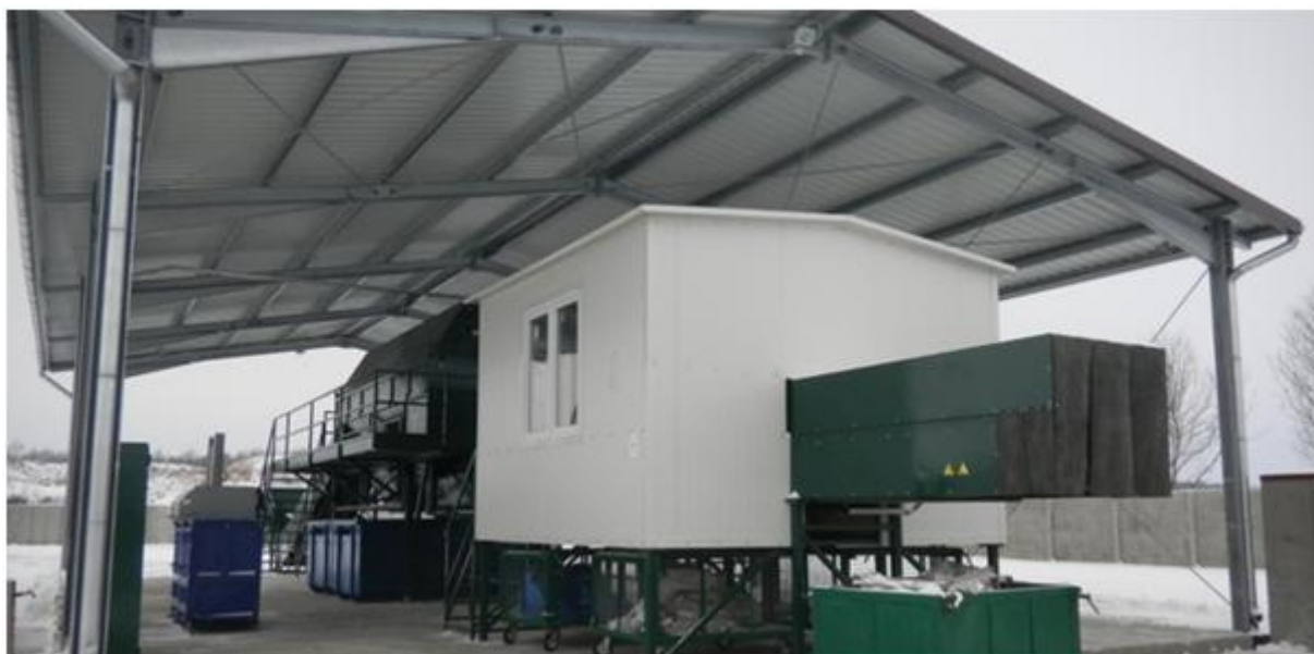
Rekultywacja składowisk odpadów

Linia do segregowania odpadów Zakładu Oczyszczania Miasta W. W. Dymek i J. Jagielski Sp.j. w Łowiczu