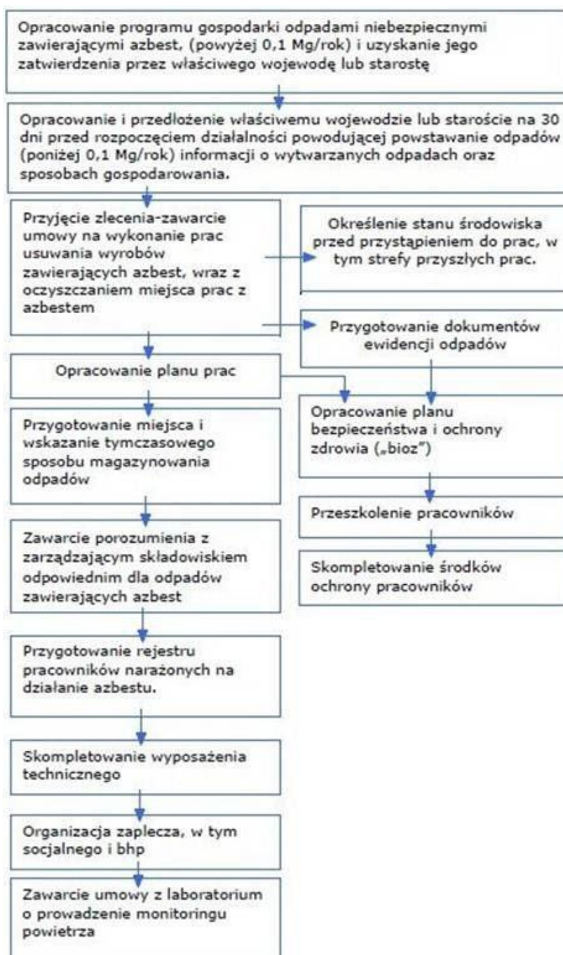
Rysunek 4. Schemat procedury dotyczącej postępowania przy pracach przygotowawczych do usuwania wyrobów zawierających azbest