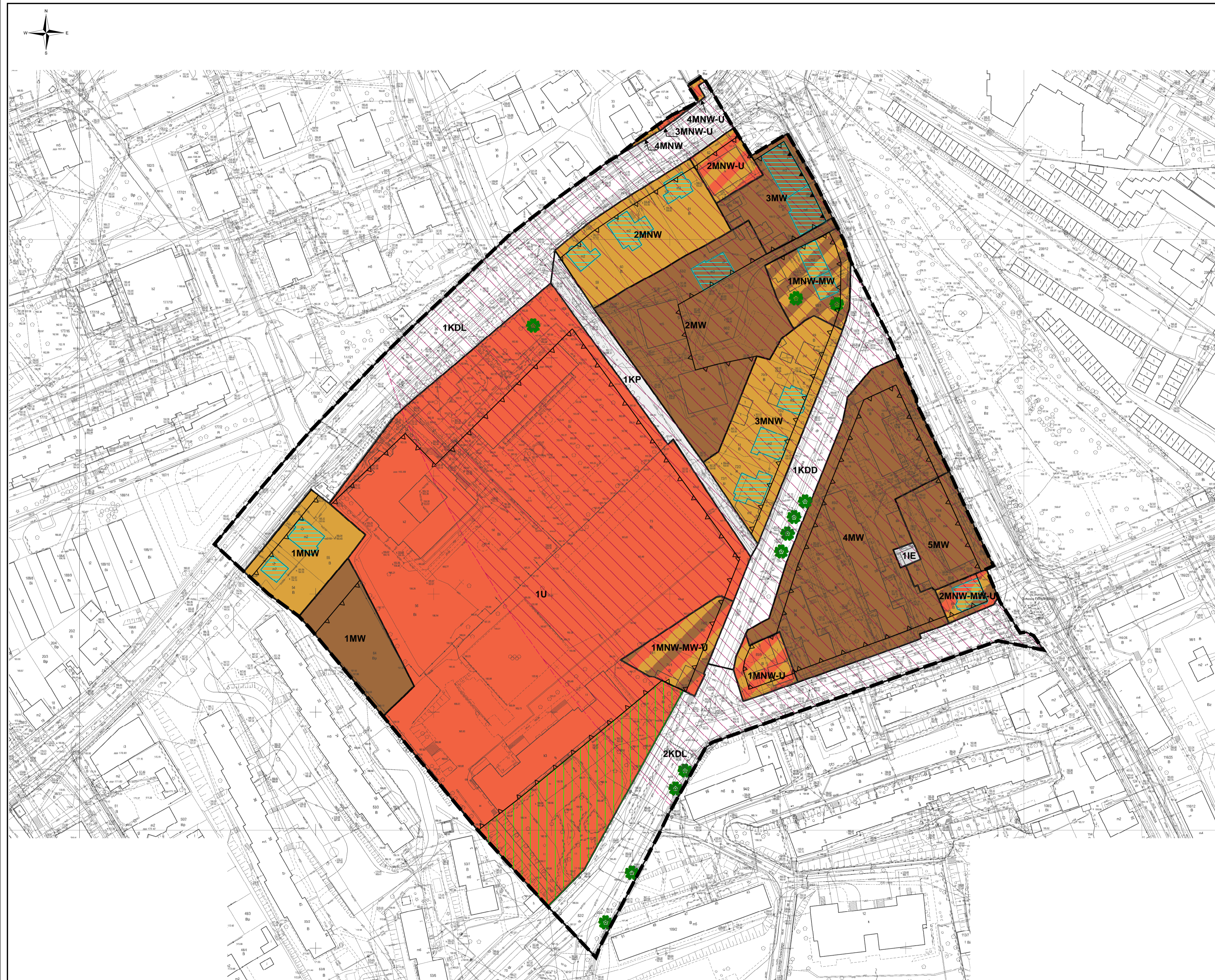
Wyrys ze Studium uwarunkowań i kierunków zagospodarowania przestrzennego miasta Zielona Góra