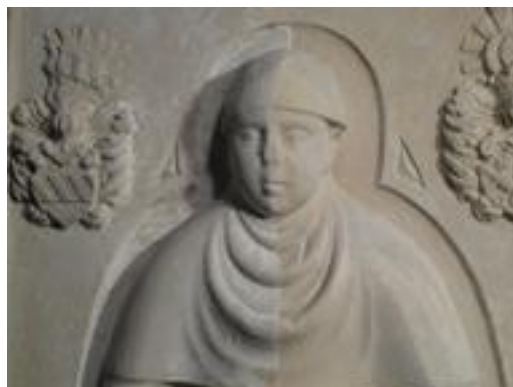
Płyta nagrobna dziecka (XVI w.) z kościoła p.w. Narodzenia NMP w Chotkowie w trakcie prac konserwatorskich 2016 r. (prace dofinansowano ze środków MKiDN)