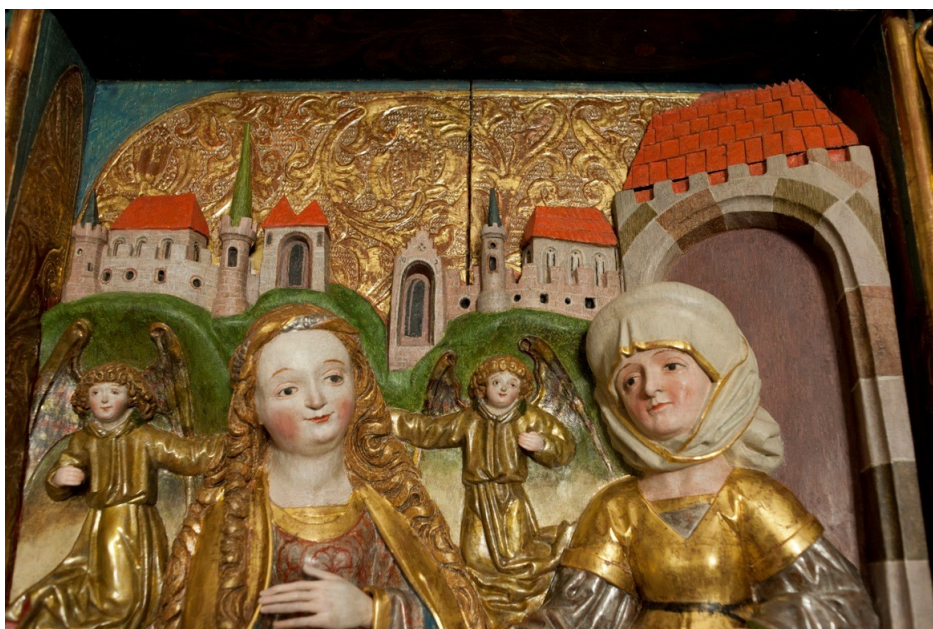
Fragment zachowanego skrzydła tryptyku Mistrza z Gościeszowic (XV w.) z kościoła parafialnego p.w. Narodzenia NMP w Chotkowie (po konserwacji - dotacja WLKZ), obecnie (tymczasowo) eksponowane w kościele parafialnym p.w. Marii Magdaleny w Brzeźnicy.