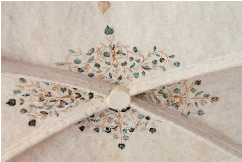
Fragment sklepienia prezbiterium kościoła parafialnego p.w. Narodzenia NMP w Chotkowie po pracach konserwatorskich wykonanych w 2016 r. – dotacja MKIDN

Witryna internetowa: www.powiatzaganski.pl .