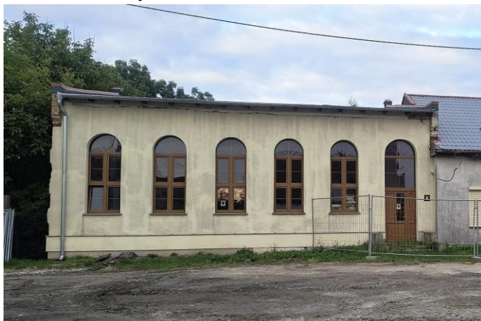
Zdjęcie nr 26. Dom Kultury w Jeszkowicach, ul. Główna 68a