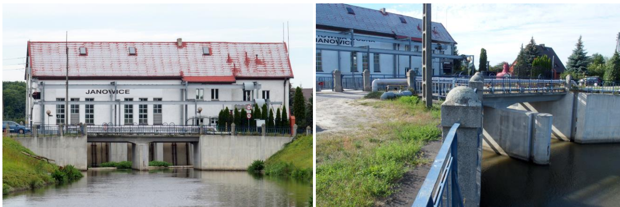
Zdjęcia nr 16, 17. Elektrownia wodna - stopień wodny „Janowice” i most drogowy nad służą w Jeszkowicach w zespole

– most drogowy w Gajkowie na Kanale Janowickim;