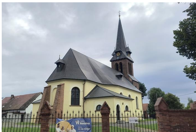
Zdjęcia nr 5, 6. Kościół pw. św. Wawrzyńca w Wojnowicach

Kościół orientowany, jednonawowy, na rzucie prostokąta z poligonalnie zamkniętym prezbiterium flankowanych parą niskich aneksów. Od wsch. dwie ceglane szkarpy. Ściany murowane, tynkowane. W elewacji zach. – murowana z cegły wieża na rzucie prostokąta, zwężonego w czwartej kondygnacji, nakryta dachem czterospadowym przechodzącym w stromy ostrosłup z niewielkimi lukarnami z tarczami zegarowymi – u nasady. Dachy kryte sztucznym łupkiem, okna zamknięte łukiem okrągłym, w wieży – otwory ostrołuczne i koliste tondo.