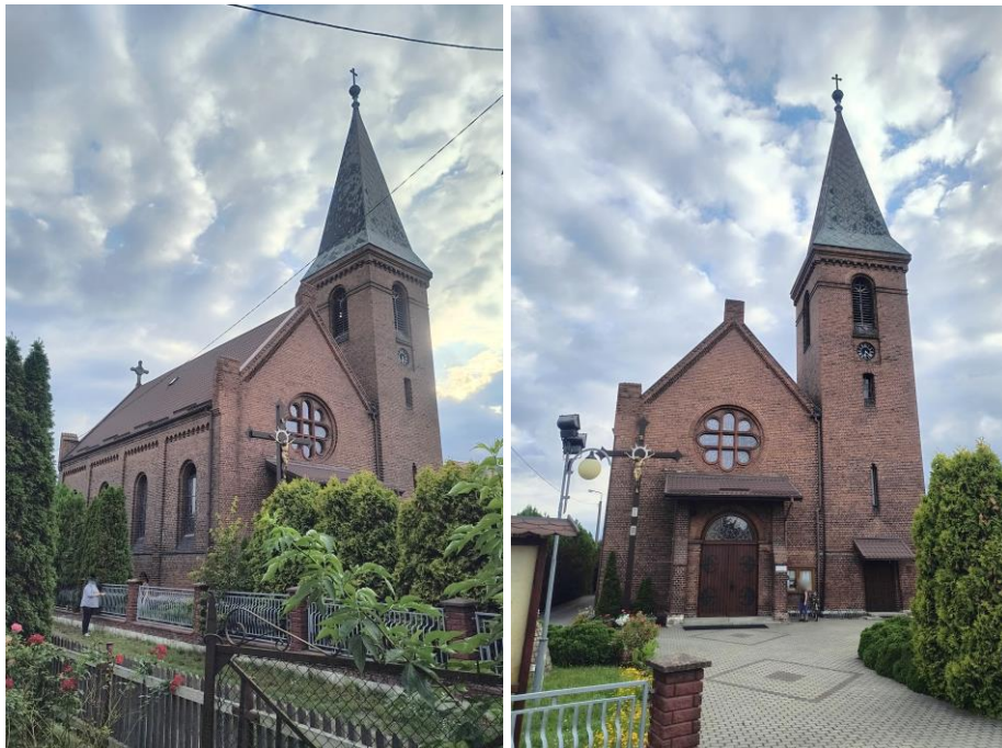
Zdjęcia nr 12, 13. Kościół pw. św. Antoniego, dawny ewangelicki w Ratowicach

Kościół pw. św. Antoniego, dawny ewangelicki w Ratowicach , zbudowany w 1894 r. wg projektu architekta Benna Kohlera, neoromański. Budowla z trójkondygnacyjną wieżą o wysokości 34 m. W środku są organy zbudowane ok. 1894 r. przez firmę Schlag & Söhne ze Świdnicy.