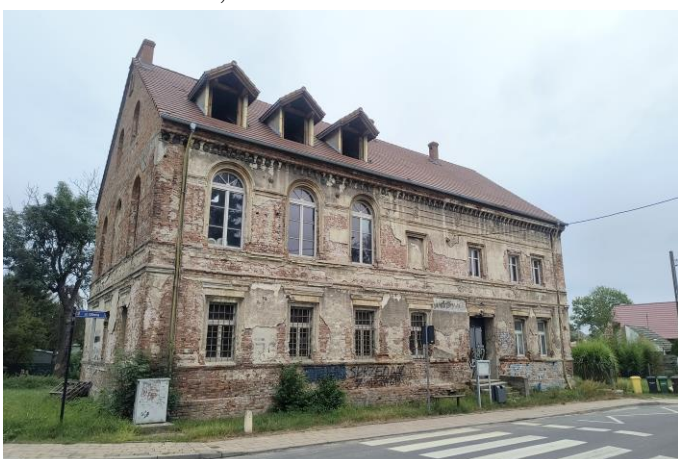
Zdjęcie nr 25. Dawny zajazd Jeltscha, ob. budynek nieużytkowany, Gajków, ul. Główna 50