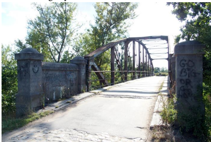
Zdjęcie nr 19. Most drogowy na kanale Janowickim w Kamieńcu Wrocławskim

– most drogowy na kanale Janowickim w Kamieńcu Wrocławskim.