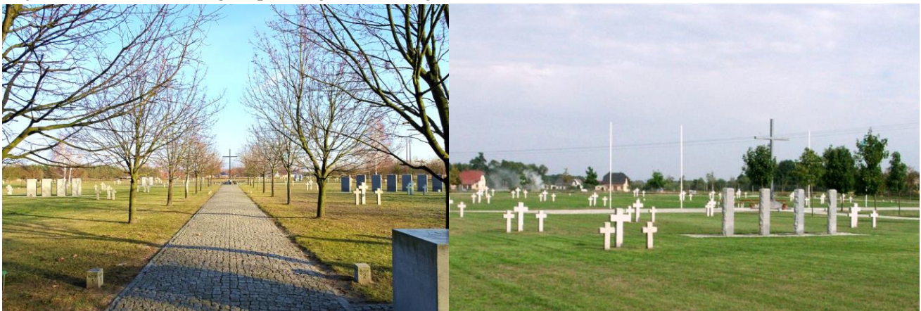
Zdjęcia nr 1, 2. Park Pokoju w Nadolicach Wielkich

W Nadolicach Wielkich znajduje się jedyny w Polsce i jeden z czterech w Europie niemiecki cmentarz wojenny i Park Pokoju. Jest to nekropolia żołnierzy niemieckich oficjalnie otwarta dnia 5 października 2002 r., celem wtórnego pochówku żołnierzy niemieckich czasów II wojny światowej ekshumowanych z terenów województw dolnośląskiego, opolskiego i lubuskiego.