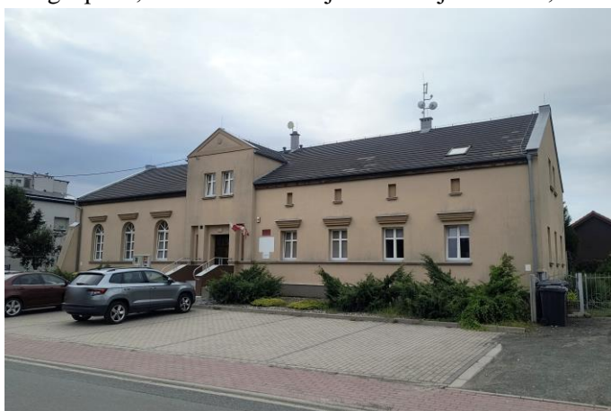
Zdjęcie nr 31. Gospoda, ob. świetlica wiejska w Wojnowicach, ul. Główna 41