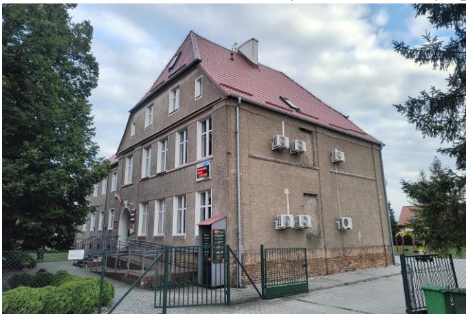
Zdjęcie nr 24. Szkoła Podstawowa, ob. Gminny Ośrodek Pomocy Społecznej w Czernicy, ul. Wrocławska 78