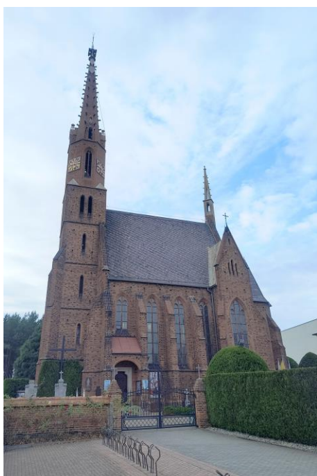
Zdjęcie nr 4. Kościół pw. Niepokalanego Poczęcia NMP w Chrzastawie Wielkiej