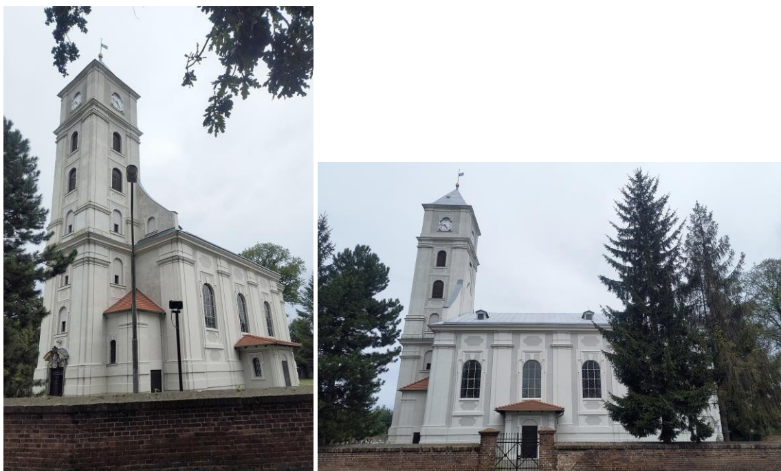
Zdjęcia nr 9, 10. Kościół pw. św. Małgorzaty w Gajkowie