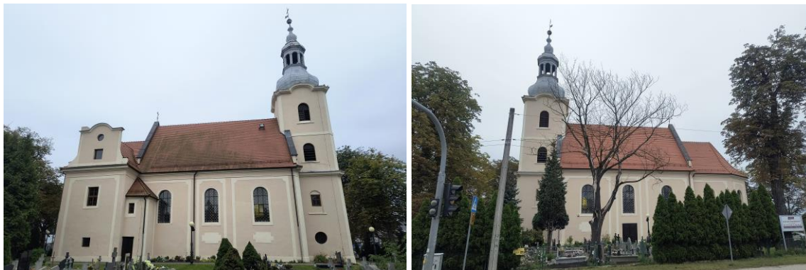
Zdjęcia nr 7, 8. Kościół pw. Narodzenia NMP w Dobrzykowicach