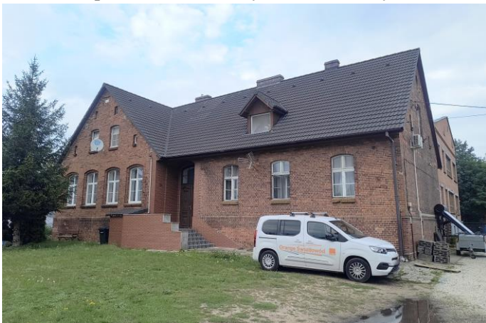
Zdjęcie nr 23. Szkoła parafialna, ob. budynek mieszkalny w Chrzastawie Wielkiej, ul. Wrocławska 15-17