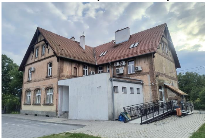
Zdjęcie nr 30. Szkoła, ob. Zakład Gospodarki Komunalnej w Ratowicach, ul. Wrocławska 111