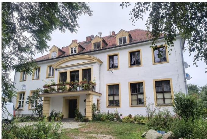
Zdjęcie nr 14. Pałac w zespole pałacowo-folwarcznym, ul. Stawowa 13-15-17 Nadolice Wielkie

Jedyną zachowaną rezydencją jest dwór w Nadolicach Wielkich – budynek murowany, tynkowany, na planie prostokąta, podpiwniczony, dwukondygnacyjny, nakryty dachem czterospadowym z lukarnami. Fasada (elewacja płd.) dziewięcioosiowa, z centralnym trzyosiowym ryzalitem, zaakcentowanym portykiem podtrzymującym balkon. Elewacje dworu remontowane: wokół otworów okiennych proste opaski w tynku.