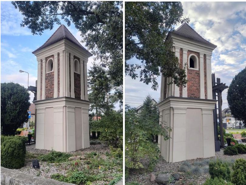
Zdjęcia nr 20, 21. dzwonnica pożarowa w Czernicy, ul. Wrocławska/Jana Pawła II