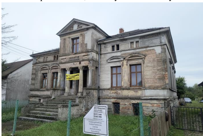
Zdjęcie nr 28. Szkoła podstawowa, ob. budynek mieszkalny w Nadolicach Wielkich, ul. Wrocławska 67