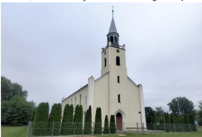
Zdjęcie nr 11. Kościół pw. MB Różańcowej w Nadolicach Wielkich

Kościół pw. MB Różańcowej w Nadolicach Wielkich , wcześniej ewangelicki, wzniesiony w latach 1847-1849, wg projektu inspektora budowlanego Zahna, neoromański. W 1862 r. zakończono przebudowę kościoła, w czasie której dostawiono do niego wieżę.