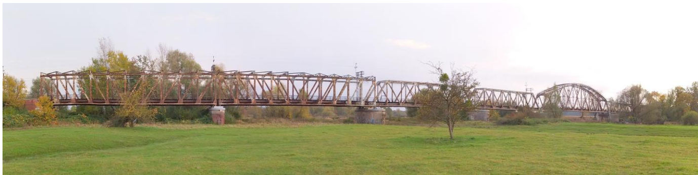
Zdjęcie nr 15. Most kolejowy w Czernicy

Budynki dworców pochodzą z końca pierwszej dekady XX w. i prezentują się dość jednorodnie; parterowe, nakryte wysokimi naczółkowymi dachami, z aneksami, o malowniczej bryle.