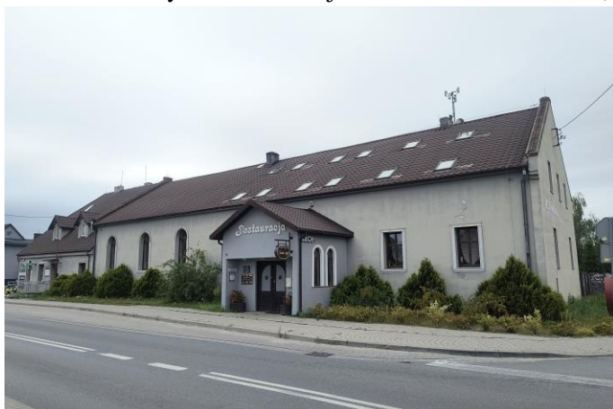
Zdjęcie nr 27. Dom ludowy, ob. restauracja w Nadolicach Wielkich, ul. Wrocławska 64