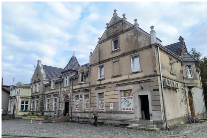
Zdjęcie nr 29. Gospoda, ob. budynek mieszkalno-usługowy (biblioteka, świetlica, sklep) w Ratowicach ul. Wrocławska 50, 52, 52a