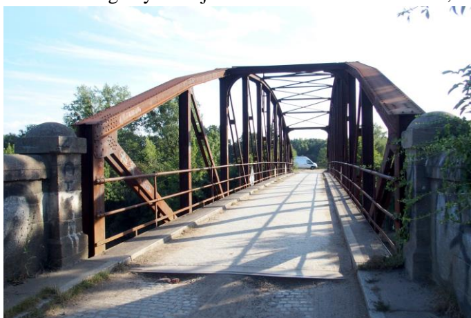
Zdjęcie nr 18. Most drogowy w Gajkowie na Kanale Janowickim

– most drogowy w Gajkowie na Kanale Janowickim;