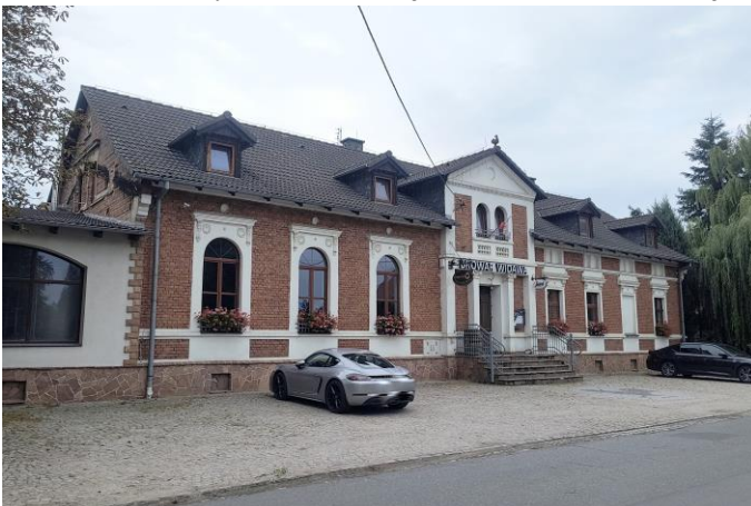
Zdjęcie nr 22. Dom Ludowy, ob. restauracja w Chrzastawie Małej, ul. Wrocławska 97