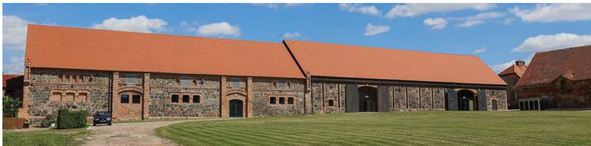
Zdjęcie nr 8. Stodoła i obora, ul. Obiszowska 4A w Jerzmanowej, ob. „Stodoła kultury” – świetlica wiejska

z czytelną, siedziby stowarzyszeń. W parku, w ramach kilku etapów prac, oczyszczono stawy wraz z systemem wodnym, utwardzono ścieżki spacerowe, wykonano małą architekturę, zainstalowano lampy, ławeczki. Wytyczono i oznakowano Przyrodniczą Ścieżkę Edukacyjną.