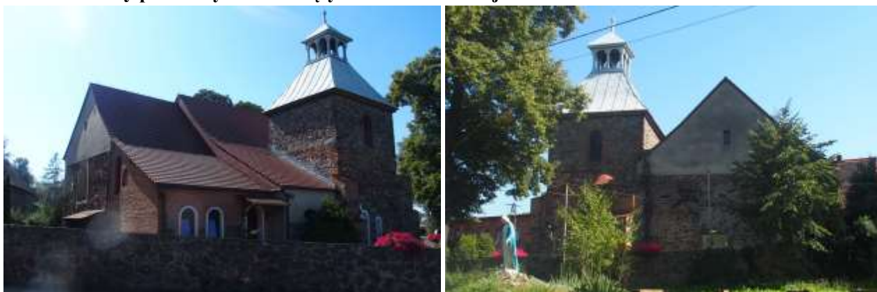
Zdjęcia nr 4, 5. Kościół filialny pw. Wszystkich Świętych w Jerzmanowej

Kościół wzmiankowany jest w źródłach w 1376 r. Obecna budowla pochodzi z końca XV w., nosi cechy architektury gotyckiej; wieża dobudowana została w pocz. XVI w. Podczas reformacji w połowie XVI w. kościół przeszedł w ręce ewangelików, w 1654 r. został zwrócony katolikom.