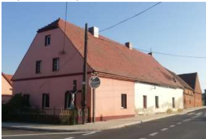
Zdjęcie nr 14. Budynek mieszkalny w Kurowicach (nr 17)

Budynek powstały w 1833 r., parterowy z niewyodrębnioną ścianką kolankową, nakryty dachem dwuspadowym z naczółkiem, kryty dachówką ceramiczną. Ściany murowane, tynkowane, detal architektoniczny wykonany w tynku: gzyms wieńczący. Otwory okienne prostokątne o lekko zróżnicowanych proporcjach.