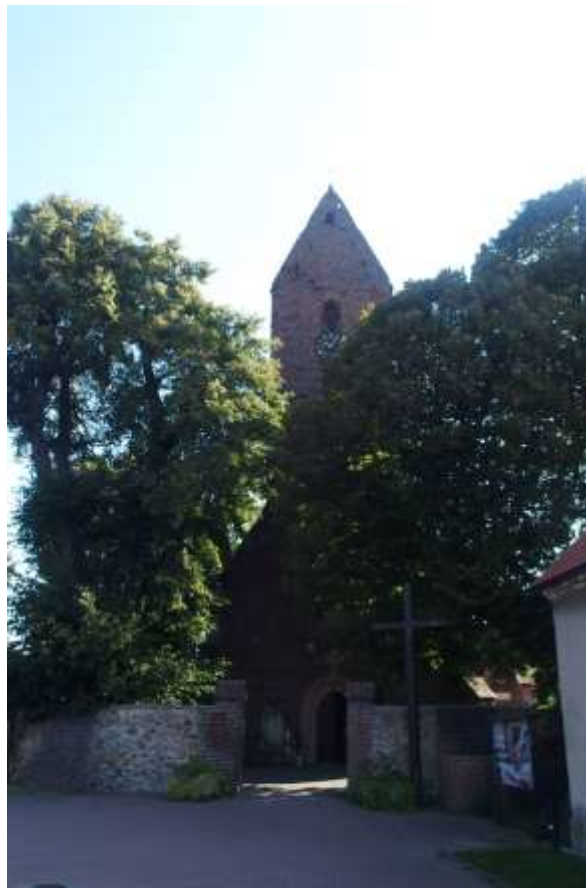
Zdjęcia nr 1, 2. Kościół parafialny pw. św. Szymona i Judy Tadeusza w Jaczowie

Kościół wzmiankowany w 1291 r., wzniesiony w XIII w., rozbudowany w XIV i XV w., powiększony o kruchtę południową w początkach XVI w. Budynek orientowany, murowany z cegły i kamienia – w dolnych partiach ścian prezbiterium, jednonawowy, z węższym prezbiterium na rzucie prostokąta i wieżą w fasadzie, nakrytą dwuspadowo. Na wieży – dzwon z 1860 r., pochodzący z innego kościoła. Wnętrze nawy nakryte jest sklepieniem sieciowym w formie okrągłolucznej w przekroju kolebki z lunetami, pokrytej potrójnym duktem żeber.