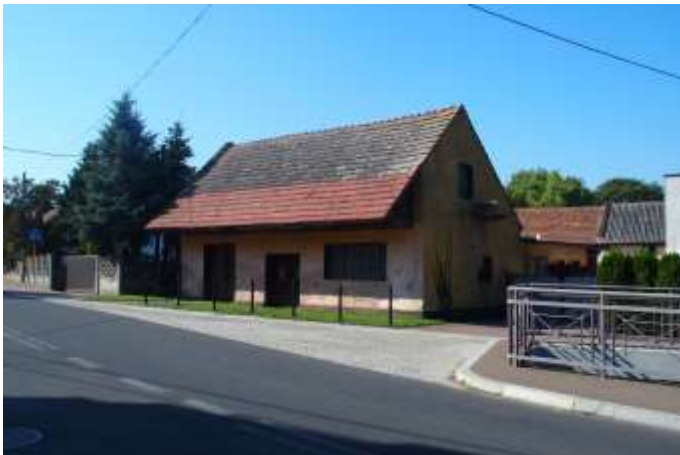
Zdjęcie nr 10. Kuźnia w Jaczowie (ul. Główna przy nr 39)

Obiekt pochodzi z XVIII w. To budynek jednokondygnacyjny, kryty dachem dwuspadowym pokrytym dachówką ceramiczną. Ściany murowane, tynkowane, detal architektoniczny wykonany w tynku: gzyms cokołowy. Budynek w średnim stanie technicznym: uszkodzone i przebarwione tynki, niewielkie uszkodzenie pokrycia dachu.