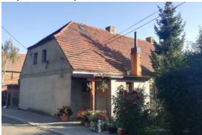
Zdjęcie nr 13. Budynek mieszkalny w Kurowicach (nr 12)

Budynek z 1836 r. jednokondygnacyjny, nakryty dachem naczółkowym krytym dachówką ceramiczną. W narożu elewacji frontowe – wtórny ganek nakryty dachem pulpitowym. Ściany murowane, tynkowane, detal architektoniczny wykonany w tynku: gzyms wieńczący. Otwory okienne prostokątne o zróżnicowanych proporcjach.