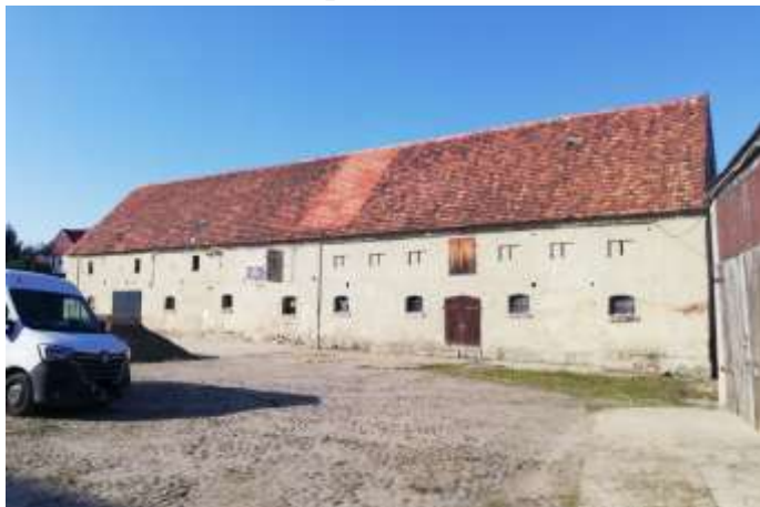
Zdjęcie nr 12. Obora w Kurowicach (przy nr 7)

Wzniesiona w poł. XIX w. Budynek jednokondygnacyjny, podwyższony o ściankę kolankową, nakryty dachem dwuspadowym pokrytym dachówką ceramiczną. Ściany murowane, tynkowane, detal architektoniczny wykonany w tynku: gzyms wieńczący i cokołowy, lizeny, blendy. Budynek w stanie średnim, użytkowany; lekko uszkodzone i przebarwione tynki; niekompletne szklenie okien, wymiana jednych wrót – bez nawiązania do historycznego kształtu i konstrukcji.