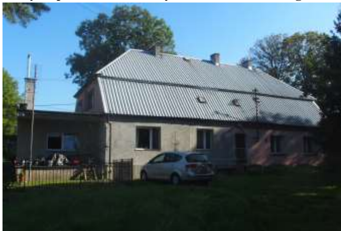
Zdjęcie nr 16. Oficyna pałacowa – relikty założenia dworskiego z folwarkiem w Potoczku

Parterowy na rzucie prostokąta, nakryty dachem naczółkowym łamanym (albo dwuspadowym łamanym z naczółkami), z facjatką na osi połączenia frontowej. Ściany murowane, tynkowane. Otwory okien i drzwi prostokątne. W elewacji bocznej rozległa dobudówka. Dach kryty blachą trapezową. Stolarka okien wtórna, bez nawiązania do historycznych podziałów: w szczycie – oryginalna. Stan techniczny budynku dobry: wymiana tynków, stolarki, pokrycia dachu. Zachowana bryła budynku, zmiana rozmieszczenia i kształtu otworów okiennych, wymiana stolarki.