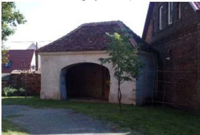
Zdjęcie nr 3. Kostnica w Jaczowie (przy kościele)

Kostnica – mauzoleum zlokalizowana na wsch. od kościoła przy murze cmentarnym, pochodzi z 2 poł. XVIII w. Budowla na planie prostokąta, nakryta wysokim, czterosпадowym dachem, z obszernym otworem bramnym zamkniętym odcinkiem łuku – w fasadzie. Zbudowana z cegły, tynkowana. Obiekt cechuje się w miarę dobrym stanem zachowania; wynika z renowacji jaka została wykonana w ramach współpracy Parafii ze spółką z udziałem Skarbu Państwa.