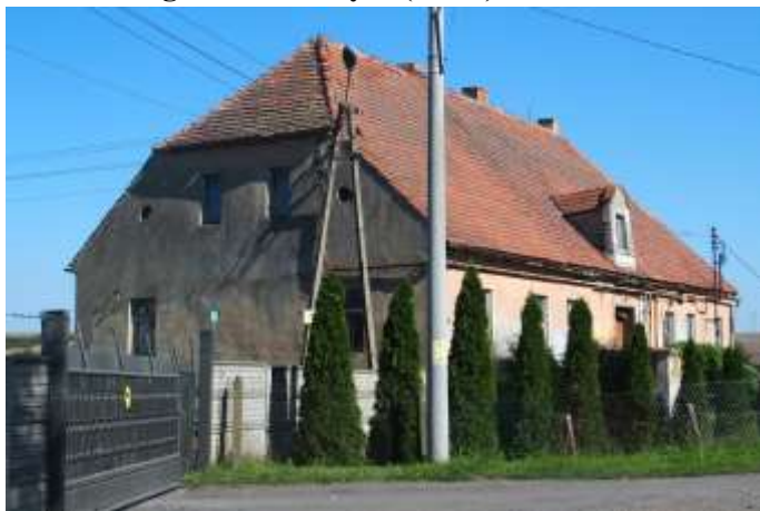
Zdjęcie nr 15. Dwór w Łagoszowie Małym (nr 45)

Dwór pochodzi z 1 połowy XIX w. Budynek wysoko podpiwniczony, jednokondygnacyjny, nakryty wysokim dachem naczółkowym z lukarną zamkniętą ćwierkolistym naczółkiem – na osi połączy frontowej, kryty dachówką ceramiczną. Drzwi – poprzedzone podpiwniczonym tarasem ze schodami, otoczonym murem balustradą – dwuskrzydłowe, opierane listwami w jodełkę. Ściany murowane, tynkowane, detal architektoniczny wykonany w tynku: gzyms wieńczący, fragmenty podziałów lizenowych. Otwory okienne prostokątne o ujednoliconych proporcjach. Stolarka dwudzielna czteropodziałowa, w części wymieniona.