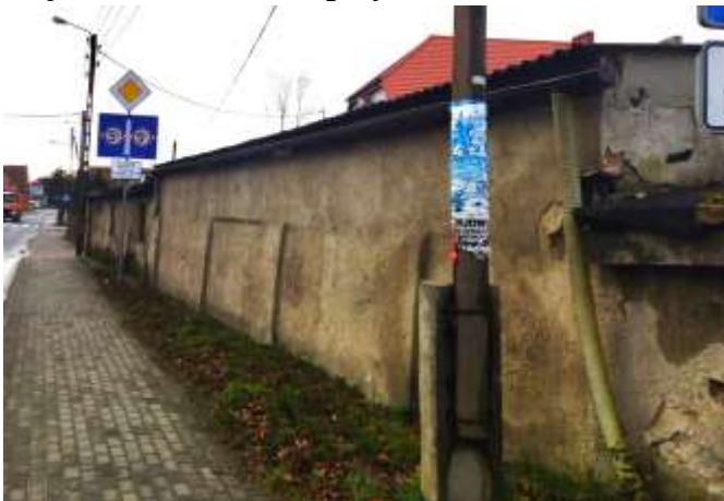
Zdjęcie nr 11. Stajnia w Kurowicach (przy nr 7)

Jednokondygnacyjny budynek z XVIII-XIX w., nakryty pulpitowym stropodachem krytym papą. Ściany murowane, tynkowane. Otwory okienne prostokątne, szklone luksferami. Stan zachowania: zły, brak piętra budynku - parter płasko nakryty, zatynkowanie blend rozczłonkowujących ściany, zmiana rozmieszczenia i kształtu okien, wymiana szklenia, uszkodzenia tynków.