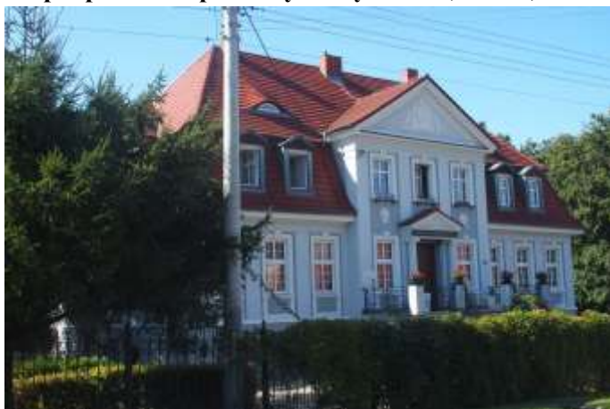
Zdjęcie nr 9. Pałac w Bądzowie (nr 30A)