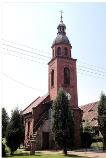
Zdjęcie nr 9. Kościół pw. Ducha Świętego, Grodziec Mały

Kościół ewangelicki, wzniesiony w 1900 r. Do lat 80-tych XX w. należał do parafii w Rapocinie, obecnie filialny parafii Wniebowzięcia NMP w Głogowie. Murowany z cegły, salowy, nakryty dwuspadowym dachem, z węższym i niższym prezbiterium – od płn.-wsch. i zakrystią przylegającą do prezbiterium od wsch. oraz z kwadratową wieżą wieńczącą kruchtę w fasadzie, dostępna po zewnętrznych schodach. Ostatnia kondygnacja wieży wieloboczna, w zwieńczeniu – pękaty hełm z ażurową latarnią. Ściany ujęte w ceglane podziały ramowe, z gzymsem kostkowym, okna zamknięte okrągłolucznie.