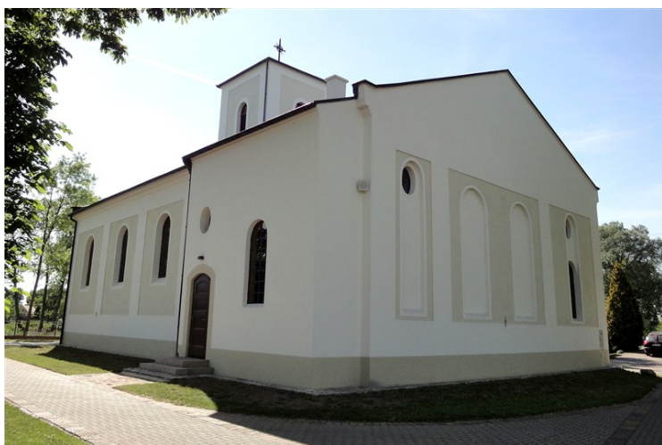
Zdjęcia 7, 8. Kościół pw. Św. Apostołów Piotra i Pawła, Serby

Kościół ewangelicki, wzniesiony w 1911 r. Zniszczony w 1945 r., odbudowany w nieco zmienionej formie w latach 1957-1959. Halowy, na rzucie prostokąta z aneksem dwukondygnacyjnej zakrystii i prostokątną, trójkondygnacyjną wieżą – usytuowanymi niesymetrycznie, w przeciwległych narożach korpusu. Ściany tynkowane fakturalnie, z gładko tynkowanymi podziałami ramowymi. Okna zamknięte łukiem okrągłym. Dach główny czterospadowy, dach wieży namiotowy.