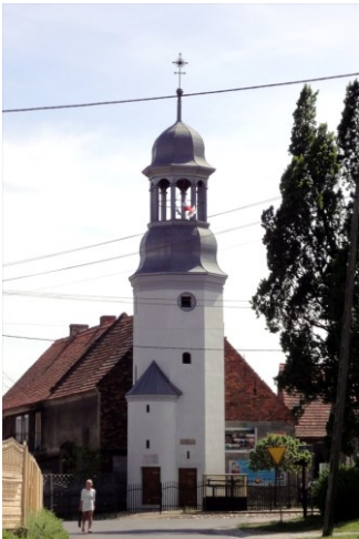
Zdjęcie nr 12. Kaplica – dzwonnica, Przedmoście