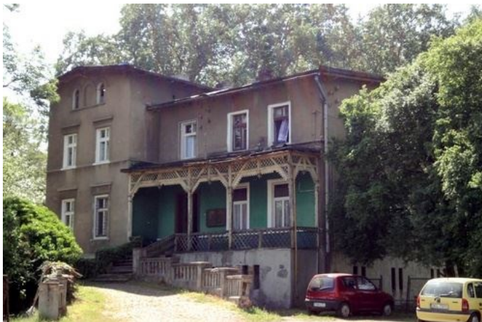
Zdjęcie nr 4. Dom zarządcy majątku w Wilkowie

Dom zarządcy majątku w Wilkowie , powstały na koniec XIX w., zachowane cechy stylowe.