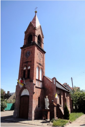
Zdjęcie nr 11. Kościół filialny pw. Narodzenia NMP, Szczyglice

Kościół filialny pw. Narodzenia NMP, Szczyglice, neogotycka, pochodzi z pocz. XIX w.