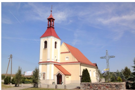
Zdjęcie nr 10. Kościół pw. św. Jana Nepomucena, Wilków