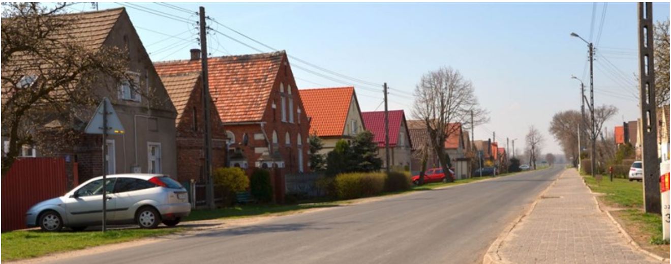
Zdjęcie nr 1. Zwarta zabudowa wsi Grodziec Mały,

źródło: http://www.ugglogow.com.pl/index.php?option=com_content&view=article&id=217:grodziec-maly&catid=65&Itemid=175