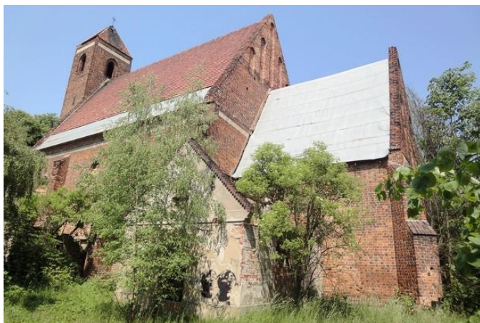
Zdjęcie nr 6. Kościół pw. św. Wawrzyńca, Rapocin