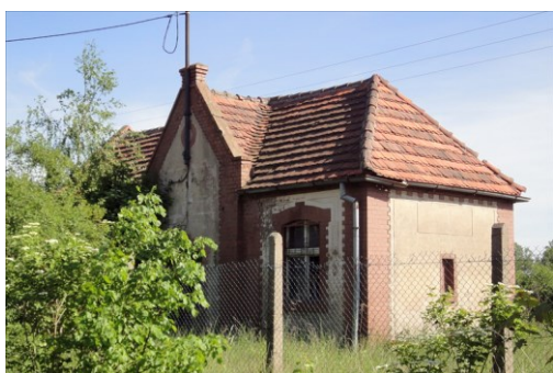
Zdjęcie nr 15. Stacja kolejowa Serby-Zachód, ob. budynek nieużytkowany, Serby