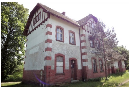
Zdjęcie nr 14. Dawny dworzec, ob. bud. mieszkalny, Wilków