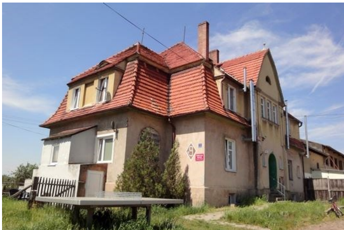
Zdjęcie nr 5. Świetlica wiejska w Serbach (nr 9)

Dworek w Starych Serbach nr 9 , tzw. dworek Pauli; wzniesiony wg proj. Karla Erbsta ze Szczecina, obecnie świetlica wiejska, data powstania: XIX/XX w.