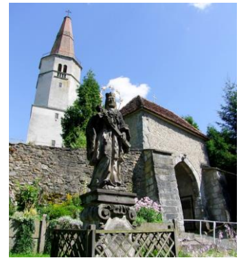
Fotografia 5. Widok na kościół filialny pw. Trzech Króli w Radostowie Średnim.