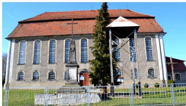
Fotografia 3. Widok na Kościół ewangelicki, ob. katolicki, filialny pw. Zesłania Ducha Św. w Mściszowie.

Obecny katolicki kościół filialny p.w. Zesłania Ducha Świętego to przedwojenny ewangelicki dom modlitwy, wybudowany w latach 1806 – 1811 w miejscu starszej drewnianej budowli. Kościół jest przykładem fryderycjańskiego nurtu świątyń ewangelickich, które cechuje tradycjonalizm i funkcjonalizm form oraz prostota i skromność detalu architektonicznego.