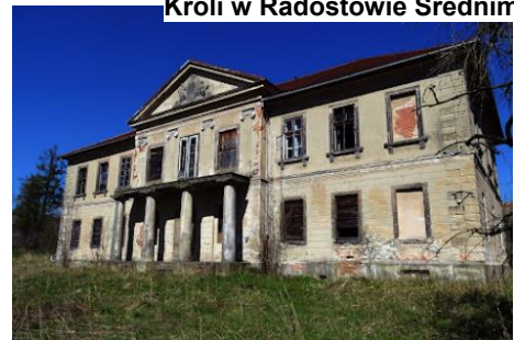
Fotografia 6. Widok na pałac w Jałowcu.

Zespół nieużytkowany w złym stanie technicznym.