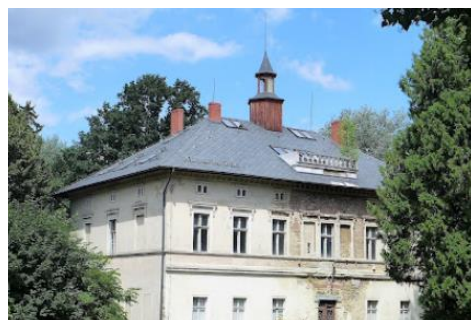
Fotografia 9. Widok na pałac w Pisarzowicach.