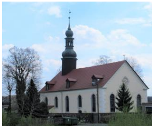
Fotografia 2. Widok na Kościół ewangelicki, ob. pw. Ścięcia Św. Jana Chrzciciela w Kościelniku.

W końcu XIX w. prowadzono prace remontowe, o czym świadczy data na elemencie konstrukcyjnym sygnaturki – 1900. Z tego czasu pochodzi eklektyczna kruchta. Kościół założony na prostym funkcjonalnym rzucie, opartym na kształcie prostokąta, o osi podłużnej wsch. – zach. rozczłonkowanego lekko w części wschodniej. Przede wszystkim należy podkreślić, że w 2 poł. XVII służyła ona protestantom z sąsiedniego Dolnego Śląska (Kwisa miała wtedy charakter graniczny) za świątynię uciezkową, co czyni z niej cenny pomnik trudnej historii pogranicza śląsko-łużyckiego. Ponadto, w jej wnętrzu można podziwiać pochodzący ze Złotori tryptyk św. Jana Chrzciciela z przełomu XV i XVI w. oraz wprawiającą w zachwyt barokową ambonę. Pod murem kościelnym można zobaczyć również XVIII wieczne epitafia ze znajdującego się obecnie w stanie całkowitej ruiny kościoła granicznego w Jałowcu. Z Jałowca pochodzi również ołtarz boczny.