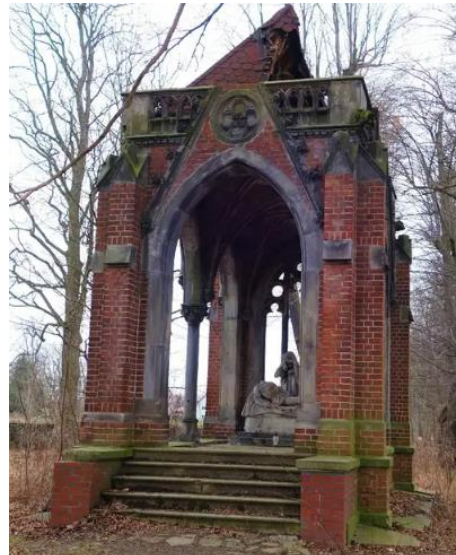
Fotografia 7. Widok na Mauzoleum Karla Roberta Lachmanna-Falkenau.

Pałac wybudowano prawdopodobnie w 2 połowie XVII w., następnie przebudowano w XVIII i XIX w. Jest on dwukondygnacyjnym mezaninem na planie prostokąta z dostawioną od zachodu przeszkloną werandą wspierającą taras widokowy. Budynek kryty czterospadowym dachem z sygnaturką i lukarnami. Kondygnacje wydzielono gzymsami i zwieńczono zdobnym gzymsiem koronującym. Elewacje 7-osiove; w pierwszej kondygnacji dwa prostokątne nadproża podkreślone prostymi nadokiennikami, na osi łukiem pełnym. Portal główny z nadprożem o dekoracji stiukowej. W