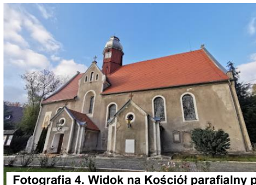
Fotografia 4. Widok na Kościół parafialny pw. Macierzyństwa NMP w Pisarzowicach.

Kościół orientowany, z korpusem składającym się z nawy i nie wyodrębnionego prezbiterium, założonym na rzucie wydłużonego prostokąta. Do dłuższych elewacji kościoła