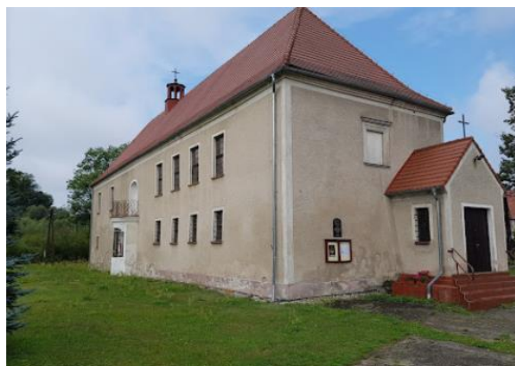
Fotografia 8. Widok na Dwór, ob. kościół filialny pw. Chrystusa Króla w Nawojowie Łużyckim.