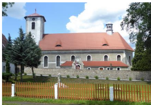
Fotografia 1. Widok na kościół w Henrykowie Lubańskim.

Kościół orientowany założony na rzucie wydłużonego prostokąta, z 5 przęsłową nawą i jednoprzęsłowym nie wyodrębnionym rzucie prezbiterium, zamkniętym trzema bokami ośmioboku. Obiekt nakryty dachem dwupołaciowym, przechodzącym nad trójbocznym prezbiterium w wielospadowy. Centralną część zachodnią stanowi osiowo ustawiona, masywna 5 kondygnacyjna wieża pozbawiona pierwotnego nakrycia.